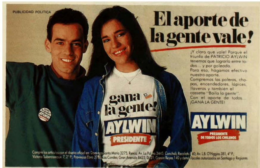
Aviso de página completa, “El aporte de la gente vale”, en Análisis , 2 al 6 de octubre de 1989.

y un 7,8% anularía o dejaría en blanco su voto. De esta forma, a esta masa electoral, desde los centros de estudio, se identificó mediante las categorías de “indecisos” o “blandos” 64 . El siguiente aviso de prensa, permite dar cuenta de lo señalado: