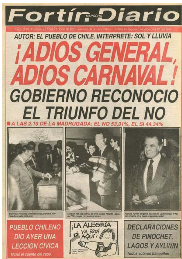
Portada de Fortín Mapocho . 6 de octubre de 1988.

Pero no sólo estas organizaciones mantuvieron una referencia a “el pueblo”. En el contexto del Plebiscito de 1988, al revisar el discurso público en los medios de difusión nacionales, encontraremos referencias transversales hacia esta categoría. La portada de Fortín Mapocho , periódico representativo de la oposición, el cual por el tono de sus portadas generaba un revuelo público debido a sus titulares confrontacionales 42 , anunció el triunfo opositor de la siguiente manera: