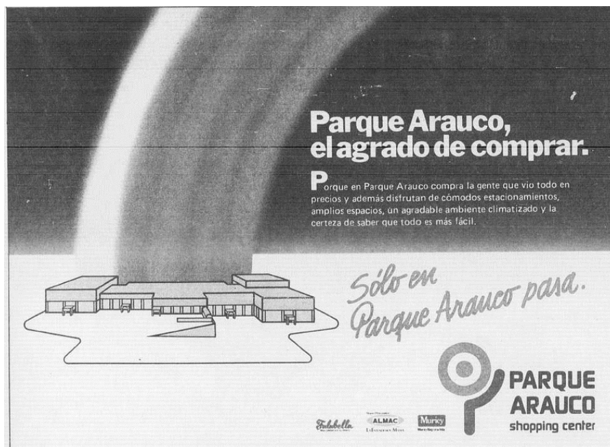
Aviso en El Mercurio . 29 de marzo de 1982.

Sin embargo, esta voz genérica y despolitizada, contrastaba con el discurso de facciones más cercanas a las organizaciones de base, quienes llamaban “al pueblo” a sumarse a la movilización social, debido al vínculo protagónico que esta referencia guardaba con la época de la Unidad Popular 41 . El siguiente manifiesto es un ejemplo de este contraste en el discurso político.