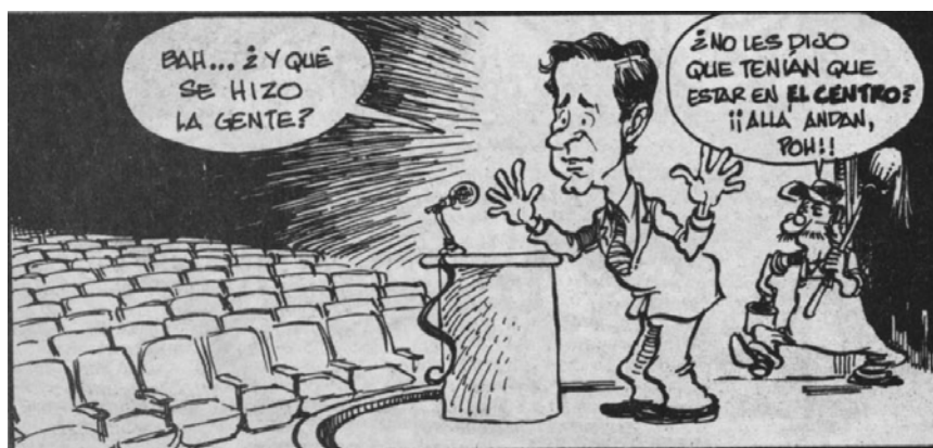
“Chuchoqueos políticos”, en Topaze. El barómetro de la política chilena . 8 de octubre de 1989.

Una caricatura sobre Francisco Javier Errázuriz, aparecida en el pasquín cómico sobre actualidad política Topaze , es muestra de lo anterior. Al verse el candidato frente a un escenario sin público, Errázuriz preguntó: “Bah... ¿y qué se hizo la gente?”. 74