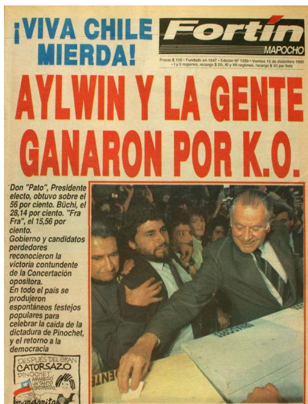
Portada de Fortín Mapocho , 15 de diciembre de 1989.

De esta manera, una vez consolidado el triunfo electoral de la Concertación el 14 de diciembre de 1989, la portada del periódico opositor Fortín Mapocho , que el 6 de octubre de 1988 había anunciado el triunfo de "el pueblo de Chile" 75 , tituló en esta oportunidad: "¡Viva Chile Mierda! AYLWIN Y LA GENTE GANARON POR K.O."