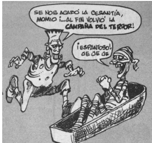
“Chuchoqueos políticos”, en Topaze. El barómetro de la política chilena . 15 de octubre de 1989.

Frankenstein corriendo hacia un ataúd a despertar una momia 70 , comunicándole que finalizaba su cesantía, ya que “al fin volvió la campaña del terror”: