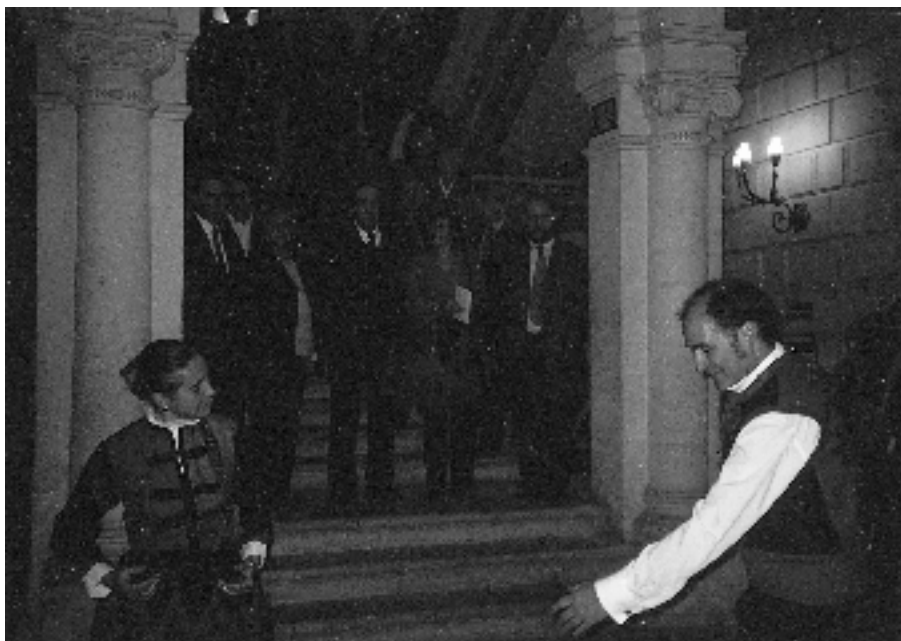
Olaeta balletaren dantzaldia, Bidebarrietako Bibliotekaren sarrera hallean.