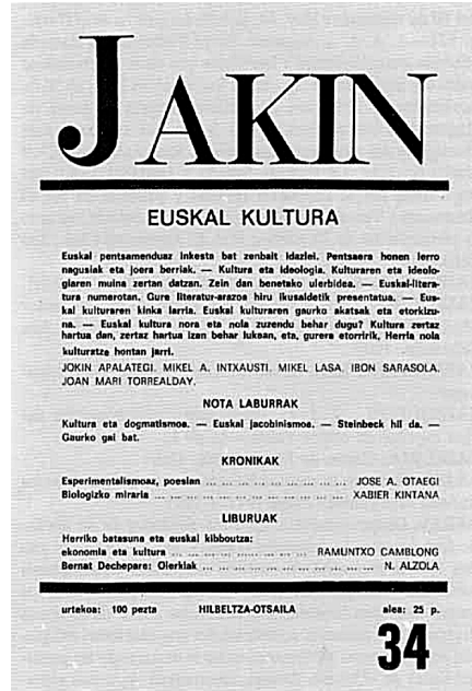
Jakinen 34. zenbakia