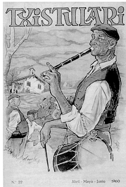
Txistulari aldizkariaren 22. alearen ataria