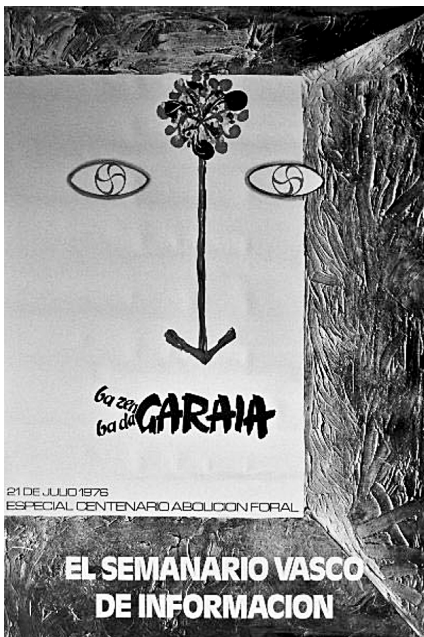
Garaia iragarten zuen kartela, 1976an