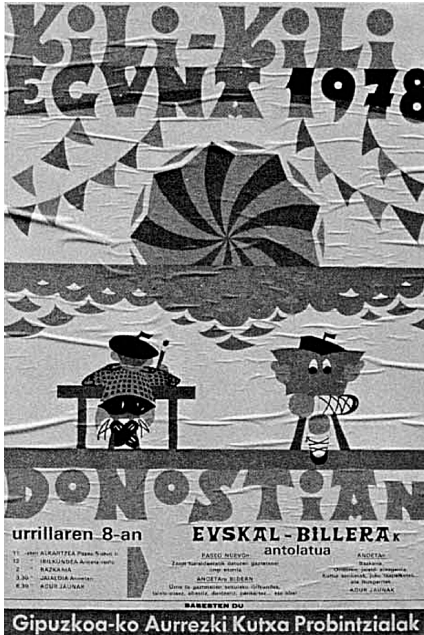
1978ko Kili-kili egunaren iragarpena