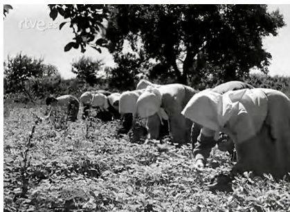
Figura 21 Agua y riqueza.

Los hombres cortan las piñas que previamente han sido señaladas y las mujeres colaboran en estas tareas ayudando al traslado y al transporte. Produce esta zona el 80% de la producción platanera de la isla, que supone en total cada año unas 800 mil piñas con un peso de 14 millones de kilos y un valor aproximado de 50 millones de pesetas.