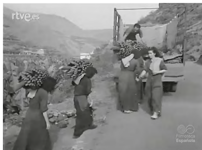
Figura 22 En la isla de la Palma.

Tampoco ponen peros las locuciones a la hora de hacer referencia al trabajo de las niñas que acompañan a sus madres en el tajo, o que forman parte directamente de las cuadrillas de trabajadoras: