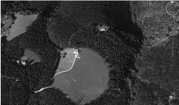
4. irudia Okiz baserria korta batean (Munitibar-Arbatzegi-Gerrikaitz).