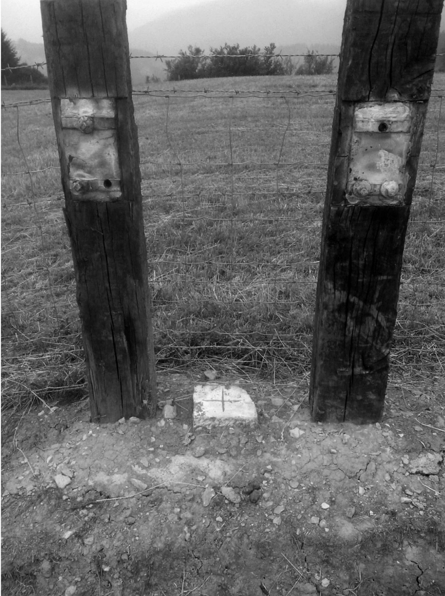
2. irudia Aramaioko Untzilla auzoko (Araba) bide kontra batean dagoen bazter-mugarria.