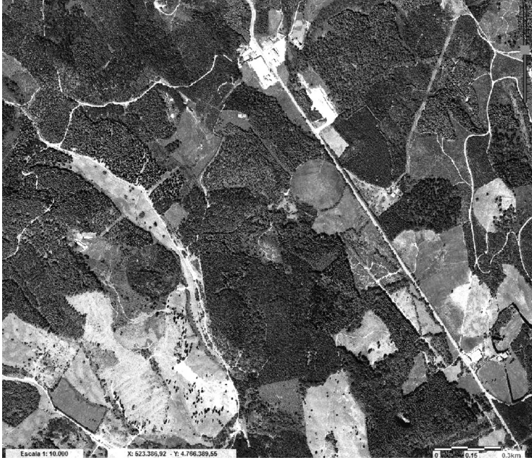
3. irudia Denetariko kortak Zeauriko Barazar inguruan (Bizkaia). 2015eko otsailaren 8an eskuratua http://apps.bizkaia.net/GRIT/