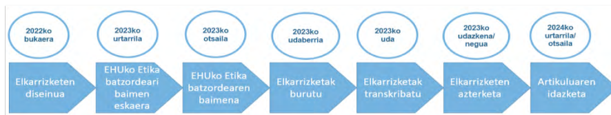
1. irudia Ikerketaren faseen eskema

Ikerketa fase guztiak era eskematiko batean 1. irudian ikus daitezke.