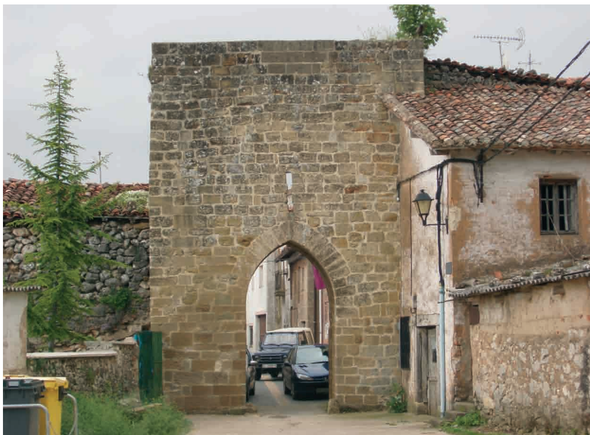
FOTO 2. Portal de la villa alavesa de Bernedo.