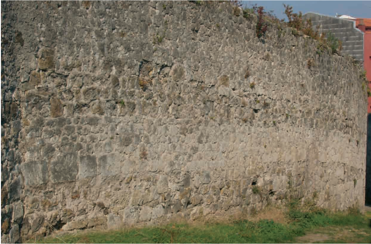
FOTO 3. Muralla de Lekeitio. Se trata del tramo del convento de las dominicas.

Pero ya adelantábamos líneas más arriba, que ninguna muralla es un elemento estático y fosilizado, sino que va evolucionando a la vez que lo hace el casco histórico al que rodea. Una de las transformaciones más evidentes es la que se da en el paso de ronda, entre la muralla y la zaguera de las casas particulares, que en su afán por ir ganando terreno público, acabarán alcanzando la línea de muralla, e incluso incorporándola a la vivienda privada. El proceso es bastante temprano en algunas villas. En San Sebastián en 1471 el concejo concede lienzos de murallas a algunos vecinos para que edifiquen sus casas junto a los muros o cercas viejas, tanto por el interior como por el exterior. Los beneficiados en este caso serán un bachiller, llamado Johan de Elduayen y Martín Sanchez Arayz 32 . En Durango se da un proceso similar, especialmente en la cerca de Kalebarria, donde se ha documentado este «ataque» al espacio público prácticamente desde el siglo XVI, y sobre todo, del XVII en adelante. Incluso se conceden permisos para abrir puertas y ventanas en la muralla.