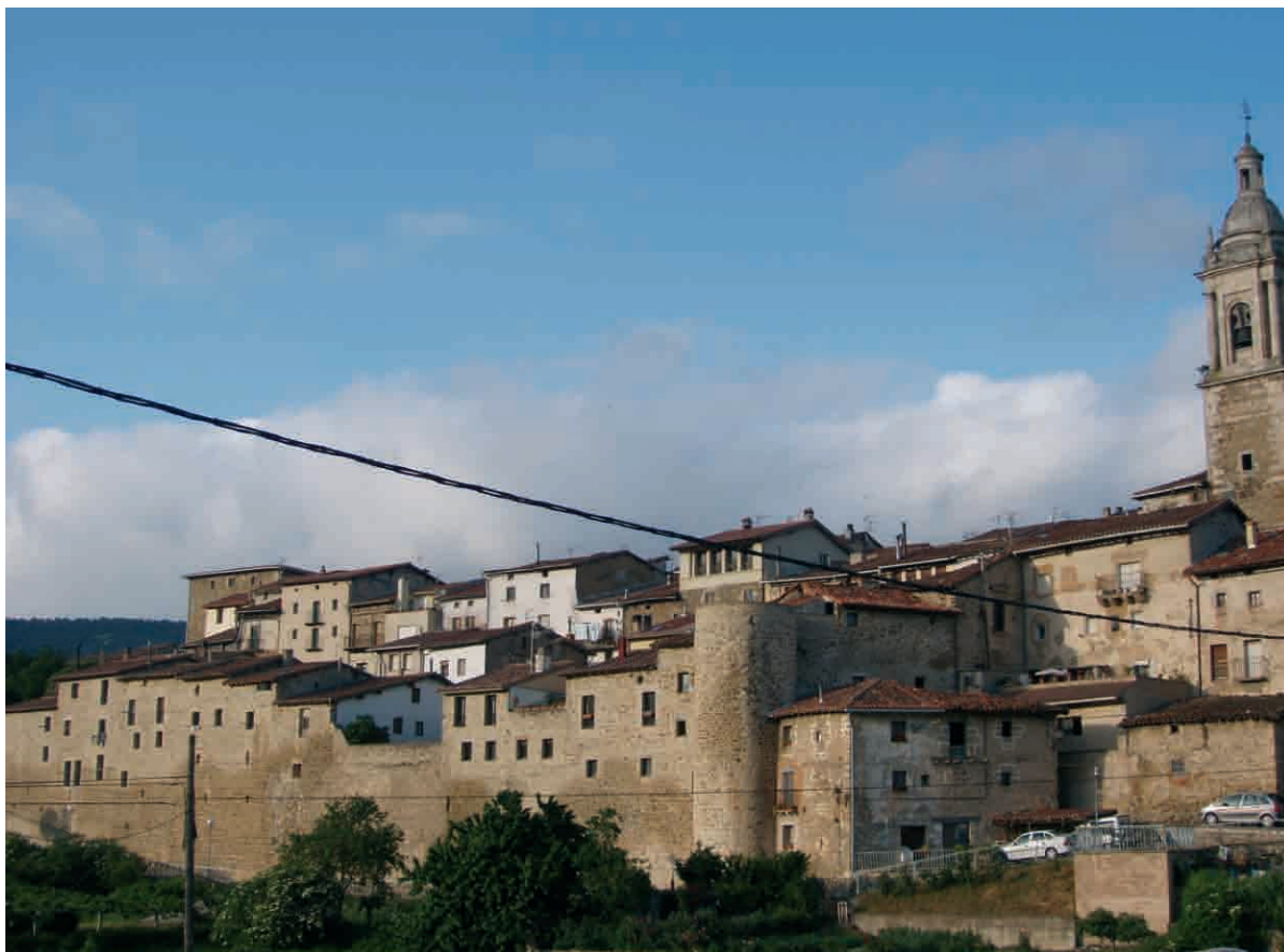
FOTO 1. La villa alavesa de Antoñana.

Pero aparte de estos estudios de villas que tienen en cuenta su conjunto, su globalidad, a partir de 2003 se ha intensificado aún más la tendencia al estudio específico de las murallas urbanas. Los índices de Arkeoikuska de los años 2003, 2004 y 2005 reflejan claramente esta preferencia y a partir fundamentalmente de 2003 los estudios histórico-arqueológicos para la redacción del planeamiento urbanístico se dedican exclusivamente a las murallas de villas medievales alavesas que conservan buena parte de su encintado. Es el caso de Bernedo, Labraza o Peñacerrada, redactados en el 2003, o el de Salinillas de Buradón y Salvatierra, proyectos estos últimos en los que se aborda un tramo concreto de las murallas, previamente estudiadas en anteriores intervenciones del mismo tipo. Incluso se puede decir que estas lecturas vienen precedidas por estudios más puntuales de esos tramos de muralla, llevados a cabo en años anteriores.