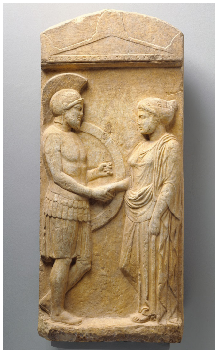
FIGURA 4. Estela de Filóxeno y Filomena (siglo IV a.n.e.), Getty Villa 83.AA.378.