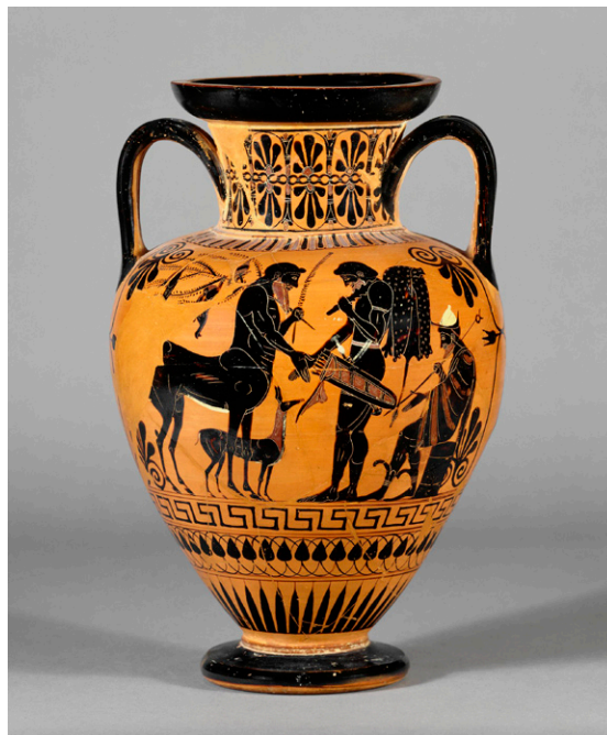
FIGURA 6. Ánfora con representación de Folo y Heracles, Museo Británico 1837,0609.42.