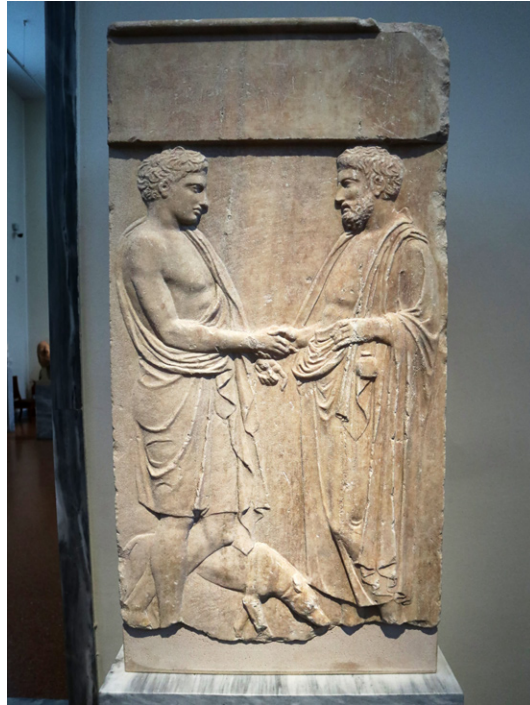
FIGURA 5. Estela con escena de dexiosis (siglo IV a.n.e.), Museo Arqueológico Nacional de Atenas 2894.