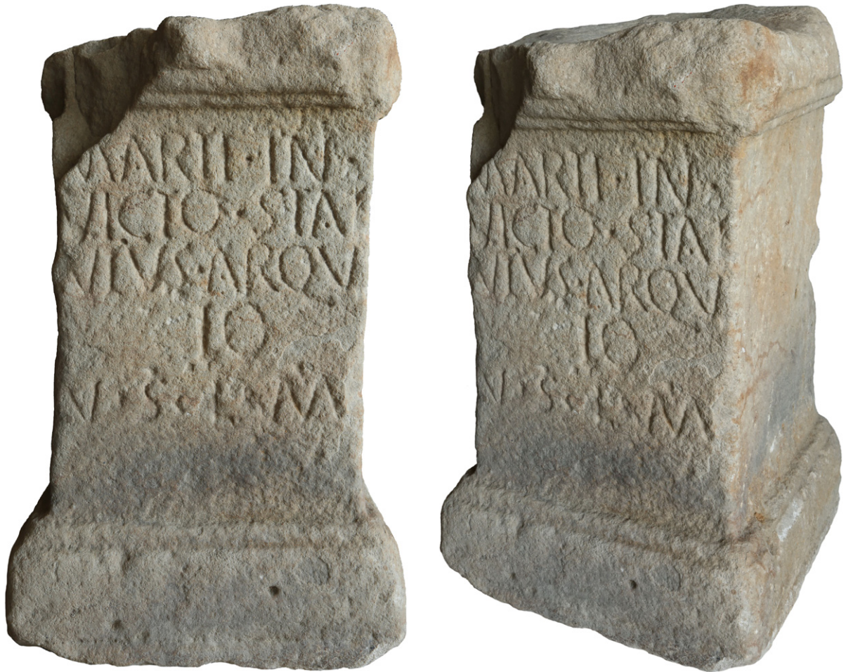
FIGURAS 2-3. Inscripción de Monteagudo.

No hay constancia de las circunstancias y el lugar exacto en el que fue descubierta la inscripción de Monteagudo. Se conoce desde mediados del siglo XIX, cuando fue donada a la recién creada Diputación Provincial de Navarra por el Marqués de San Adrián, lo que motivó su traslado a Pamplona, según recuerda E. Hübner ( apud CIL II 2990). Posteriormente formó parte de los fondos del Museo de Navarra, en cuyas salas estuvo expuesta hasta los años 80 del siglo pasado, momento a partir del cual se trasladó a los almacenes del Servicio de Patrimonio Histórico del Gobierno de Navarra, donde actualmente se conserva.