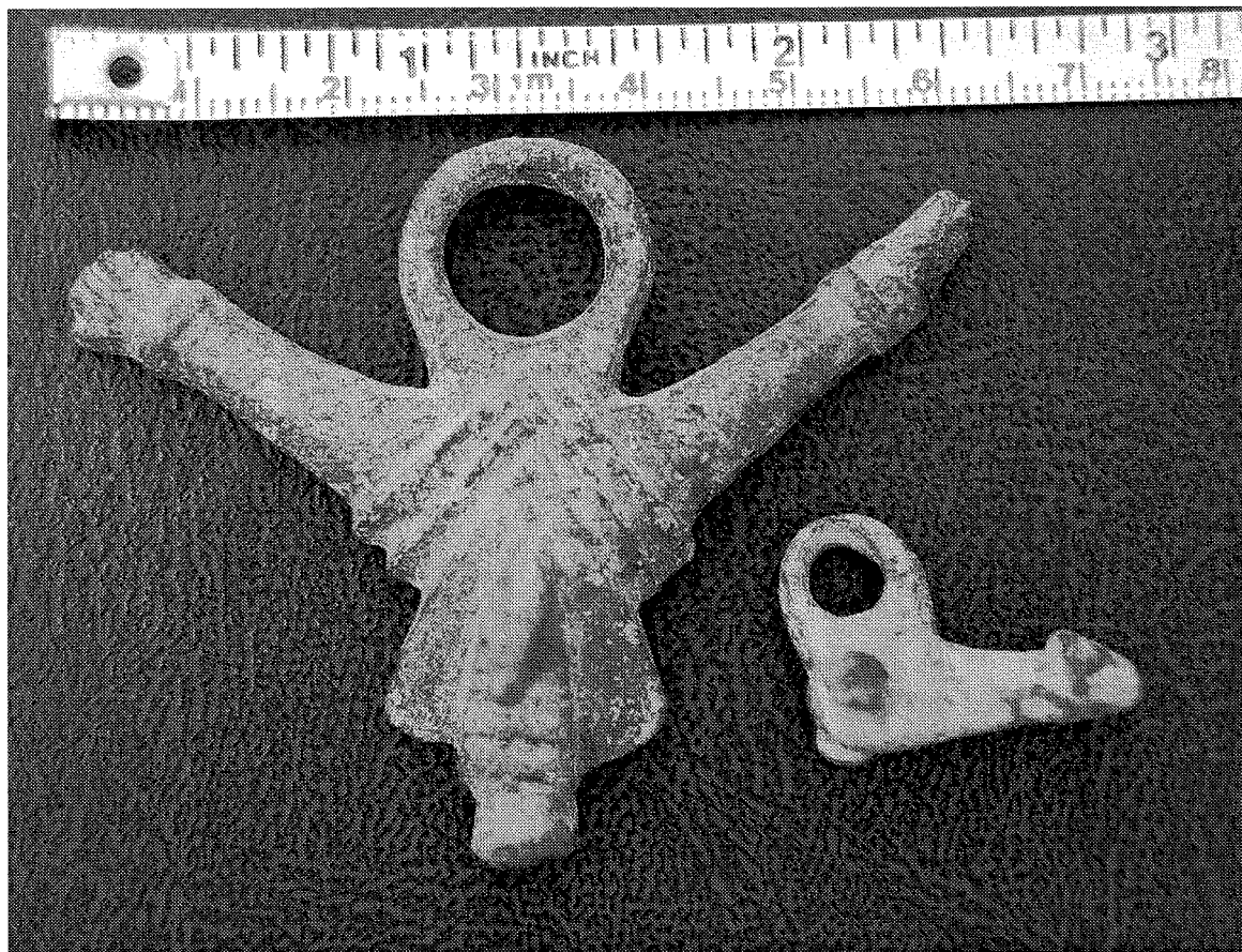
LÁMINA 2. Fallos Duratón.

4. Paralelos. A. Hernández, Juliobriga, ciudad romana de Cantabria , Santander 1946, 102.