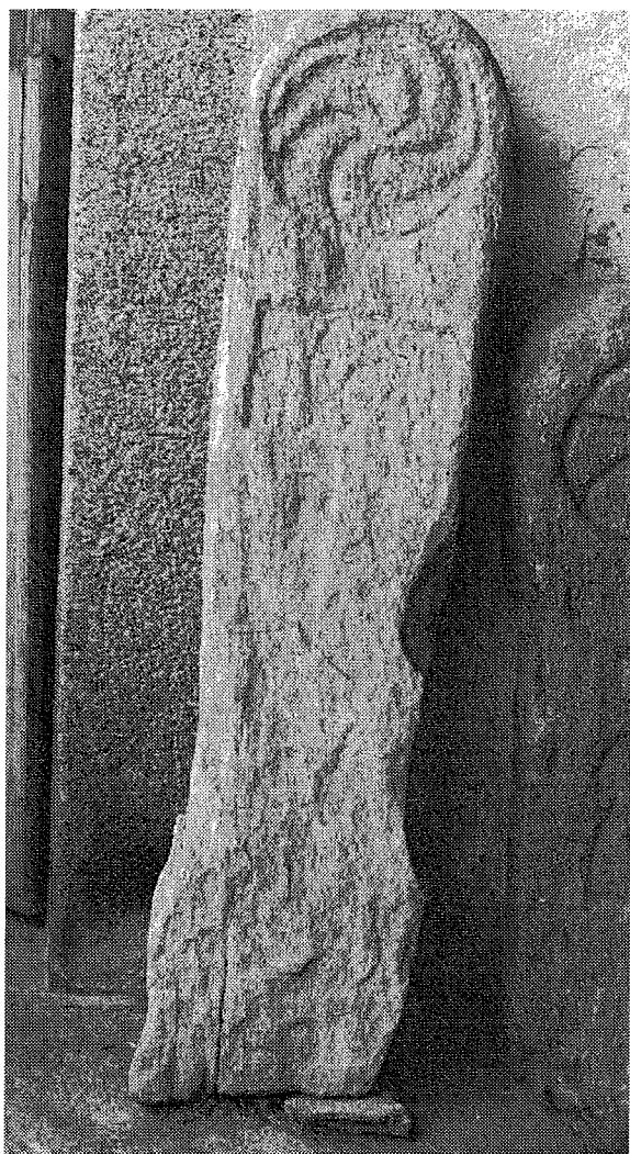
Inscripción n.º 11