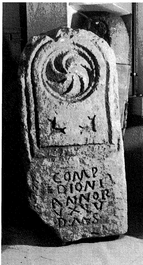
Inscripción n.º 12