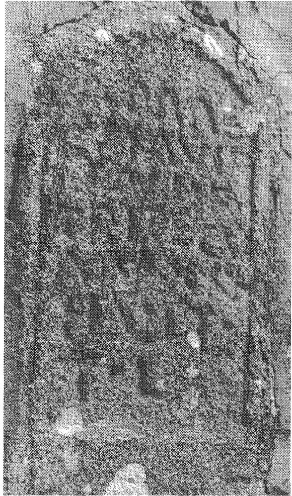
Inscripción n.º 9 (detalle)