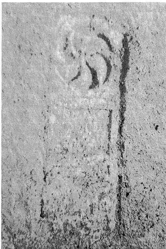
Inscripción n.º 2