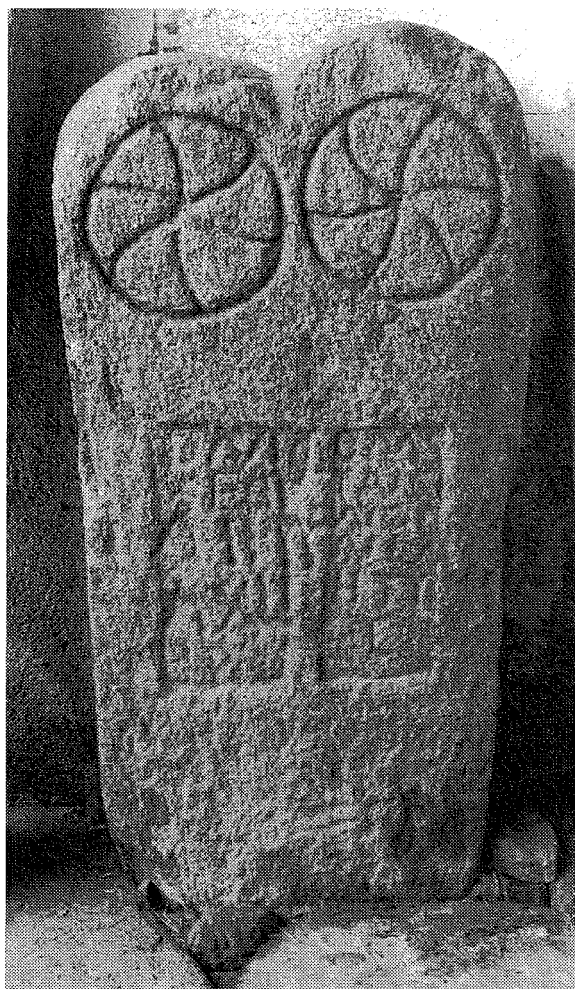
Inscripción n.º 10