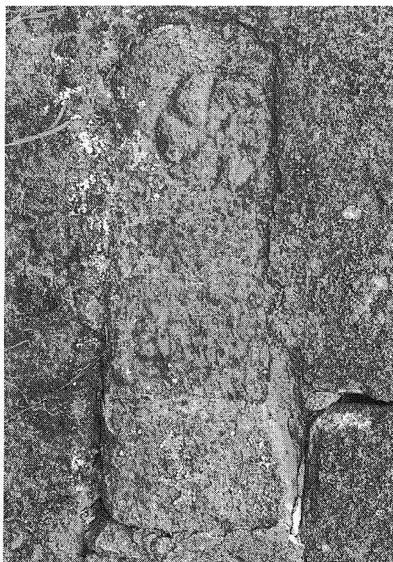
Inscripción n.º 6