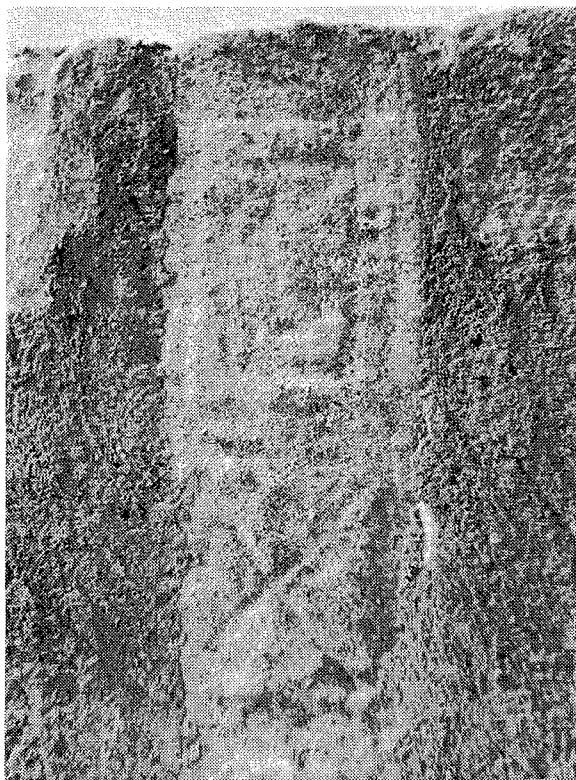
Inscripción n.º 4