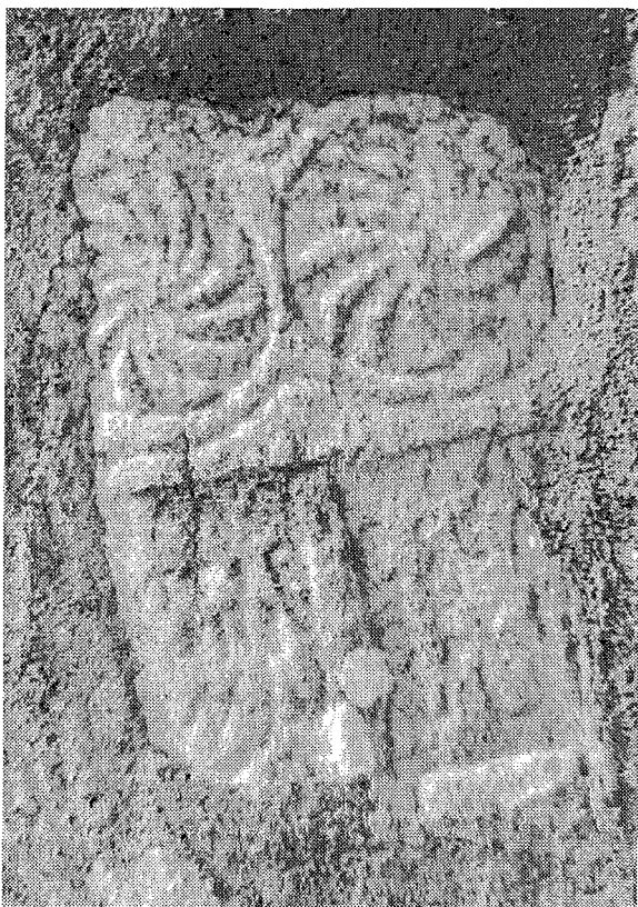
Inscripción n.º 5