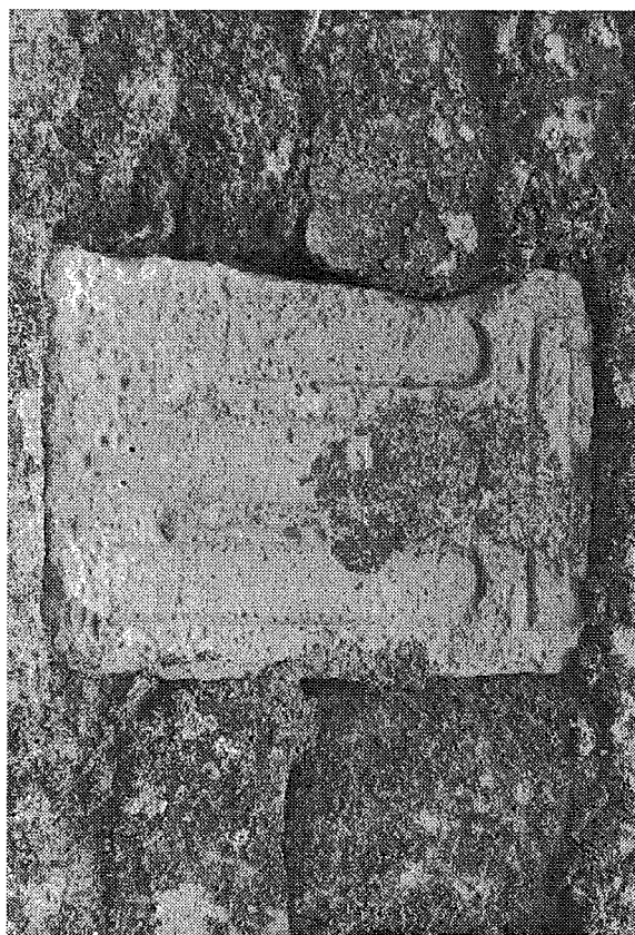
Inscripción n.º 8