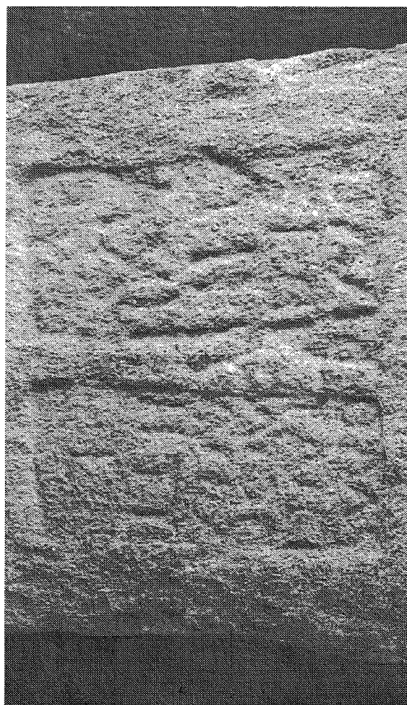
Inscripción n.º 10 (detalle)