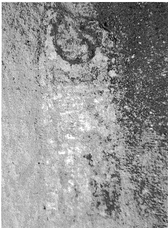
Inscripción n.º 3