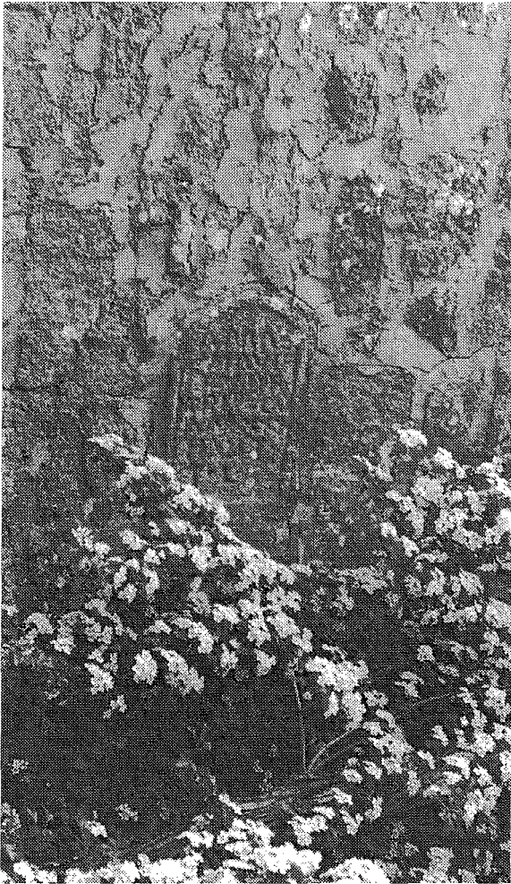
Inscripción n.º 9