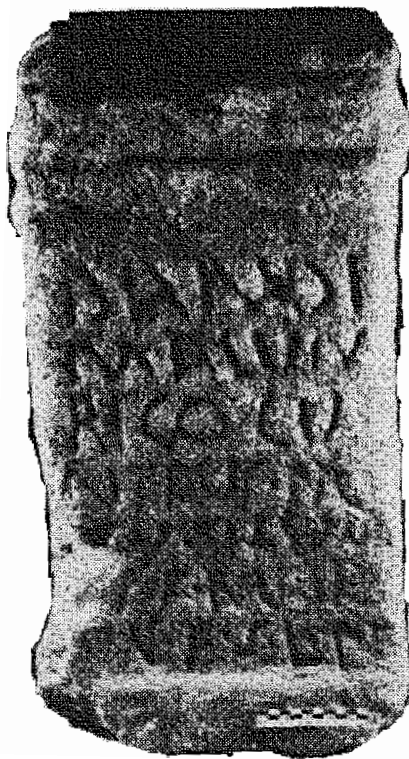
FIGURA 2. El ara de Bandua Malunaicus.

BANDI MALVN AIC● CV NTIVS • M 5 -V—I-SV- S • F • A-V VN • F • S • L • M