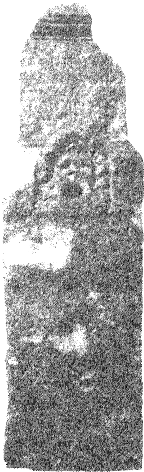
FIGURA 4. Miliario-fuente de Lyon