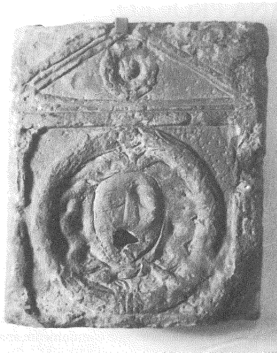
FIGURA 1. Soporte de caño de San Martín de Laspra