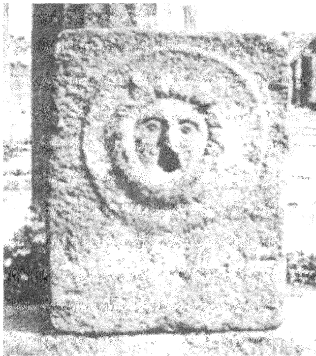
FIGURA 2. Soporte de caño con gorgona procedente de Pompeya