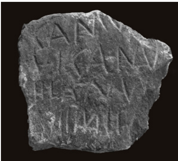
FIGURA 4. Epígrafe de Paredes.

Por el lateral derecho muestra evidentes pérdidas en las esquinas superior e inferior, reciente la de la esquina inferior, a juzgar por la ausencia de pátina del plano de fractura. Por el contrario, los bordes superior y derecho están completos sin pérdidas de caracteres, lo que permite asegurar la lectura desde la izquierda. Sus dimensiones actuales alcanzan 255 mm de altura, 235 mm de anchura y 112 mm de grosor (figs. 4 y 5).