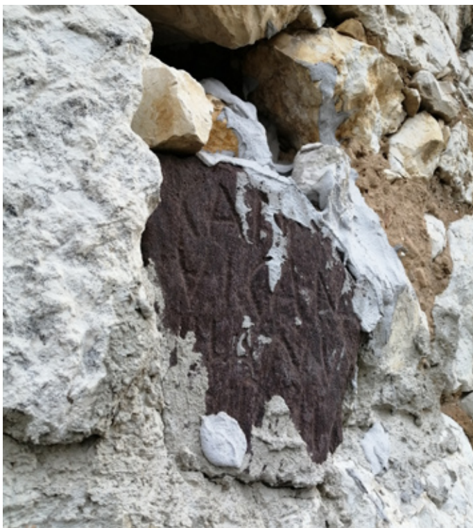
FIGURA 1. El epígrafe en la situación en la que fue hallado.