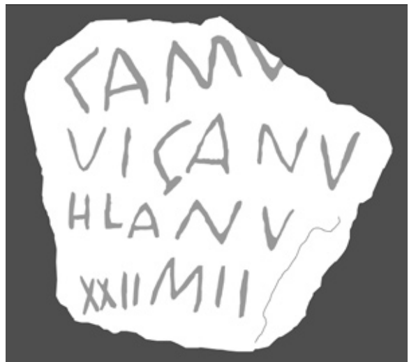
FIGURA 5. Calco.