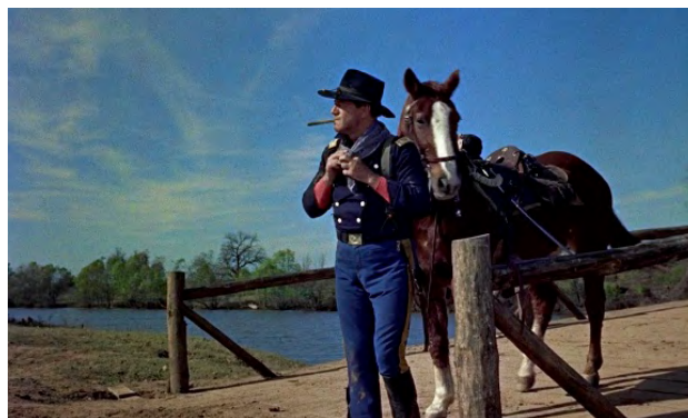
FIGURAS 15 y 16

El traspaso del pañuelo como elemento de enlace