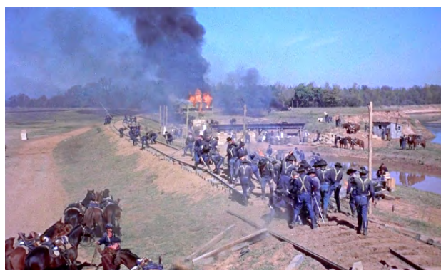
FIGURA 14 La destrucción del Sur

La película se cierra prácticamente con otra mirada de Hannah hacia el fuera de campo. Lo que otea en esta ocasión es la figura de Marlowe alejándose a caballo tras declararle lacónicamente un amor de presente imposible y futuro incierto. Durante la despedida se escuchan, como en otros momentos compartidos por ambos personajes, las suaves notas de Lorena , canción especialmente popular en el Sur, en la que su autor J.P. Webster se refiere a un amor personal perdido a causa de una prohibición 7 . Antes de partir, Marlowe retira el pañuelo que cubre el cabello de Hannah [figura 15], se ata la prenda al cuello y en-