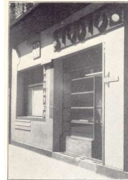
Fig. 2) Studio de Arquitectura. José Manuel Aizpúrua y Joaquín Labayen. 1928. Publicado en la revista Cortijos y rascacielos en la primavera de 1931