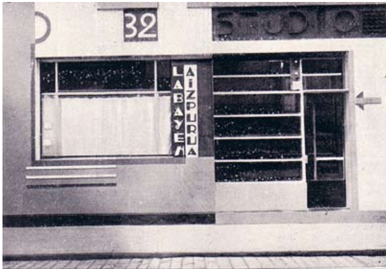
Fig. 1) Studio de Arquitectura. José Manuel Aizpúrua y Joaquín Labayen. 1928. Publicado en la revista Arquitectura en noviembre de 1928

Sin embargo, Aizpúrua y Labayen, que Mercadal presentó como los adalides de un cambio del panorama arquitectónico en el País Vasco, tan sólo habían construido su propio estudio de trabajo (Fig.1 y 2), y el menos atrevido