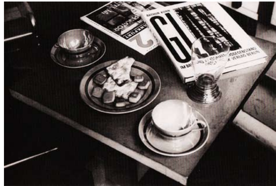
Fig. 10) “Naturaleza muerta pero con espíritu vital”. José Manuel Aizpúrua. 1929. Fotografía publicada en la revista La Gaceta Literaria el 15 de abril de 1930

En consecuencia, la mayor parte del mobiliario del estudio se caracterizó por la sencillez y ligereza de sus formas, que contribuyeron a crear un ambiente diáfano en un espacio reducido. En palabras de Aizpúrua y Labayen, en referencia al mobiliario del Club Náutico que podríamos extrapolar al estudio, “todo él responde a la idea de algo de fácil manejo; limpieza y conservación” 40 .