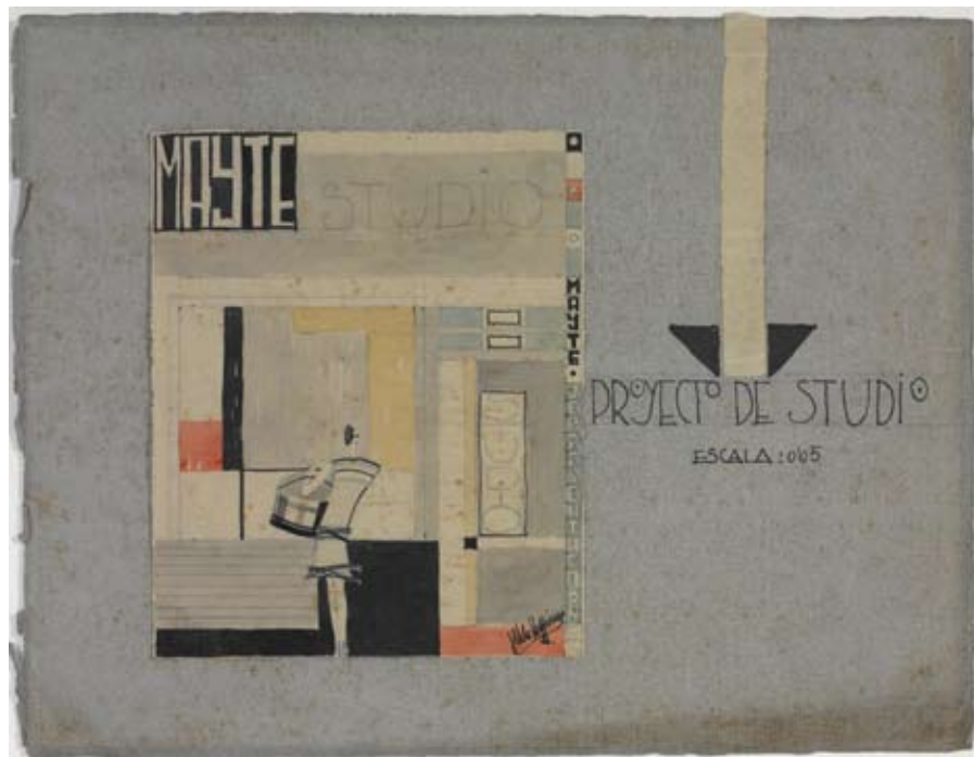
Fig. 4) Mayte Studio. José Manuel Aizpurua. 1928.

guarda muchas similitudes con su despacho, o los que recoge en su carné de dibujos de 1928 26 .