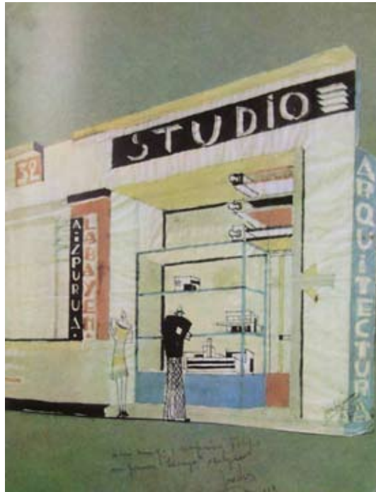
Fig. 5) Boceto del Studio de Arquitectura. José Manuel Aizpúrua. 1928. Publicado en la revista Nueva Forma en 1969

tapicería contiguo. Una foto, seguramente tomada por el propio Aizpúrua y remitida a Doesburg, quizás a través de Mercadal, se publicó en marzo de 1930 en la revista Het Bouwbedrijf 28 (Fig.6). En la fotografía se puede apreciar la diferencia y el cambio que supuso la propuesta de Aizpúrua y