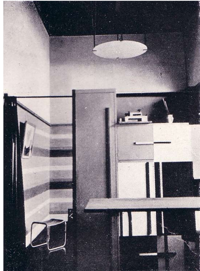
Fig. 7 y 8) Interior del Studio de Arquitectura. José Manuel Aizpúrua y Joaquín Labayen. 1928. Publicado en la revista Arquitectura en noviembre de 1928