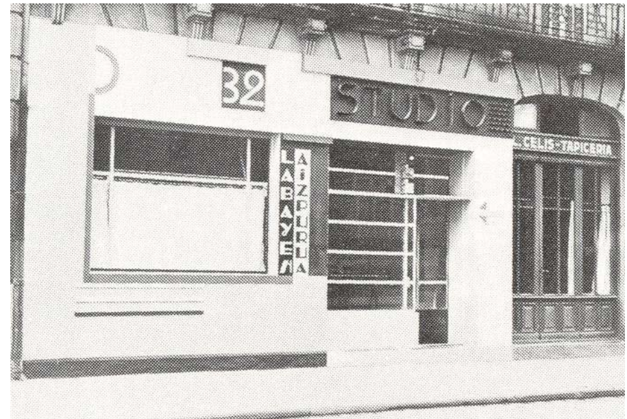
Fig. 6) Studio de Arquitectura. José Manuel Aizpúrua y Joaquín Labayen. 1928. Publicado en la revista Het Bouwbedrijf en 1930

La superficie abierta a la calle del estudio, sobresalía de la línea de fachada del edificio y destacaba por su el uso de carpintería metálica, que no fue