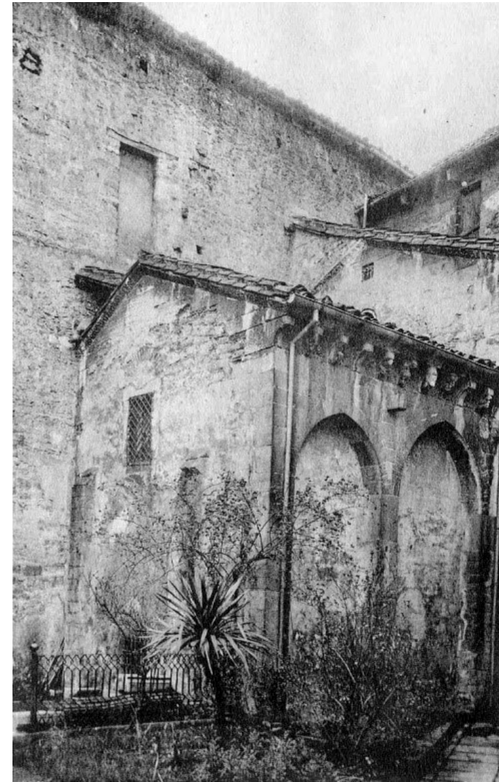
Fig. 1: Cámara Santa (exterior), Catedral de Oviedo. Hauser y Menet, hacia 1930. Archivo Municipal de Oviedo

Durante siglos, no consta ningún traslado de la pieza fuera de los muros de la Catedral de Oviedo y, sin embargo, sería a lo largo de unos pocos años de la pasada centuria cuando se concentrasen los mayores movimientos de la misma. De este modo, el Arca de las reliquias ovetense acompañó a otras preciadas piezas esenciales del tesoro catedralicio para ser expuestas en la Exposición Internacional de Barcelona celebrada en el Palacio Nacional