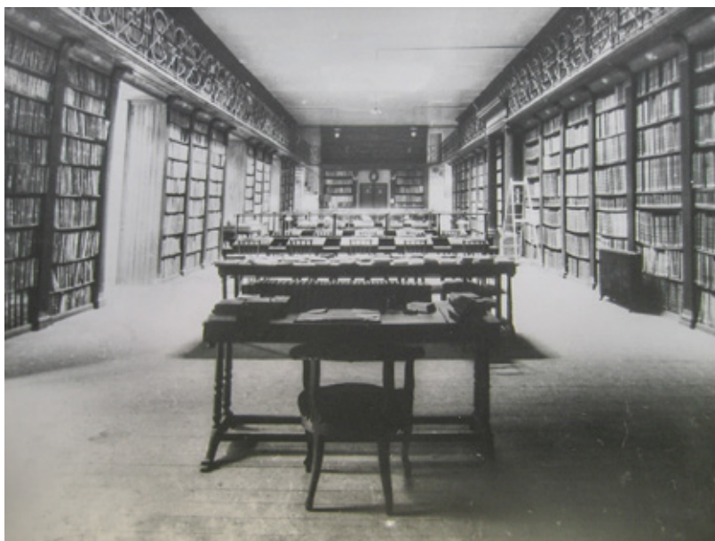
Fig. 3: Biblioteca de la Universidad de Oviedo, ante.1934.

Una vez reunidos los fragmentos en que quedó cuarteada el Arca, y debidamente asegurados, se produjo la entrega 18 al profesor Manuel Gómez-Moreno (1870-1970) para proceder a su restauración en Madrid, que se llevó a cabo en el Instituto Valencia de Don Juan, entidad privada dirigida esos años por el arqueólogo granadino y que tenía su sede en la céntrica calle Fortuny de la capital. Concluidos los trabajos, Gómez-Moreno comunicó al Patronato del Museo del Prado «que se halla terminada la restauración del Arca Santa de la Catedral de Oviedo» 19 .