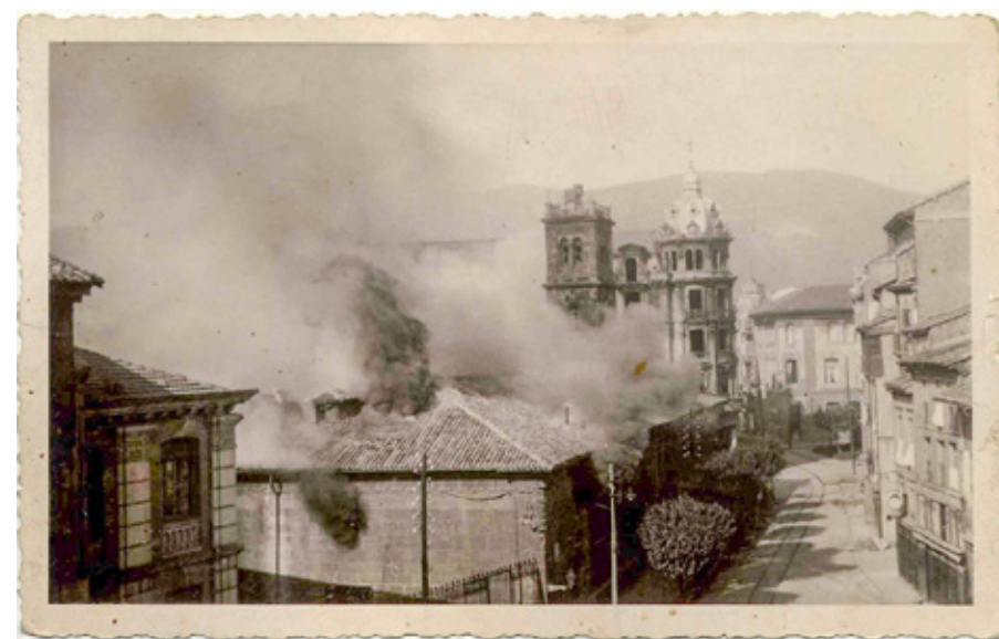
Fig. 4: Universidad en llamas durante los Sucesos de Octubre de 1934.

Una vez reunidos los fragmentos en que quedó cuarteada el Arca, y debidamente asegurados, se produjo la entrega 18 al profesor Manuel Gómez-Moreno (1870-1970) para proceder a su restauración en Madrid, que se llevó a cabo en el Instituto Valencia de Don Juan, entidad privada dirigida esos años por el arqueólogo granadino y que tenía su sede en la céntrica calle Fortuny de la capital. Concluidos los trabajos, Gómez-Moreno comunicó al Patronato del Museo del Prado «que se halla terminada la restauración del Arca Santa de la Catedral de Oviedo» 19 .