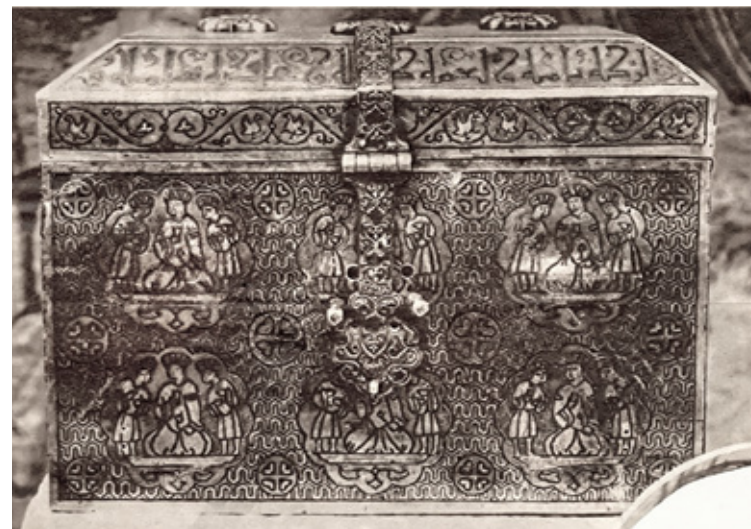
Fig. 6: Arqueta de Santa Eulalia de Mérida en el Museo del Prado, 23 de mayo de 1935. Archivo del Museo Nacional del Prado, Caja 4016, Exp. 10001, f. 48. Ahora, 24 de mayo de 1935

pétreo 30 . Convivieron durante esos días las piezas ovetenses con un tapiz del legado por el Duque de Tarifa, expuesto igualmente en la sala de acceso a la selección del fondo escultórico 31 . Se trataba del espacio conocido entonces como sala L, en el vestíbulo 32 de la rotunda de la planta baja del Museo del Prado, la zona más novedosa del centro, inaugurada el año 1934 en el marco de un Congreso de Museografía, cuyas obras de acondicionamiento estuvieron a cargo del arquitecto conservador del museo Pedro Muguruza (1893-1952) 33 .