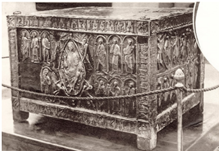
Fig. 5: Arca Santa en el Museo del Prado, 23 de mayo de 1935. Archivo del Museo Nacional del Prado, Caja 4016, Exp. 10001, f. 48. Ahora, 24 de mayo de 1935