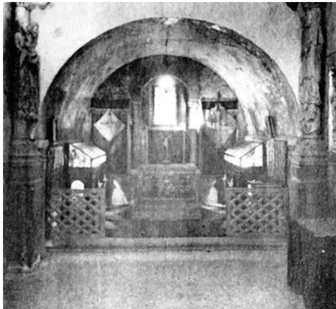
Fig. 2. Cámara Santa (interior), Catedral de Oviedo. Hauser y Menet, 1930. Archivo Municipal de Oviedo

Tras su devolución en el inicio del año 1930, la tranquila presencia de esta obra maestra de la orfebrería hispana se vio pronto truncada por lamentables sucesos. Así, el 11 de octubre de 1934, una letal carga de dinamita alojada en el piso inferior de este martyrium hizo que todas las joyas y reliquias se precipitaran hasta el mismo suelo de la Cripta de Santa Leocadia y se entremezclaran con escombros y cascotes provenientes del suelo, los muros y hasta la bóveda celeste de la Capilla de San Miguel 7 . Allí, la pudo contemplar, días más