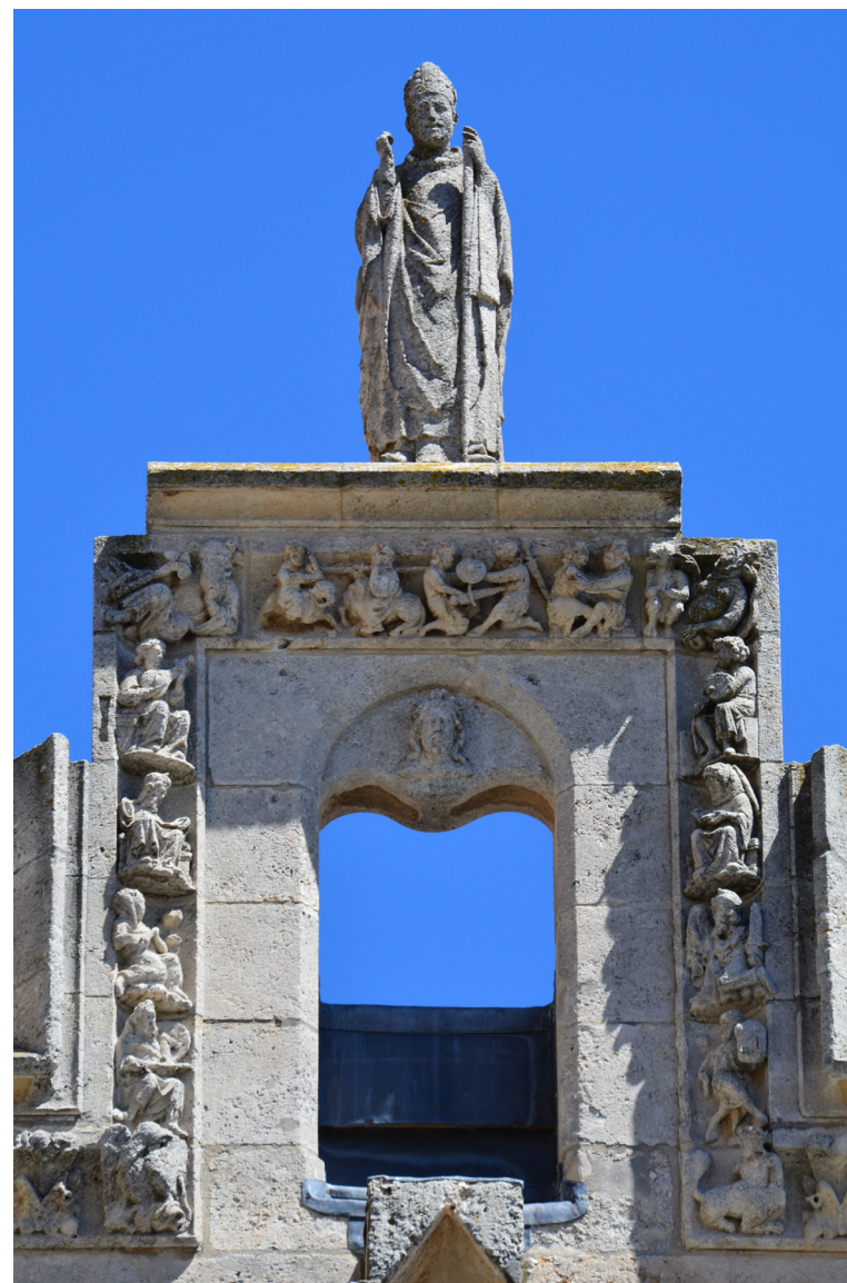
Fig. 3: Capilla de Santa Catalina, Catedral de Burgos, coronamiento occidental