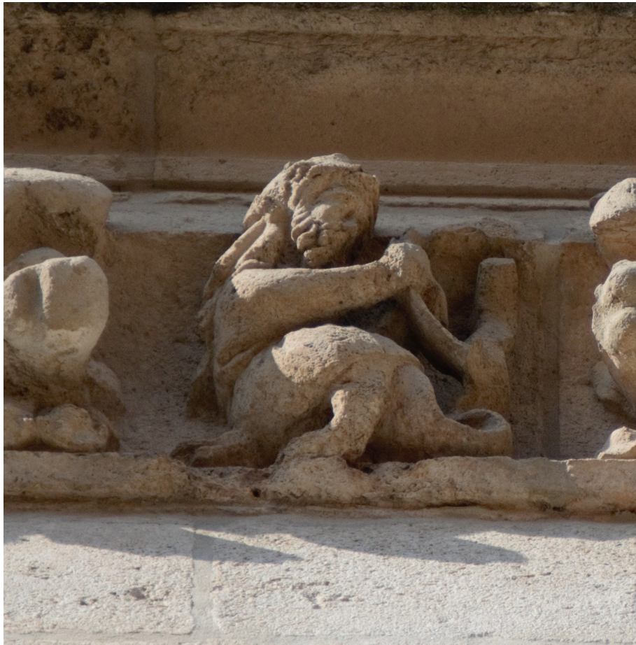
Fig. 5: Capilla de Santa Catalina, Catedral de Burgos, cornisa oriental, posible salvaje