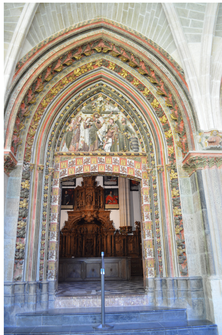
Fig. 1: Puerta de la Capilla de Santa Catalina, Catedral de Burgos

La composición y las referencias a la monarquía de los elementos ornamentales de la puerta de la capilla están relacionados con la puerta del claustro labrada décadas antes en el brazo sur del crucero de la catedral, de la que toma el arco escarzano del vano y la ornamentación de castillos y leones que reviste el arco y las jambas, modalidad decorativa de la segunda mitad del siglo XIII que se mantuvo vigente en los primeros años del siglo XIV 2 . La referencia explícita a la monarquía de la portada tiene continuación en el programa escultórico interior y es coherente con la voluntad del obispo don Gonzalo de Hinojosa, promotor de la capilla, de revitalizar las relaciones de su catedral con la monarquía 3 .