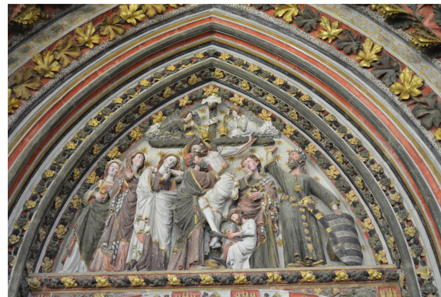
Fig. 2: Tímpano de la portada de la Capilla de Santa Catalina, Catedral de Burgos

El aspecto iconográfico más interesante es la figura situada a continuación de San Juan, en correspondencia con las dos santas mujeres del lado opuesto. Ha sido identificado como el centurión 9 que se convierte después del oscurecimiento del Sol. No es algo extraño, pues Longinos fue incluido en la Leyenda Dorada . Está representado de pie, señalando al cielo con el dedo índice de la mano derecha 10 , alzada hasta alcanzar el travesaño de la cruz, o bien indicando a Cristo 11 . En una ilustración de una traducción francesa del Speculum