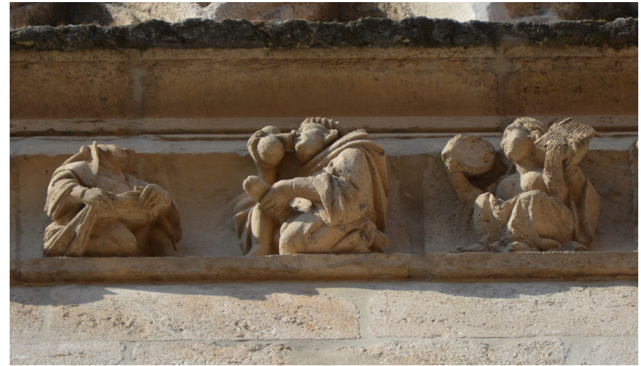
Fig. 6: Capilla de Santa Catalina, Catedral de Burgos, cornisa oriental, escena procaz

manuscrito del siglo XIV 27 . Esta misma asociación se encuentra en el texto del Roman de la Rosa 28 . Un espejo lleva también la Dama Ociosa en ilustraciones de algunos manuscritos franceses del siglo XIV de este roman , en el episodio en el que invita al Amante a entrar en el Jardín del Placer 29 , donde está representada portando un espejo y un peine 30 , atributos que responden a una larga tradición iconográfica. En otros ejemplares coetáneos se representa la Ociosidad solamente con un espejo en la mano hablando con el amante 31 .