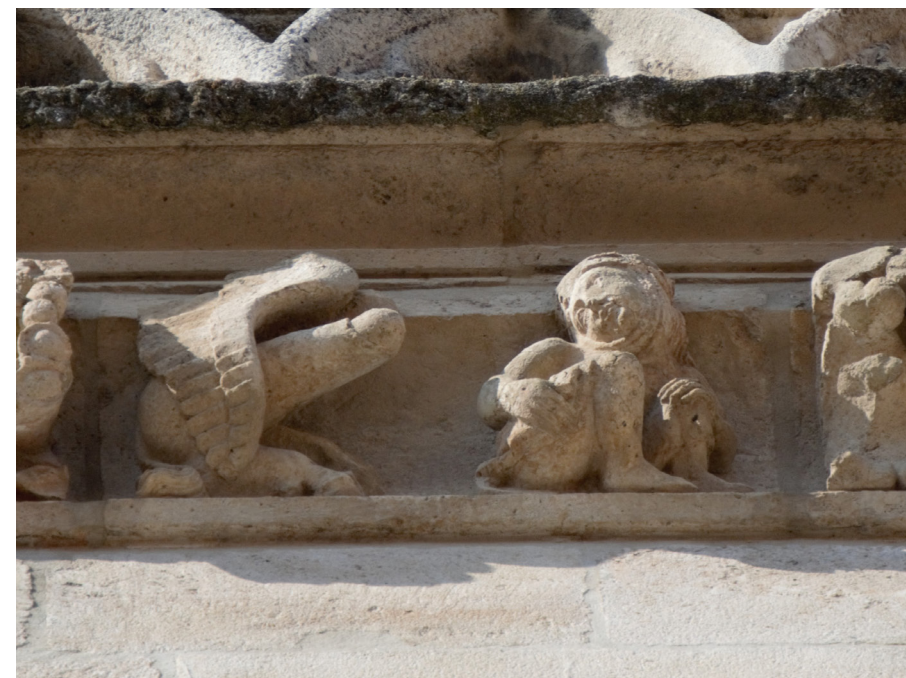
Fig. 7: Capilla de Santa Catalina, Catedral de Burgos, cornisa oriental, escena procaz

La otra escena está integrada por una mujer y un gran falo con pezuñas y cola de equino cabalgado por un segundo falo alado. La mujer está de espaldas a la imagen itifálica, pero vuelve la cabeza hacia ella al tiempo que se remanga el vestido (Fig. 7). Se trata de una representación del pecado de la lujuria, que en la Edad Media la Iglesia vinculaba preferentemente a la mujer; además, la posición sexual que adopta esta es opuesta a la defendida como canónica por los eclesiásticos 33 . Por su parte, la presencia del falo erecto entronca formalmente con el fascinum , amuleto muy extendido entre los romanos y que se usaba como protección contra el mal de ojo 34 . Desde un punto de vista formal, el motivo esculpido en la cornisa de la Capilla de Santa Catalina es similar a algunos tintinnabula romanos de bronce, en los que el falo erecto está dotado de alas y elementos zoomorfos 35 .