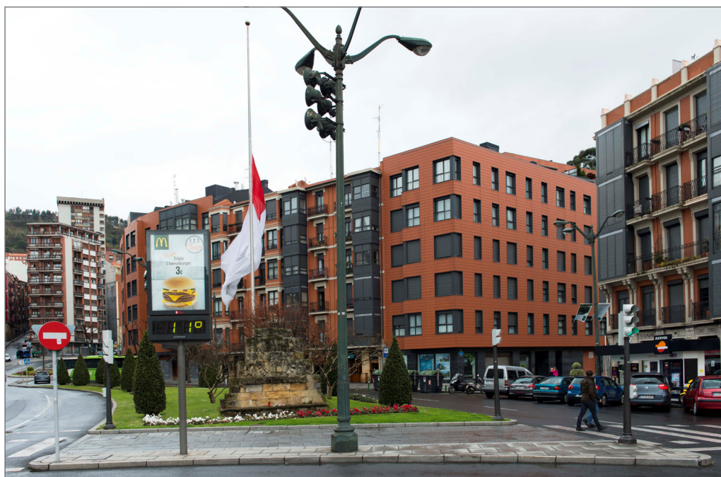
Figura VIII. Plaza Ernesto Erkoreka de Bilbao. Anuncio publicitario de Mac Donalds, El banco de Beteluri, logotipo de Repsol y bandera de Bilbao a media asta.

de adquirir un sentido simbólico por medio de la escultura, la arquitectura y el poder de representación de ambas, deben mucho a la política, al discurso social, cultural y al poder económico, aspecto éste último que ha transformado la idea de espacio y cuerpo en la modernidad. Sostiene al respecto Félix Duque que en la modernidad, lo que se construye dentro del espacio tiene un carácter integral (Duque 2001, 10-11). La relación arquitectura y escultura, da pie a una nueva planificación del espacio in extenso en relación con el cuerpo y sus movimientos y trayectorias, donde el cuerpo en la modernidad es una masa atómica sin lugar propio dentro de un espacio ambivalente entre lo público y lo privado. En el espacio, se constituyen por efecto universos simbólicos, masas de conjuntos de códigos que no todos saben utilizar y que dan a algunos las claves para acceder a otros lugares, pueden ser los lugares de la élite ideológica, económica o política, lugares a los que la gran mayoría no accedemos, aspecto éste último que pone en cuestión el sentido del espacio público y espacio privado en la ciudad (Augé 2004, 39).