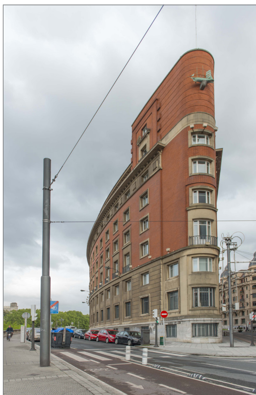
Figura III. El Edificio Naviera Aznar. Arquitecto. Manuel Galíndez 1948 Fotografía derecha: Naviera Aznar. Fachada norte. Foto: Juan Carlos Gonzalez Astorga 2014

A principios del siglo XX, el espacio público en Bilbao interacciona con cuestiones sociológicas, la salud, la geografía, el arte, la arquitectura; necesita de más mecanismos de organización que permitan un ordenamiento del territorio. Desde el siglo XIX la implantación urbanística de Bilbao estuvo vinculada con la industria y el comercio marítimo, sin tomar en cuenta las zonas de recreo y cultura para los ciudadanos (Gonzalez Portilla 2009, 30).