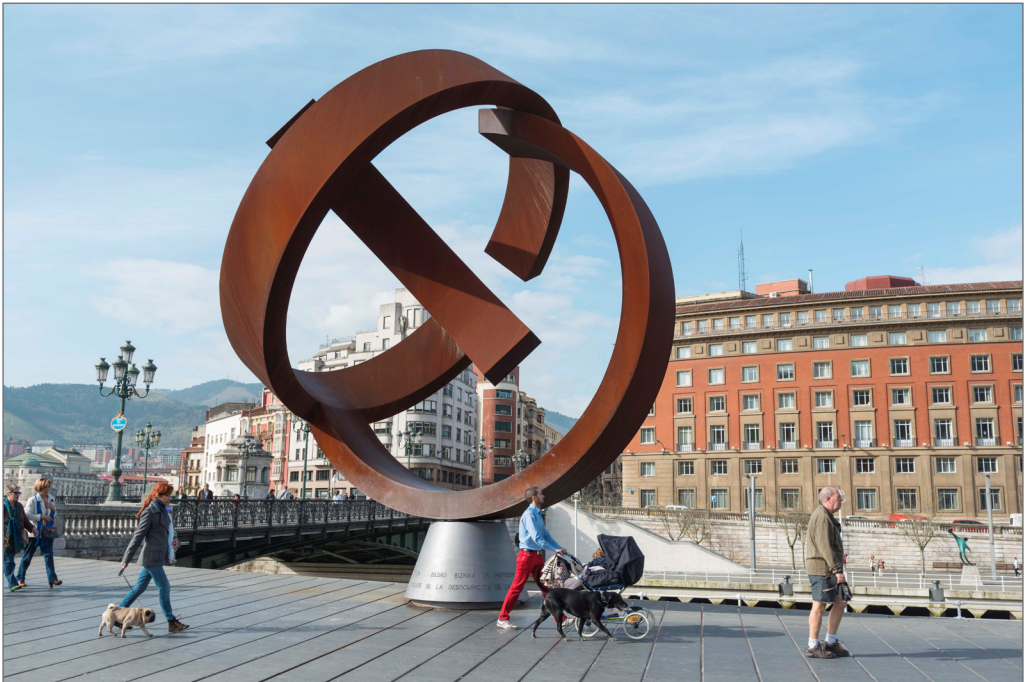
Figura VI. Variante ovoide de la desocupación de la esfera 1958 Reproducción a gran escala para la Plaza Ernesto Erkoreka. 2001 Jorge Oteiza.

El carácter simbólico de la Plaza Ernesto Erkoreka y sus edificaciones, lo ratifica uno de los últimos emplazamientos, (Figura VI.). De Jorge Oteiza, Variante ovoide de la desocupación de la esfera, 1958, constituye una reproducción a gran escala de la obra para la Plaza Ernesto Erkoreka 2001 El proyecto se presenta como colofón a los trabajos de reposición urbanística llevados a cabo tras la construcción de las infraestructuras del Plan Integral de Saneamiento en dicha área. Sostiene Jorge Oteiza que “en un principio se pensó la pieza para la isleta de planta de distribución de tráfico rodado, que se iba a construir en la Plaza Ernesto Erkoreka, frente a la entrada del Puente del Ayuntamiento. Parecía que su posición en el eje del puente sería un hito que significaría el lugar. Se hicieron distintos ensayos gráficos a base de fotomontajes en los que se comprobó la posición de la pieza. Esta posición funcionaba desde la visión lejana, pero