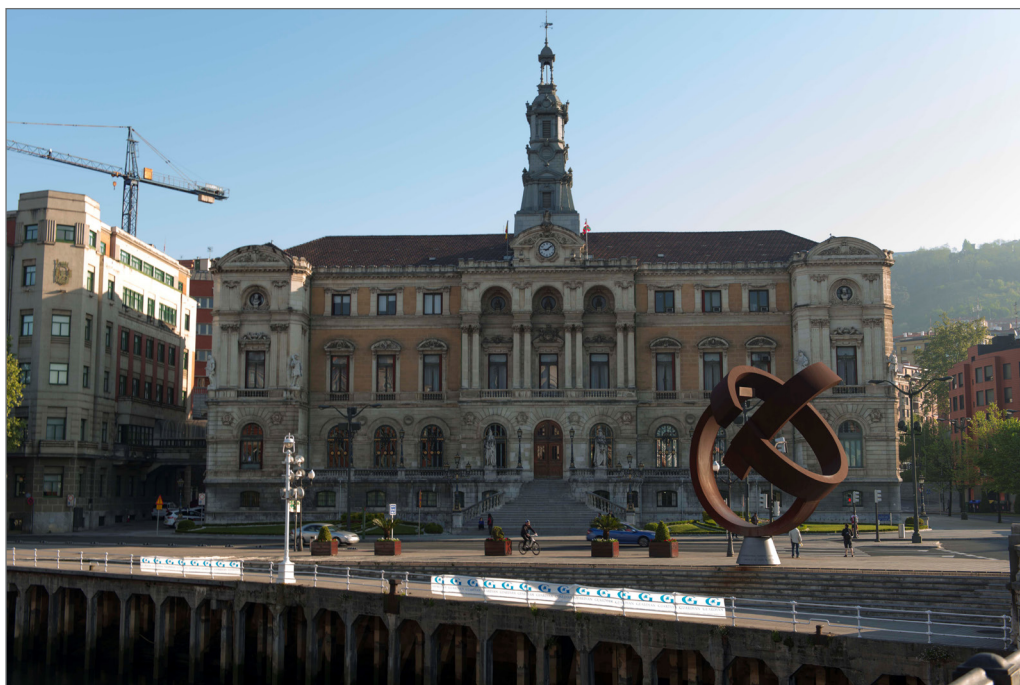
Figura I. Ayuntamiento de Bilbao 1892. Arquitecto Joaquín Rocuba. Edificio Ecléctico modernista. Foto: Juan Carlos Gonzalez Astorga 2014

La fundación de la Villa en 1300 se produce a raíz del fuero otorgado por don Diego López de Haro, que al constituirse como Villa, la vida local quedó regulada por un orden preciso (Cava Mesa 2008, 13-20). En el año 1511 el establecimiento del Consulado de Bilbao acentúa el comercio marítimo y da pie al crecimiento extramuros de la ciudad, formándose Atxuri e Ibeni (Cenicacelaya 2001, 9). En 1581, Bilbao estaba dividido en cuatro estaciones o parroquias, en años posteriores, las siete calles se fueron llenando de caserones burgueses y vías que no estuvieron sometidas a ningún plan urbano. En 1801 el plan de Silvestre Pérez propone su inicio en la avenida San Francisco hacia San Mamés 1 . En 1856 el espacio urbano, tiene un carácter funcional y social. (González Portilla 2009, 78) Entre 1862 y 1870, en la Villa de Bilbao se crean distritos, barrios, colegios electorales y secciones, y se redacta el Plan de Ensanche por el ingeniero Amado Lázaro. En 1876 Alzola, Achúcarro y Hoffmeyer trazan una ciudad reticular que se acentúa cruzando la Plaza Elíptica. Al final del siglo XIX y principios del XX, los arquitectos Achucarro, Zubizarreta, Fort, Escondillas, Aladrén y Rocuba, integraron la arquitectura de otras partes de Europa a Bilbao, como ejemplo la fachada del Ayuntamiento de Bilbao del arquitecto Joaquín Rocuba. (Figura I)