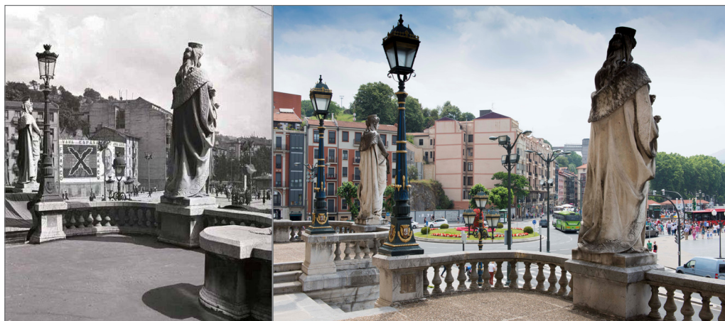
Figura V. Inmediaciones del Ayuntamiento de Bilbao. 1937. A/ Ribera Chacón. Euskal Museoa- Bilbao- Museo Vasco. Fotografía en color. Plaza Ernesto Erkoreka. 2014. Foto Juan Carlos Gonzalez

La Plaza Ernesto Erkoreka por la localización dentro de la Ciudad de Bilbao y el conjunto de edificaciones que la conforman, es un espacio simbólico y político, en la mayoría de las ciudades el centro de la ciudad es la plaza donde se encuentran los poderes religiosos, políticos y económicos. Habría que analizar si se trata de un espacio central de la cultura urbana, entendiendo cultura urbana como el centro generador de relaciones entre los ciudadanos y el poder político, y que en dicha relación, se tendría