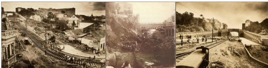
Construção do Viaduto Otávio Rocha em Porto Alegre, imaginado em 1914, iniciado em 1926 e entregue ao público em 1934.

Aonde antes havia uma encosta de morro, abriu-se a passagem para um imponente viaduto. Na parte alta, a Avenida Duque de Caxias cruza o centro da cidade, ligando-o com a Avenida Independência. Cortando essa via, na parte escavada, cria-se espaços para o fluxo da avenida Borges de Medeiros, ligando a cidade à zona sul.