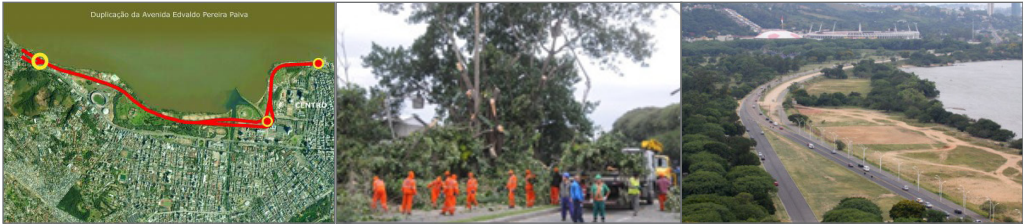
Duplicação da Av. Edvaldo Pereira Paiva: projeto, retirada de árvores, vista da via.

globalização, os danos meio ambiente e os danos ao meio ambiente e aos direitos humanos. Muitos desses assuntos são hoje de grande atualidade.