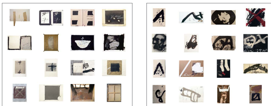
Fig.7: A la izquierda el aspecto: Equilibrio Compositivo y a la derecha el aspecto Trazo Grueso Denso. © Fundació Antoni Tàpies, Barcelona / Vegap.

En la Fig. 2 se muestran dos de las trece agrupaciones resultantes de aplicar la metodología descrita de representación de la imagen mediante Bag-of-Words, sobre el conjunto de obra de Antoni Tàpies (2001 1 ). Observamos en el primer grupo de la izquierda un conjunto de imágenes de obras que transmiten idea de orden, composición y equilibrio. En bastantes de ellas aparecen figuras rectangulares o cuadradas bien definidas. Transmite también la sensación de simetría. Muy diferentes de las que se muestran en el grupo de la derecha que presentan trazos gruesos más enérgicos y gestuales.