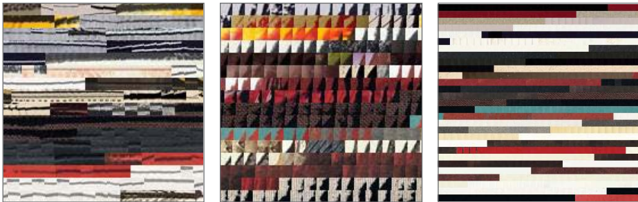
Fig.8: Palabras visuales constituidas por fragmentos de diferentes imágenes de la colección Tàpies.

las imágenes, al ser visualizadas, contribuyen a la comprensión de las características formales del aspecto al que corresponden. Al mirarlas agrupadas se perciben las constantes que han motivado el agrupamiento en la misma “palabra visual”. La posibilidad de visualizar el vocabulario particular que utiliza una artista plástica al ejecutar sus obras y a la vez de medir la frecuencia del uso de unas palabras sobre otras, resulta muy significativo y de utilidad para la comprensión y el estudio de su producción. A su vez, la posibilidad de configurar un vocabulario visual complejo más amplio, compuesto por palabras de diversos artistas, es muy sugerente y sería también de gran utilidad como fondo para la creación digital de nuevas posibilidades estéticas.