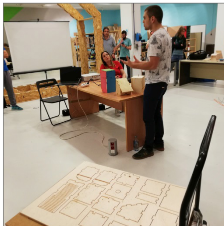
Figuras 4 (izquierda) y 5 (derecha). Estudiantes de diseño junto con el docente en el CIFE, centro de innovación y formación del profesorado (izquierda) y en el Centro de Arte y Tecnología (Etopía-CAT) mostrando el proyecto y el producto final a las maestras y maestros. Inferior, madera contrachapada sobre la que se troquelaron el conjunto de piezas que permitirían el montaje de los distintos prototipos en función del ser vivo, decisión de los estudiantes de primaria.

En este sentido, y como se muestra en la parte inferior de la figura 5, el proceso de ideación, diseño, producción, transporte elemento estándar en el que iban las piezas, y montaje debía ser flexible y ante todo coherente con las propuestas y las competencias y capacidad de los niños, así como de los recursos de los centros escolares.