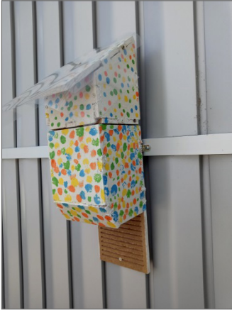
Figura 7: Casetas de pájaros intervenidas y rediseñadas por estudiantes de primaria en los talleres artísticos y de diseño en colaboración con nuestros estudiantes. En la figura de la derecha caseta colocada en la fachada del CEIP Lés Allées-Vadorrey (Colegio de educación infantil y primaria).

mientos con estudiantes de primaria, resulta la más interesante de cara al análisis, dado que en ella se puede comprobar cómo se ha ido implementando cada una de las etapas del proyecto en su propia concepción STEAM. Se puede valorar, qué conocimientos científicos, tecnológicos y de diseño han incorporado nuestros estudiantes, cómo los comparten y transfieren, con la finalidad de desarrollar, de forma conjunta una nueva dimensión artística y de diseño a otro nivel educativo. Una fase en la que, pasan de tener un papel de meros diseñadores, a co-creadores, junto con los estudiantes de primaria, siempre desde el respeto entre iguales en un contexto abierto de enriquecimiento mutuo, y que se ha expresado de forma repetida por ambas partes.