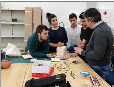
Figuras 2 y 3: Encuentro en la ESDA con expertos-voluntarios, y primer taller de creación electrónica arduino.

Es en esta etapa en la que se aprecia, además de lo señalado anteriormente, como se ponen en juego los principios básicos STEAM, en los que el arte por un lado y las matemáticas por otro lado, van vehiculando la planificación, organización y desarrollo de las fases y la evolución de la propuesta. En las figuras 2, 3, 4 y 5 se muestran distintos momentos que van, desde los primeros encuentros en la ESDA (ver figura 2) hasta los talleres dirigidos por voluntarios expertos en IoT, hardware y software arduino (ver figura 3). El objetivo de estos encuentros y talleres era mejorar la competencia de nuestros estudiantes, pero ante todo que pusieran en juego elementos cognitivos que les facilitara la integración en sus propuestas de los diversos tipos de conocimiento.