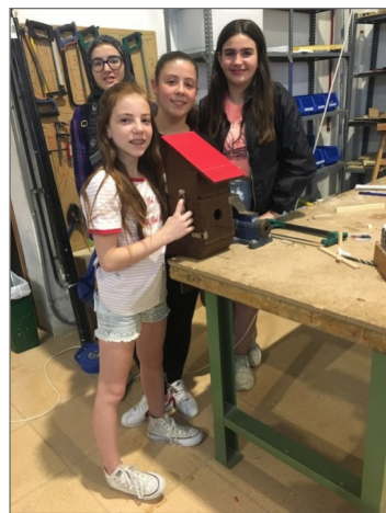
Figuras 6: Imagen izquierda, alumnas de un Centro escolar de Fuentes de Ebro (Zaragoza) que, junto con el docente y tras un trabajo previo sobre el prototipo de diseño trabajaron en una adaptación a su contexto escolar, así como en la intervención plástica.

Hay que destacar que esta última fase, en la que los estudiantes de diseño comparten sus conoci-