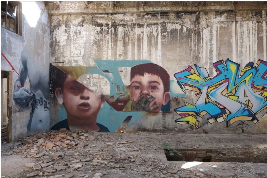
Figura 2. Arte urbano y grafiti en la Fundición La Cruz (Linares).

en los revestimientos que se encuentran en la intemperie. Otra de las alteraciones más usuales se debe a la ejecución de obras sobre morteros de cemento, ya que al colocar capas que no permiten que el muro respire se producen desprendimientos y la aparición de eflorescencias. Como ejemplo de las obras catalogadas se pueden citar las de la fundición La Cruz de Linares (Fig. 1 y 2), a las que haremos referencia más adelante, las cuales presentan un estado variable de conservación pero que, en general, sufren desprendimientos en diversos puntos por el mal estado de los soportes, así como colonización biológica de diversa tipología y entidad y depósitos.