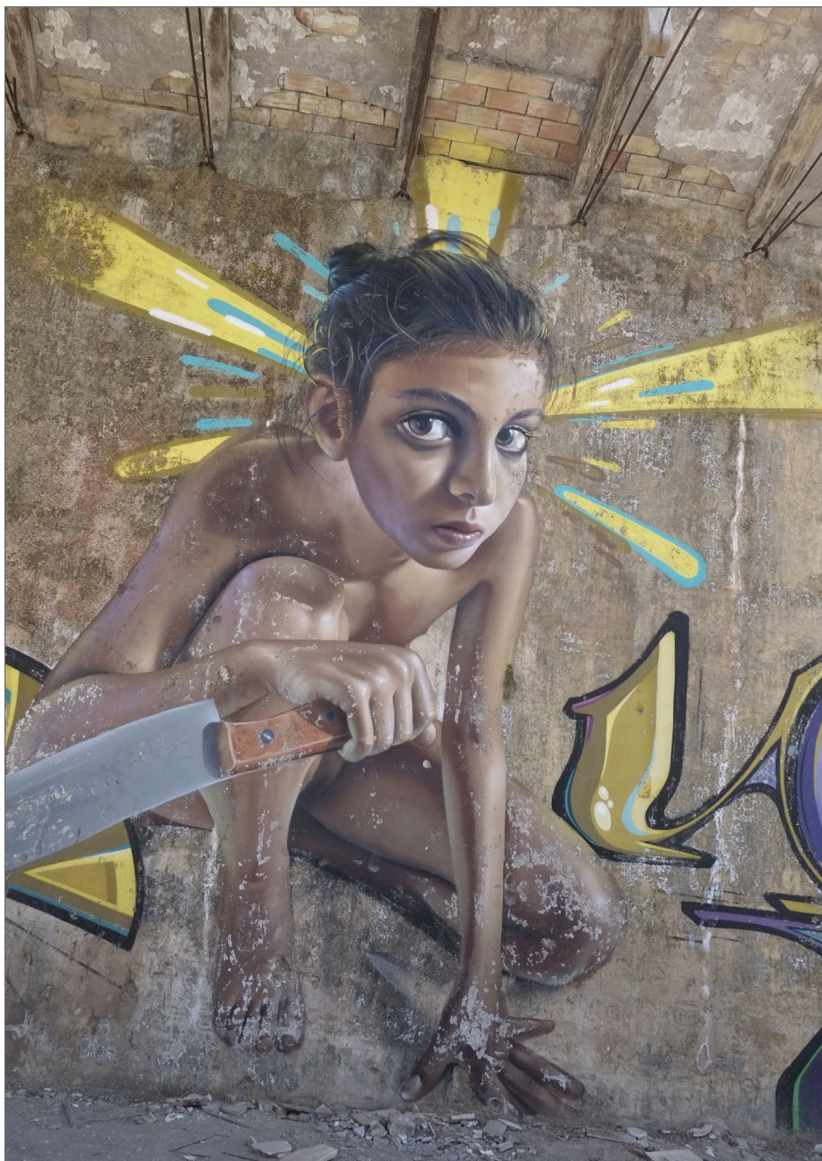
Figura 4. Obra de Belín en el estilo hiperrealista surrealista de sus inicios. Fundación La Cruz (Linares).