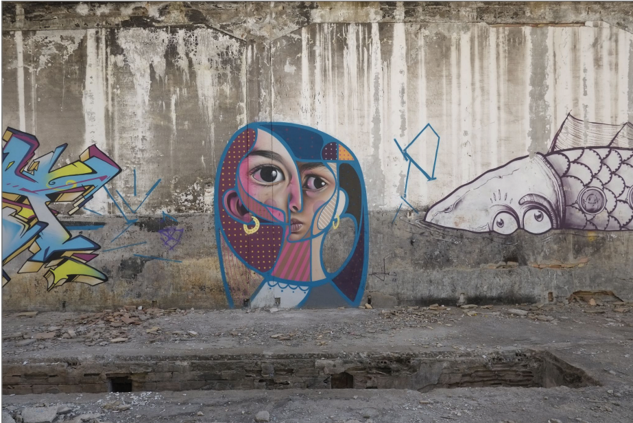
Figura 5. Obra de estilo hiperrealista neocubista del artista Belín. Fundación La Cruz (Linares).

Aquí se ubicaría la estratigrafía del hall of fame en el que se han ido solapando obras que perdurarán únicamente a través de la documentación de las mismas. Este tipo de iniciativas artísticas como medio de revalorización de áreas en mal estado o poco transitadas, tienen aspectos muy positivos para la comunidad, especialmente puede ser interesante la atracción de turismo para un área deprimida económicamente y sufre una enorme despoblación, pero, por otro lado, se debe actuar con precaución para evitar sobreexplotarlas y producir efectos contrarios y rechazo por parte de la población, que debe integrarse en el proceso e identificarse con el espacio (Sarmiento 2020).