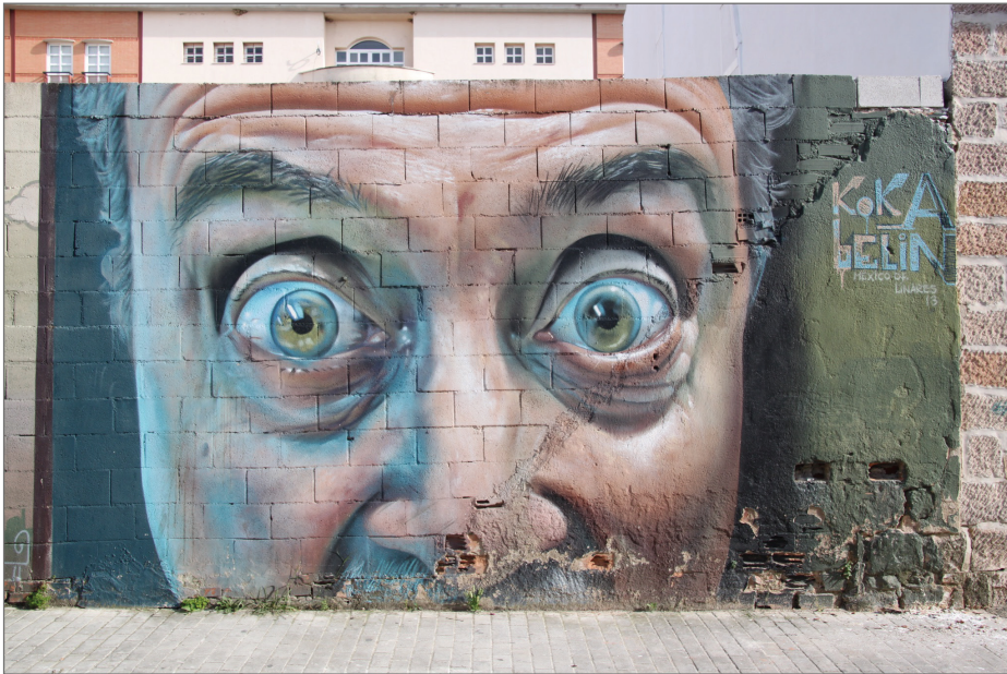
Figura 11. Obra de arte urbano de Belin y Koka en Calle Zambrana, Linares.