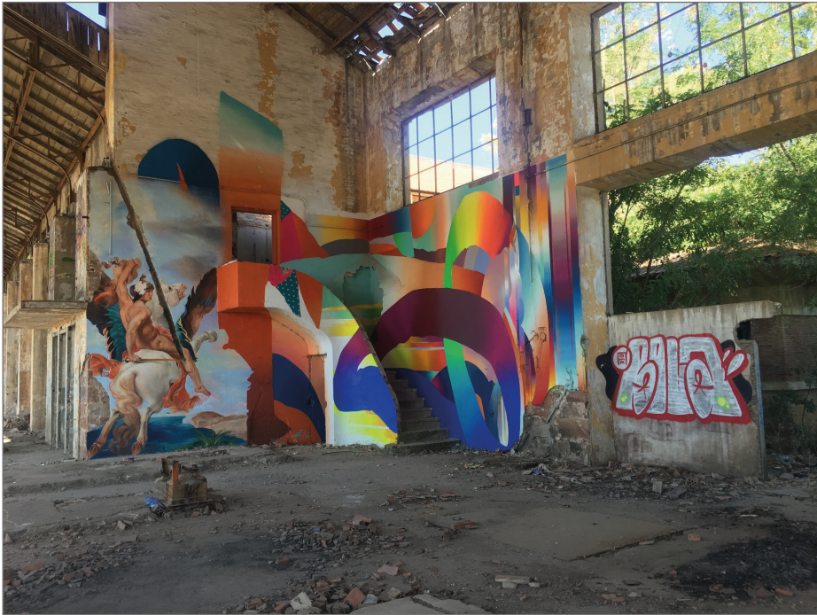
Figura 1. De dcha. a izq. pompa en plata y rojo; obra de arte urbano abstracta; obra de arte urbano que recrea la obra Perseo caballo Pegasus (1869) de Paul Joseph Blanc, que actualmente se encuentra en el Museo de Orsay de París. Fundación La Cruz (Linares).

La aplicación práctica del análisis de las obras se ha realizado en creaciones de diversa tipología y con casuísticas muy diversas en cuanto a su concepción, materiales, etc. En el caso del grafiti, ya fueran potas, piezas o tags , no se realizaron fichas de catalogación como tal, ya que el interés radicaba en establecer pautas por barrios, vislumbrando qué firmas se repetían más, cuál era su grado de elaboración, qué crews existen, formatos, etc. En este caso no se estudió su conservación ya que son obras absolutamente efímeras, sólo se habría realizado si hubiese algún caso de especial significación.