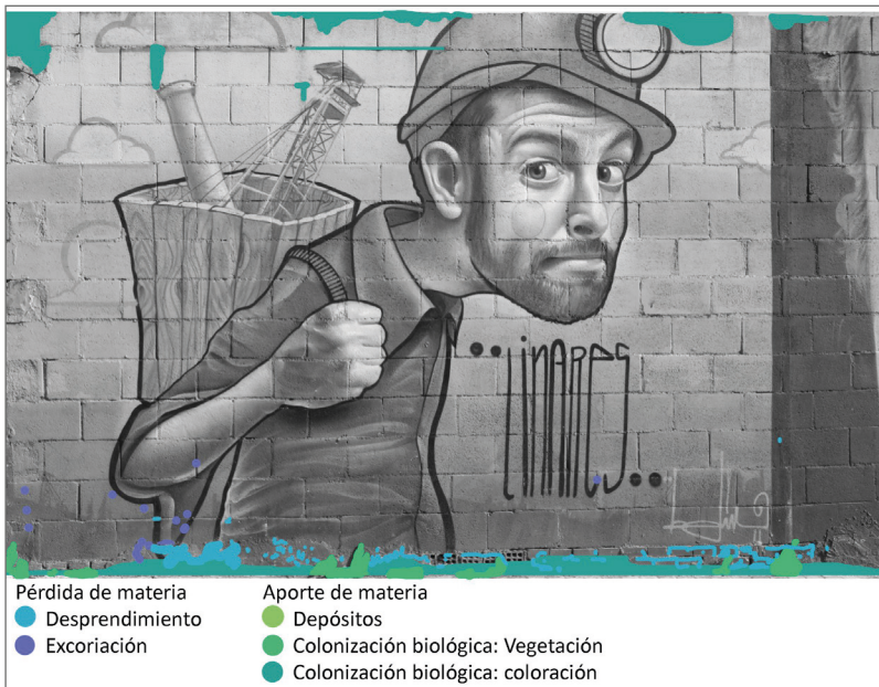
Figura 10. Mapa de alteraciones de la obra de Belin de la Calle Zambrana (Linares).