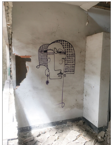
Figura 6. Retrato cubista de un solo trazo y color del artista Belín. Fundación La Cruz (Linares).

Aquí se ubicaría la estratigrafía del hall of fame en el que se han ido solapando obras que perdurarán únicamente a través de la documentación de las mismas. Este tipo de iniciativas artísticas como medio de revalorización de áreas en mal estado o poco transitadas, tienen aspectos muy positivos para la comunidad, especialmente puede ser interesante la atracción de turismo para un área deprimida económicamente y sufre una enorme despoblación, pero, por otro lado, se debe actuar con precaución para evitar sobreexplotarlas y producir efectos contrarios y rechazo por parte de la población, que debe integrarse en el proceso e identificarse con el espacio (Sarmiento 2020).