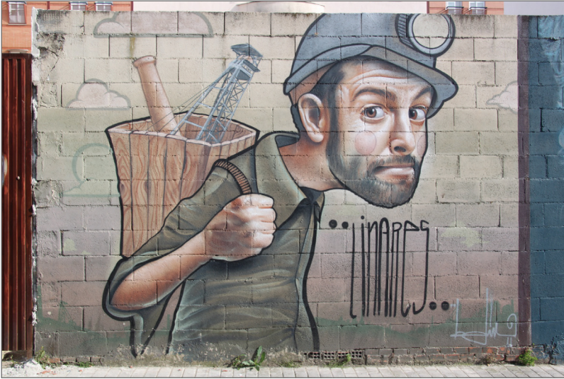
Figura 9. Obra de Belin en la que se autorretrata como un minero. Calle Zambrana, Linares

superior y vegetación en la zona inferior, algunos desprendimientos en la zona inferior y grietas, datos que se recogen en el mapa de alteraciones (Fig. 10).