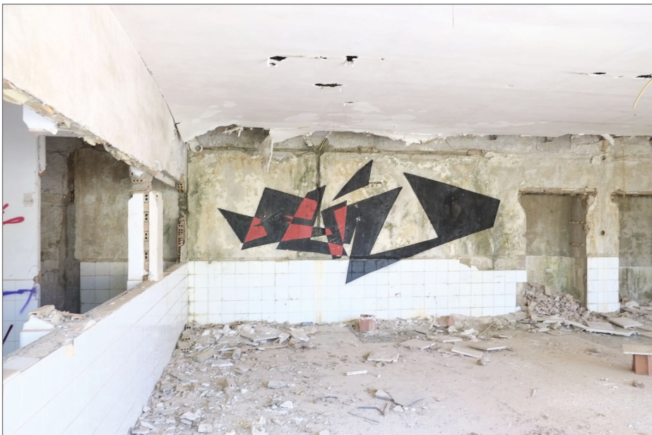
Figura 3. Graffiti de Belin.

a la Antigüedad. Esta fundición junto con la Compañía de Minas de la Cruz fueron las últimas en desaparecer, dejando un paisaje árido caracterizado por la altura de las chimeneas (Pérez 2018). Desde su cierre, como es habitual desde los inicios del graffiti y del arte urbano, ha servido de lienzo en blanco para escritores y artistas urbanos. Se suceden distintos tipos de firmas, potas y piezas y sobre todo, por influjo de Belin –de quien se tratará más adelante–, obras de arte urbano cada vez más elaboradas y superpuestas a otras, en las que se observa la evolución del graffiti y el arte urbano en Linares y, en concreto, de este artista, al ser uno de los que más piezas tiene, pues sigue intervinando este símbolo de Linares a pesar de dedicarse al muralismo público. Belin cuenta en este muro con firmas en forma de pieza (Fig. 3), obras de tipo hiperrealista-surrealista del inicio de su carrera (Fig. 4), con estilo hiperrealista neocubista característico del periodo actual (Fig. 5) y pequeños dibujos cubistas de un solo color y trazo (Fig. 6). Se observa la progresión desde su firma sencilla de borde negro y relleno blanco al estilo del metro de NY de los años '70, hasta su refinamiento artístico actual. Junto con la obra de Belin aparecen otros artistas reconocidos como Rallito X o Flaxt, entre otros muchos.