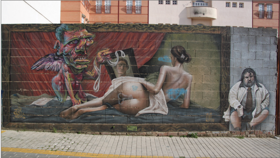
Figura 7. Obra de arte urbano de Belin y Myrhwán en la Calle Zambrana, Linares.