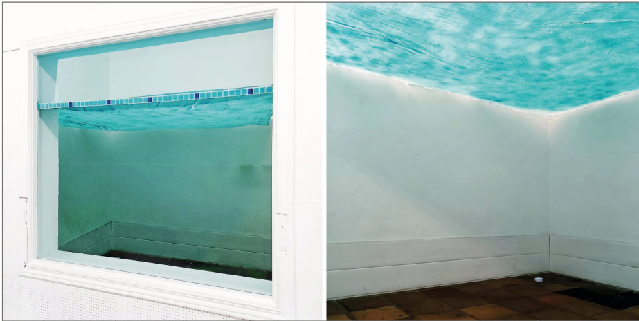
Figura 5. Vista de Líneas de flotación VI , Nacho Martín Encinas, 2021.