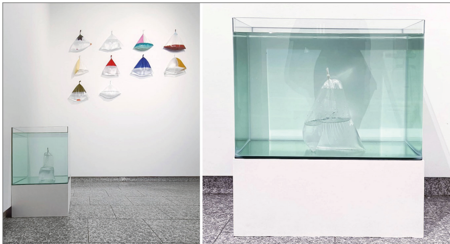
Figura 2. Vista de Líneas de flotación I y II , Nacho Martín Encinas, 2021.

conteniendo peces a menudo vendidas en ferias y otro tipo de eventos estacionales al aire libre, como ocurre con frecuencia en estas latitudes (no quisiéramos, en ningún caso, universalizar). Además, las piezas están pintadas en su exterior en diferentes grados, opacando de alguna manera el agua que dentro contienen, y colgadas, e incluso apiladas de tal manera que señalan a una tensa –y seguramente, por esto, bella– fragilidad.