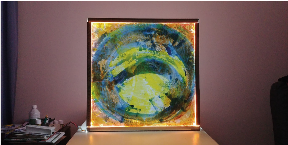
3. irudia. Titulurik gabe. Autoreek eginda.

Hainbat koloretako laka zeharrargiak erabili ditugu plexiglas-xaflen gainazalean irudi abstraktu bat irudikatzen. Margo-aplikazio honek plexiglas-piezek duten izaera zeharrargia mantendu nahi izan du. 3 mm-ko lodiera duen xaflaren bi gainazaletan laka aplikatu ondoren, beste bi xafla lodiagoen artean sartu dugu. Jarraian, led zerrendak aluminiozko marko batean jarri ditugu hiru plexiglas-xafleri eusteko. Azkenik, led zerrendak potentzia-kontrolatzailerara konektatu ditugu eta gailua beste korrante elektriko hartune batera. Hauxe izan da emaitza: