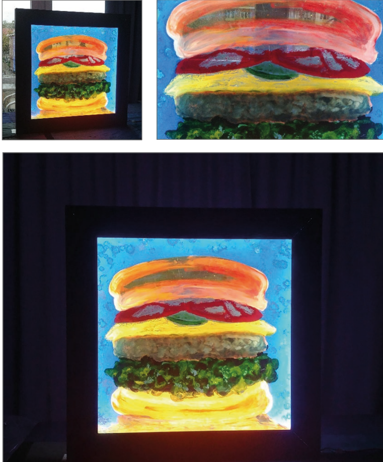
4. irudia. Hanburgesa (Afterbehatzailearen sabela). Autoreek eginda.

banatu dezan, markoa hobetzeko beharra ikusi dugu. Bigarren proba bat egin eta, markoa hobetuz, honako irudi hau lortu dugu: