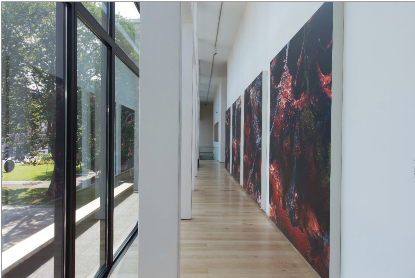
1. irudia. Afterimages.

Behatzailearen sabela (Arreta-atalasea) (Afterimages) Dario Urzay artistak egindako artelana da. Bere ibilbide sortzailean zehar, artea, artearen historia eta prozedura artistikoak ez ezik, beste hainbat ezaguera eremu ikertu izan ditu, eta bere lanetan islatu ere. Aztergai dugun obraren kasuan bezala, Urzayren piezen ezaugarrien artean izaera hibridoa eta abstraktua nagusi da, bai materialari dagokionez, bai izaera sinbolikoari dagokionez ere.