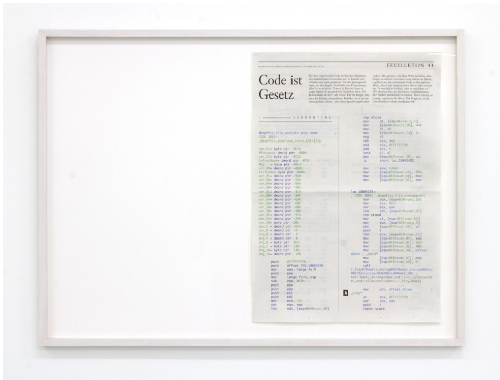
Figure 1. Bartholl. Aram. 2011. How to to turn code into Art. 87 × 65 cm. https://aram-bartholl.com/how-to-turn-code-into-art/

L'expression 'écriture numérique' s'apparente à un pléonasme technique. Via un monde dit numérique, l'expression présente une variation langagière informatique, mais rappelle le calcul informatique dérivé de l'écriture de la langue et des nombres. L'histoire des médias mérite d'être abordé par l'histoire de l'écriture "comme des 'machines textuelles auxquelles on accède et que l'on manipule à travers et par l'écriture'" (Petit & Bouchardon 2017, 135). l'écriture est à la fois objet et outil des médias informatisés. Effectuer l'analyser de ces médias relève d'une étude hybridée de pratiques d'écritures et de lectures. Chaque média naît et se meurt dans la transformation d'un autre média.