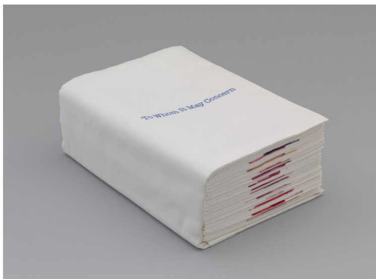
“ To whom it may concern ” Louise Bourgeois, libro textil (2009-2010)