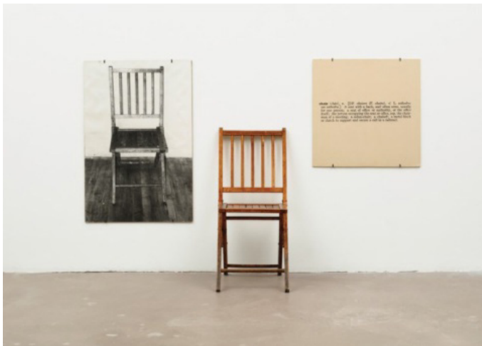
“Una y tres sillas”, Joseph Kosuth (1965)

Si avanzamos en el tiempo hasta el arte conceptual, vemos que esa relación de mutualidad sigue estando presente. Un claro ejemplo de ello sería Joseph Kosuth. Una de sus piezas más conocidas “ Una y tres sillas ” (1965) nos muestra cómo el papel que desempeña la escritura dentro de la obra aporta sentido a todo el conjunto.