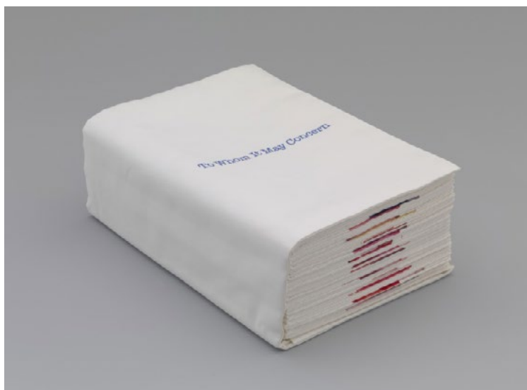
“ To whom it may concern ” Louise Bourgeois, libro textil (2009-2010)