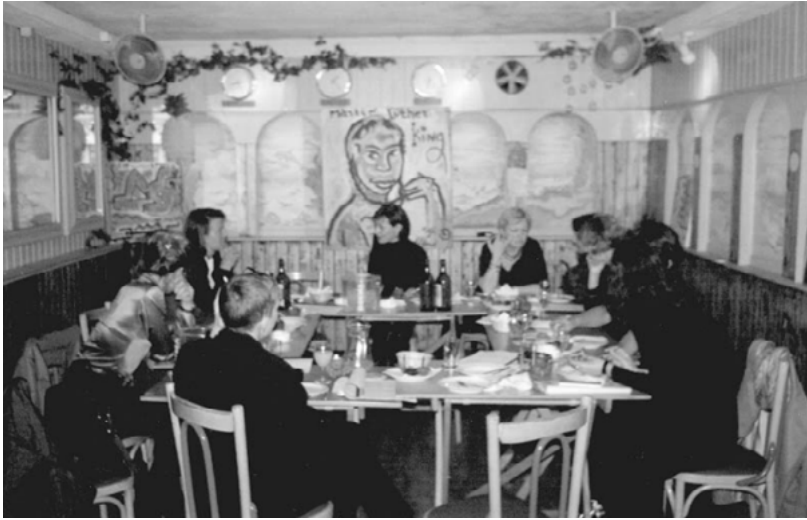
Figura 3. Face Settings , septiembre de 1996, cena en Rotterdam, the Netherlands .