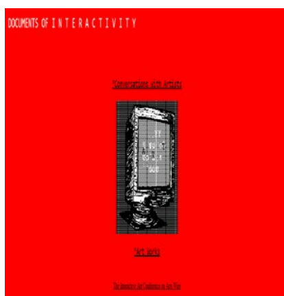
Figura 2. Portada de “Conversations with Artists*Art Works” The Interactive Art Conference on Arts Wire. http://www.artswire.org