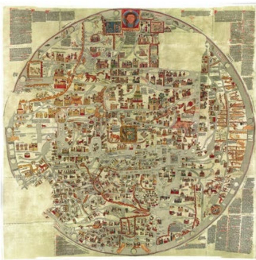
Reproducción del mapa de Ebstorf.

Este capítulo recoge varios ejemplos antiguos pero, en palabras de la historiadora María José Noain Maura, es desde finales del s. XIV que ciertos mapas comienzan a adquirir una dimensión artística: los portulanos se pueblan de monstruos marítimos, que recogen los temores del imaginario colectivo; los puertos y ciudades más importantes se representan a vista de pájaro; los accidentes geográficos adquieren aspecto antropomorfo y zoomorfo.