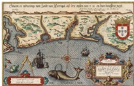
Costas de Portugal en el “Spiegel der Zeevaerdt” de Lucas Janszoon Waghenauer.

En el s. XVI el cartógrafo holandés Lucas Janszoon Waghenauer (1534-1606) fue el más popular editor de cartas náuticas de finales del s. XVI y XVII. El “Spiegel der Zeevaerdt” fue un libro ilustrado que combinaba una recopilación cartográfica de las costas atlánticas. Sus mapas están poblados de navíos, criaturas marinas y bellísimas rosas de los vientos.