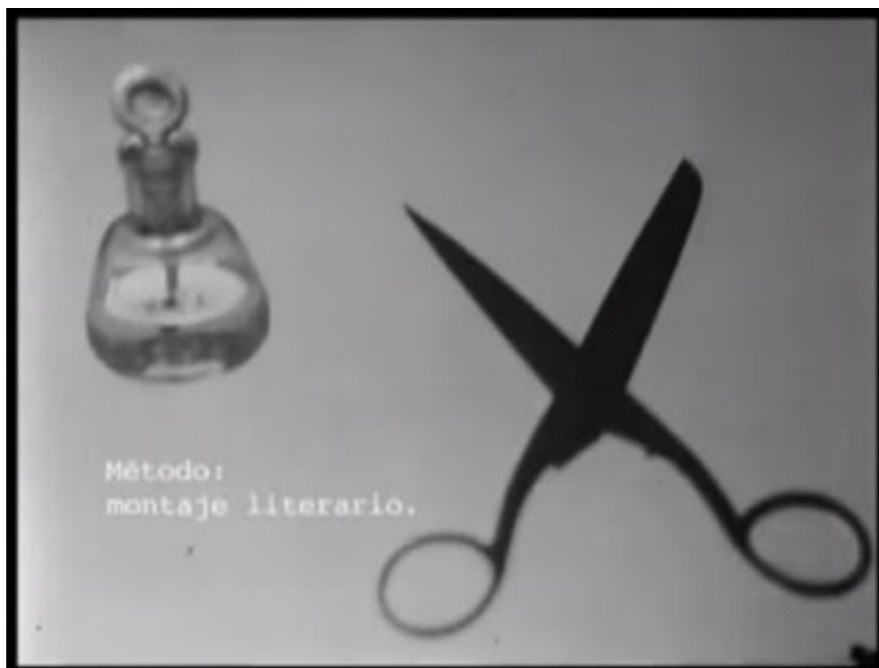
Fotograma 6' 17" Walter Benjamin. Constelaciones. Círculo de Bellas Artes.

En el Atlas Emocional del Bidasoa la narrativa literaria que se utiliza para materializarlo, permanece y el sentido se mantiene a lo largo del tiempo. Según Georges Didi-Huberman, el Atlas de Mnemosyne presenta un montaje compositivo a través de la imagen que conforme pasan los años se encuentran nuevas maneras de entender nuestra propia contemporaneidad. El fascinante atlas de Aby Warburg es la exposición de la memoria en acción, es decir, la memoria viva y en movimiento.