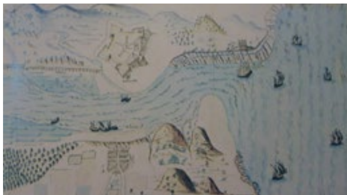
Río Bidasoa, Biblioteca Nacional de París, 16??

A raíz del episodio histórico vinculado a Hondarribia, que tuvo lugar en el año 1638, dentro del contexto de la Guerra de los Treinta Años, se generó una profusión de mapas de la zona. Las tropas francesas rodearon el recinto amurallado durante meses para intentar hacerse con el control de la villa. El 7 de septiembre de ese mismo año, se consiguió repeler el ataque francés, evitando que la ciudad cayera en manos francesas. Dichos mapas, en color, en blanco y negro o en acuarela, se encuentran hoy en la Biblioteca Nacional de París.