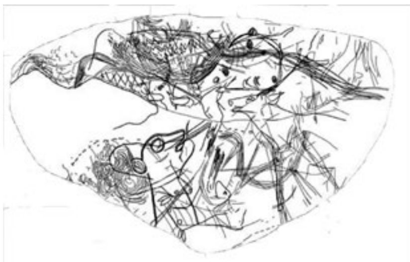
Mapa de Abauntz.

A modo de resumen para introducir el proyecto, haremos un breve repaso sobre algunos ejemplos citados en la investigación que contribuyan a entender el objeto de estudio sobre el que se ha trabajado.