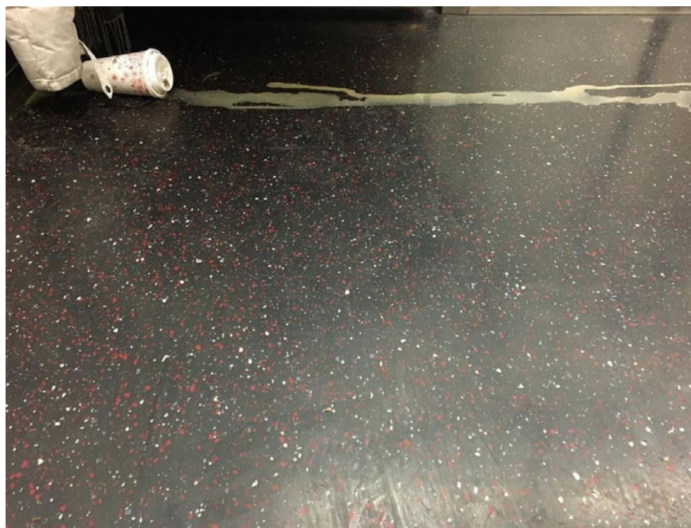
Ilustración 1: Freedrawing (1) .

La observación por parte de la autora de este artículo del recorrido de un café derramado en un vagón de tren, en un período en que me encontraba investigando la relación entre dibujo y tiempo, produce una ‘sintaxis inesperada’: la asociación impredecible entre el trazo, el movimiento y la ciudad. Como una sombra, la disposición a pensar el dibujo se imbrica en la contemplación de la trayectoria del café. Lo fotografío y horas después lo comparto a través de las redes sociales con la etiqueta freedrawing –dibujo libre– en lo que constituye el primer apunte de un creciente acervo de trazos y huellas –ochenta a día de hoy.