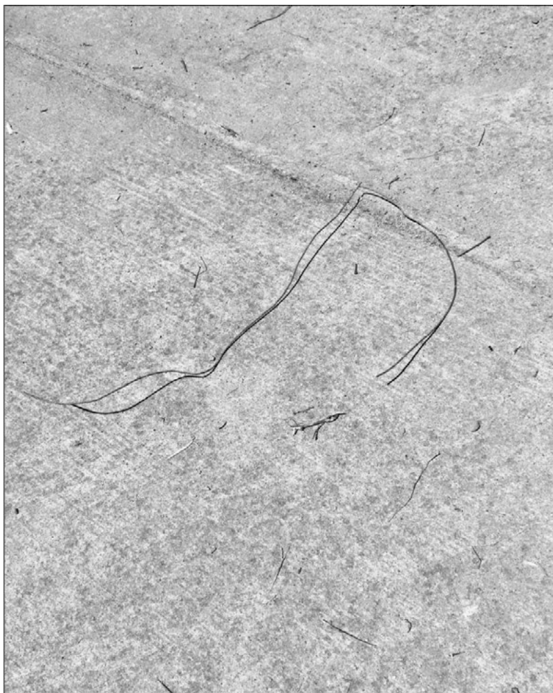
Ilustración 3: Freedrawing (12) . Imagen de la autora.

En el contexto postfotográfico la actividad de dibujo libre tiene el peligro de ser equivalente a lo que Flusser (1984) llama el apparatus , y que se refiere a como los aparatos o cámaras digitales –podríamos incluir aquí los teléfonos móviles– están diseñados, programados, de tal forma que anticipan desde su fabricación las imágenes que vamos a producir. Lejos de fomentar el ejercicio de la libertad el apparatus alentaría la redundancia de las imágenes como síntoma del universo visual. En cambio apropiarse de trazos y huellas dibujadas por ‘otros’ o ceder el impulso que anima el trazo a máquinas, artefactos, personas, y no humanos, tiene el potencial de rescatar el dibujo de la anhedonia , además de expandir el concepto de autoría y la participación en el arte.