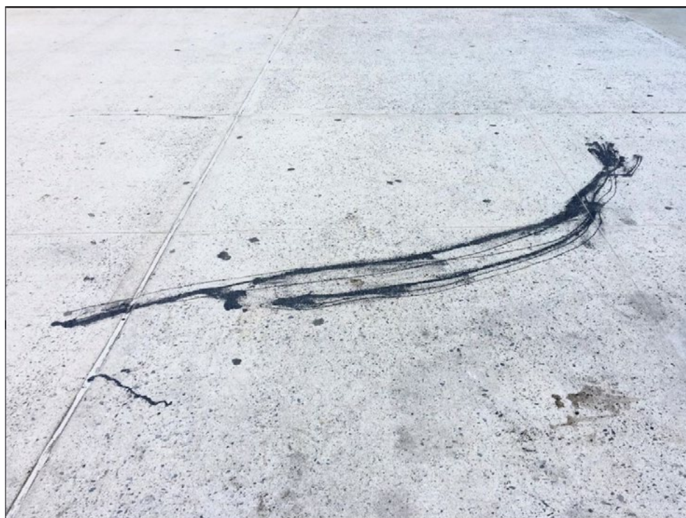
Ilustración 2: Freedrawing (15) .

Al inicio de este artículo señalaba que el problema que detona esta investigación es el atasco del pensamiento con el dibujo. Este atasco se refiere al vértigo del aburrimiento – anhedonia o solemne aburrimiento– del trazo ante el hábito de dibujar y la necesidad de invitar lo nuevo, lo desconocido o inesperado. Para evitarlo y reencontrar el gesto salgo a caminar. La disponibilidad a la hora de caminar, o lo que el filósofo de la educación Jan Masschelein (2010) llama la falta de ‘intención’ para favorecer la ‘atención’, hace que de manera recurrente en mis desplazamientos por la ciudad me fije en los rastros que el movimiento de cuerpos ha generado sobre la superficie, en las líneas que forman los parches que cubren la dilatación del pavimento, o en objetos extraños cuya apariencia remite a la línea, entre otros.