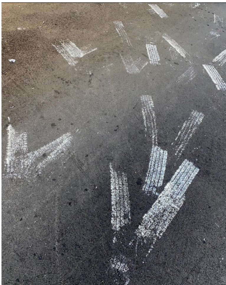
Ilustración 4: Freedrawing (16) .

Artistas como Yoko Ono y sus Instructions for paintings (1962) donde cede el impulso de la producción de imágenes al público a través de instrucciones, recuperan lo lúdico del horizonte del arte y cuestionan discursos como la originalidad y autoría en el arte: en él aspectos como el azar, por ejemplo la instrucción Painting for the wind (1961) que cede al viento el impulso creador, o A painting to be stepped on (1960) que invita a dejar la tela en el suelo o la calle, sugieren también el potencial de una ecología del trazo y de un desbordamiento de la autoría. Ante la densificación del universo visual se impone una ecología, pero quizás como apunta Soto Calderón (2022), este gesto no consista tanto “en reducir el número de imágenes, sino en oponerles otro modo de reducción, de introducir imágenes que fueren otros modos de ver”.