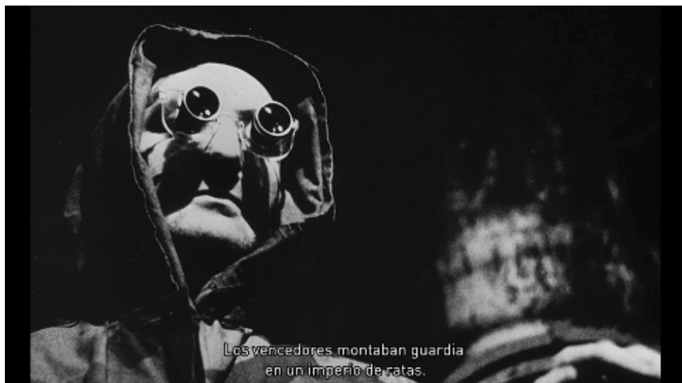
Figura 7. La Jetée de Chris Marker (1962).

imaginario marcado por el sonido y la voz, característica de los experimentos del cine moderno en el que la temporalidad se muestra por sí misma. Una pieza maestra que refuerza su lejanía ante un tiempo monocrónico donde solo encontramos un presente del futuro, un presente del presente, un presente del pasado y todos simultáneos. Obra llena de elipsis, de movimientos zoom, montaje alternado por corte directo y fundidos encadenados como recursos cinematográficos. Es en el minuto 18 cuando el autor muestra por unos segundos la imagen en movimiento de la mujer dormida. Abre sus ojos y nos mira. Dibuja una leve sonrisa en la que parece que Marker intenta llamar nuestra atención más allá de la pantalla.