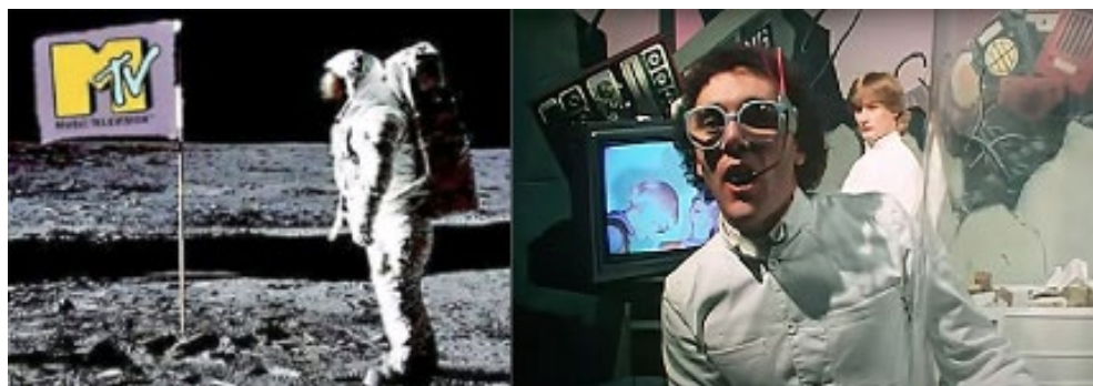
Figura 1. MTV inició la transmisión 1 de agosto de 1981 con un vídeo de la banda The Buggles, Video killed the radio star. Damas y caballeros, rock n' roll. Bienvenidos a MTV, Music Television, el primer canal de música y videos 24 horas del mundo.”

La relevancia de la experimentación en el campo de la creación audiovisual de la mano de las vanguardias artísticas de principios de siglo, marcó las tendencias multidisciplinares y videográficas que aparecerían en la próspera década de los sesenta y setenta para influir profundamente al videoclip musical, con su gran vínculo al cine musical, que encontró su propio espacio de difusión gracias a la aparición del famoso canal televisivo MTV (Music Television) el 1 de agosto de 1981 emitiendo por primera vez el vídeo de la banda The Buggles, titulado Video Killed The Radio Star.