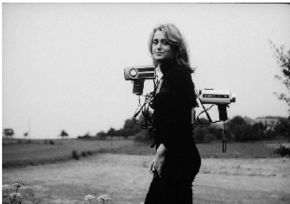
Figura 9. Adjunct dislocations de Valie Export (1973). La autora se mueve a lo largo de una pista con dos cámaras de circuito cerrado que miran en diferentes direcciones. Su acción crea formas lineales cambiantes dentro del espacio. La actuación se llevó a cabo en el Theater im Packhaus, Bremen (1978).

Nuestra identidad individual se está convirtiendo en múltiple mediante la creación de avatares y personalidades alternativas; nuestro cuerpo es transformable tanto en términos físicos como virtuales; nuestra realidad variable está conectada, sin fisuras, con un entorno evolutivo de mundos múltiples; nuestro sustrato en la construcción de nuestra realidad, en un nivel nano, está interconectado con las condiciones materiales e inmateriales del ser. (...) Buscamos nuevas relaciones, nuevas realidades: en efecto, nuevos órdenes de tiempo y espacio. Nuestra cultura abierta evoluciona y se transforma a gran velocidad, mientras nuestro arte desarrolla estrategias de ambigüedad, contingencia y juego; como resultado, la oposición entre realidades reales o virtuales ha dejado de ser binaria (2023, 26-27).