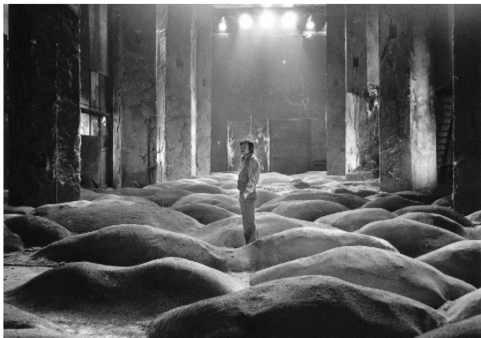
Figura 8. Tarkovsky consolidó su lenguaje cinematográfico con Stalker (1979). Sus teorías del tiempo corresponden a la acción del director por esculpirlo con dilatados planos secuencia que marcan concretos espacios de temporalidad, donde el montaje deja de existir. El tiempo ocurre pausadamente y así observamos la textura de cada objeto, escuchamos el sonido más minúsculo y los detalles que conforman las escenas. El tiempo se extiende hasta introducirnos en su propia existencia.

Es bien conocido el rechazo que Tarkovski sentía hacia toda clase de encasillamientos y etiquetas. Por tanto, estaba lejos de considerar Stalker o Solaris como películas de ciencia ficción. (...) La razón de todo esto se debe sin duda a un menosprecio hacia los 'géneros' cinematográficos (considerados en su vertiente más popular), así como el deseo de alejar el hecho fílmico de cualquier otra manifestación artística de la que aquél pueda partir. En este rechazo del género cinematográfico se manifiesta la voluntad de Tarkovski por dejar bien patente su autoría, además de su intención de separar lo estrictamente cinematográfico de otras artes como la literatura o la pintura (Gorostidi [1985] 2002, 21).