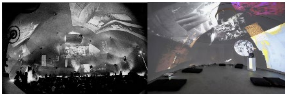
Figura 3. Movie-Drome, 1963-1965, instalación inmersiva de VanDerBeek en New York. A la derecha otra versión para un formato expositivo actualizado.

del cine ( post-cinema ) que buscó ante todo neutralizar la linealidad de la narrativa fílmica. Propuso la multiplicación de las pantallas de proyección, el uso de la luz como agente estético, la abolición de las fronteras entre las formas artísticas, la estimulación de la corporalidad de los espectadores y el libre juego con las técnicas cinematográficas. El videoartista VanDerBeek inventa una 'máquina de experiencias' en base a su idea de movie-drome , un teatro esférico donde la gente se acostaba y disfrutaba de películas proyectadas en su interior. El autor afirmaba que las imágenes flotantes sustituirían a la proyección de películas unidimensionales. A partir de 1957 comienza a producir secuencias de la película para el movie-drome que construye finalmente en 1963.