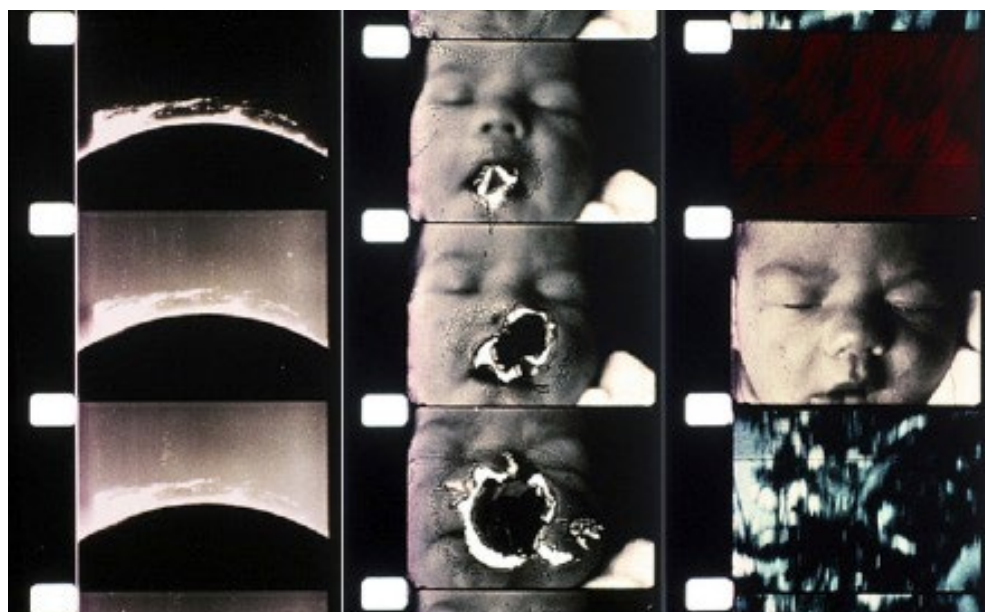
Figura 6. Art of Vision de Stan Brakhage, 1965.

construyen por la apropiación de imágenes y los códigos disponen cómo las personas se perciben y se relacionan unas con otras. El acto de hablar sobre la creación audiovisual desde el ámbito artístico, que tanto se vincula con la percepción del espectador, significa borrar los límites de la obra para reconocer ese 'sentimiento' de la condición estética que comunica más allá de la narrativa cinematográfica que estudiamos en los libros. La historia, y las historias en el cine, se presentan asentándose en una linealidad cronológica que el cine experimental y el videoarte han reformulado en su relación con la experiencia temporal. Según la teórica en historia del arte Michael Ann Holly, es culpa del pasado por el que los humanos recurren a la historia y se matan por ella erigiendo monumentos e interpretando sus sucesos. La historia, prosigue la autora, ofrece la convicción de que, como Nietzsche proclama, somos voyeurs viciados de ese pasado. Así, gracias a la historia sentimos nuestra condición humana como significante (Holly [2007] 2018, 14).