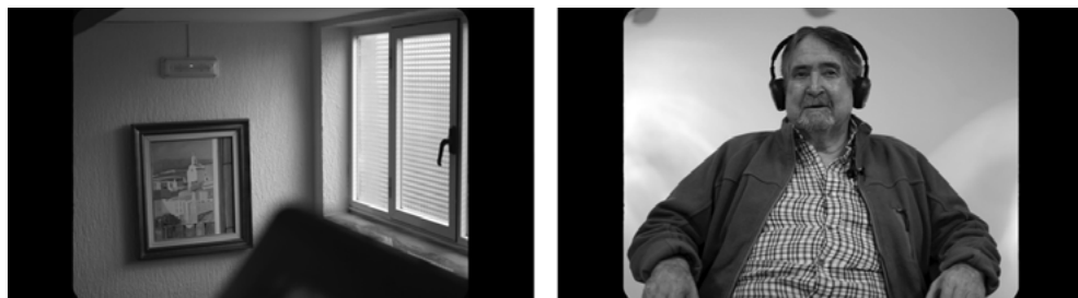
Fig. 3. Fotogramas de la película del proyecto « Remake », 2022.

Dentro del proyecto « Remake », el término 'colectivo' podría no ser el más preciso, ya que se refiere a un conjunto que comparte diversas características comunes (alojamiento, edad, etc.), pero donde las 20 personas participantes nunca se autodefinirían ni como un colectivo ni como una comunidad.