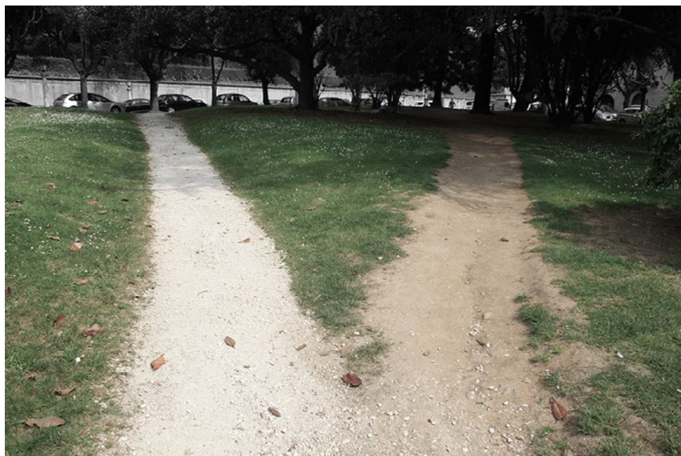
Ismael Teira, «Atallo S21», 2011.

De este modo, la panorámica establecida desde la investigación y la docencia en dos ciudades diferentes contribuye a un aprendizaje contextualizado y significativo que mejora habilidades transversales –como el pensamiento crítico, la resolución de problemas o el trabajo en equipo– así como la adquisición de competencias investigadoras, fundamentada en una técnica metodológica de observación directa, pasiva, mediante el trabajo de campo, que ayuda a sistematizar la recogida de datos, su interpretación y la formulación de hipótesis. Cuestiones como el impacto en la comunidad, la conciencia ambiental y con el territorio, así como la propia reconexión con el espacio físico son otras de las conclusiones positivas resultado de las acciones pedestres llevadas a cabo, entroncadas con los Objetivos de Desarrollo Sostenible (ODS), especialmente los n os 3, 4 y 11. Una experiencia similar, basada en el propio caminar, reveló resultados de interés para nuestra metodología, sobre todo por lo particular de «una forma de pensamiento e investigación, que ayudan al alumno a conocer y reconocer un espacio físico y socio-cultural» (Roca, Aquilué & Gomes 2016, 386).