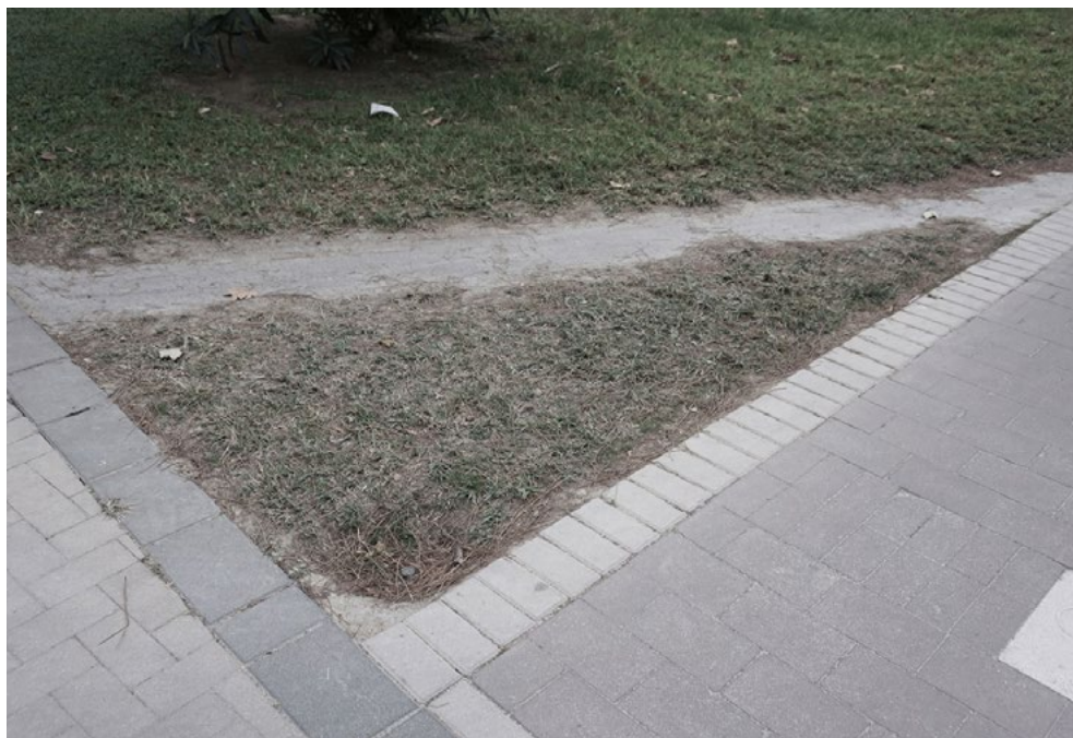
Ejemplo de 'camino del deseo' que funciona como atajo en el Jardín del Túrria. Foto tomada durante el desarrollo de la caminata colectiva.