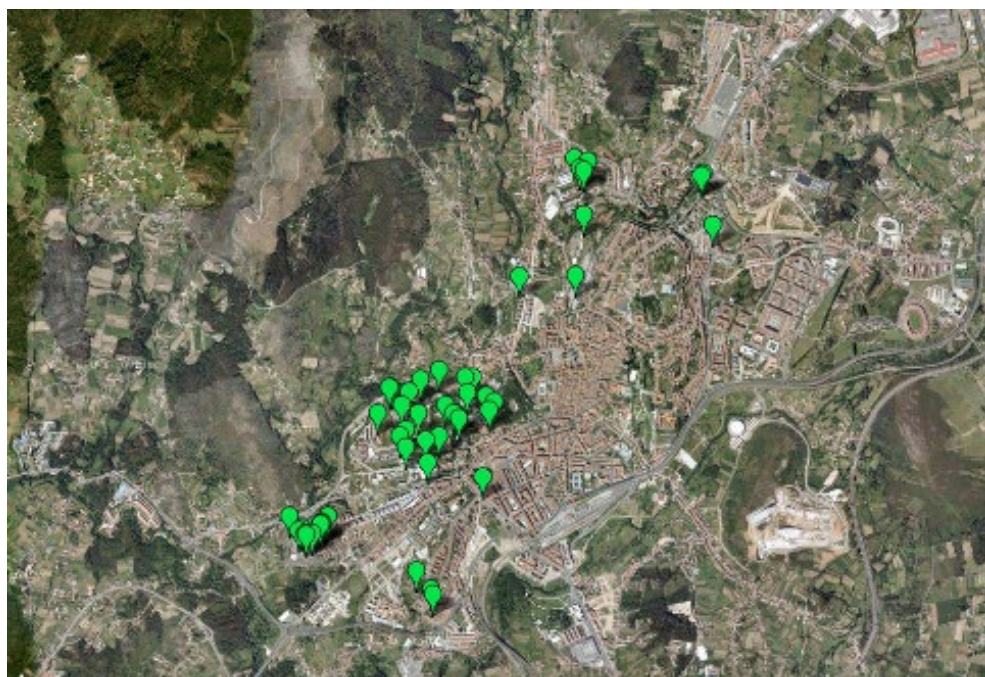
Localizaciones de ‘caminos del deseo’ en el Google maps del proyecto, en especial la zona con mayor concentración correspondiente al Campus Universitario Sur.

fotografías de los ‘caminos del deseo’ junto con las coordenadas de su localización en Google maps 3 . Este trabajo explora la intersección entre lo urbano y lo poético, invitando a reflexionar sobre los usos no convencionales del espacio. La mayoría de los senderos del deseo identificados poseen una funcionalidad clara como atajos. Tras completar y analizar el archivo del proyecto, se identificaron dos áreas con una alta concentración de ‘caminos del deseo’: los campus universitarios y los entornos hospitalarios, lugares condicionados por la presteza y la eficiencia.