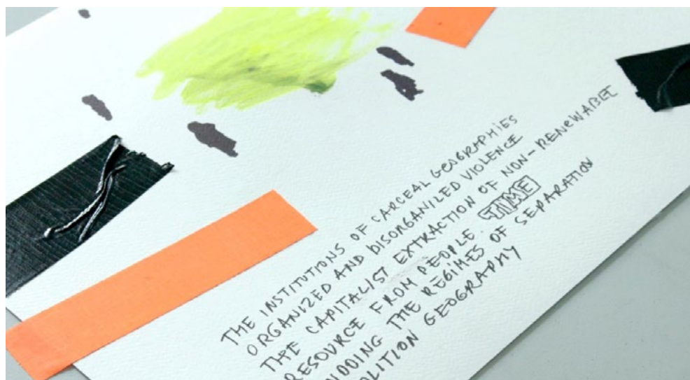
Fig. 3. Fotograma del video documental experimental “Insurgent Flows. Trans*Decolonial and Black Marxist Futures”, Marina Gržinić y Tjaša Kancler, 2023. Dibujos performativos de Siniša Ilić.

estimular el deseo y rehacer las condiciones físicas, políticas y afectivas de nuestra vida cotidiana, forman, moldean y controlan las subjetividades. Mbembe (2013) define esta institución tecno-fenomenológica como «capitalismo de la imagen». Barriendos (2010) habla de «la colonialidad del ver» como constitutiva de la modernidad que en consecuencia actúa como un patrón heterárquico de dominación, determinante para todas las instancias de la vida contemporánea. Investigando la financiarización de la vida diaria y la colonización de la semiótica, Beller (2021, 10) sitúa «el desarrollo de innumerables sistemas para cuantificar el valor de las personas, los objetos y los afectos como endémico del capitalismo racial y la computación. Por lo tanto, la computación debe reconocerse no como un mero surgimiento técnico, sino como el resultado práctico de una lucha continua y sangrienta entre los que-quieren-tenerlo-todo y lxs que-serán-desposeídxs».