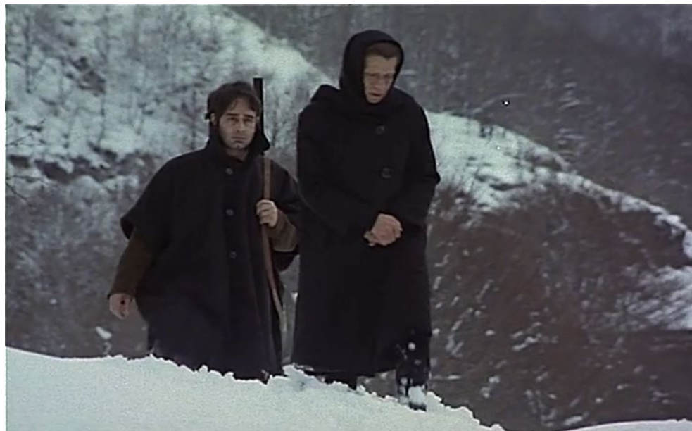
Figura 3: El matricidio como acto simbólico.

Milagros, una menor recién fugada de un reformatorio de monjas a la que ofrece cobijo en la casa familiar. Con la llegada de la joven furtiva 3 Martina es desplazada de la alcoba de su hijo y, presa de los celos, asesina brutalmente a su rival. Cuando Ángel, finalmente, descubre el terrible crimen, acompaña a su madre a la iglesia para que se confiese y la injusticia arrodillada sobre un prado nevado en medio del bosque (fig. 3).