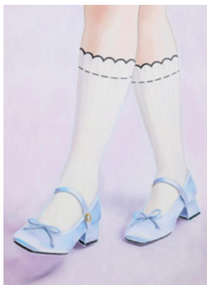
Fig. 4. «El temor de las exploradoras» (Raquel J. Molina, 2025). Óleo sobre lienzo, 116x81 cm.