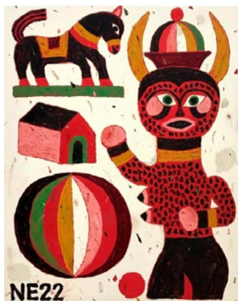
Fig. 6. «The devil with the horse and the house» (Nacho Eterno, 2022). Acrílico y stick de óleo sobre lienzo 92x73 cm.