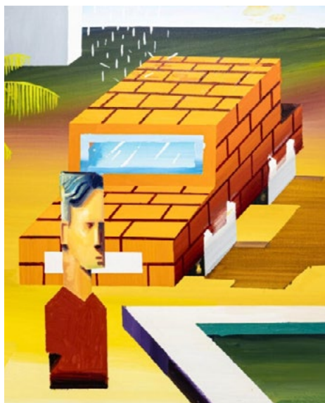
Fig. 2. «El camino al éxito» (Ramón Muñoz, 2023). óleo sobre lienzo, 162 x130 cm