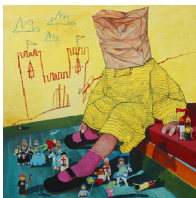
Fig. 5. «Game knights» (Félix Roca, 2024). Óleo y lápiz sobre lienzo, 80x80 cm.