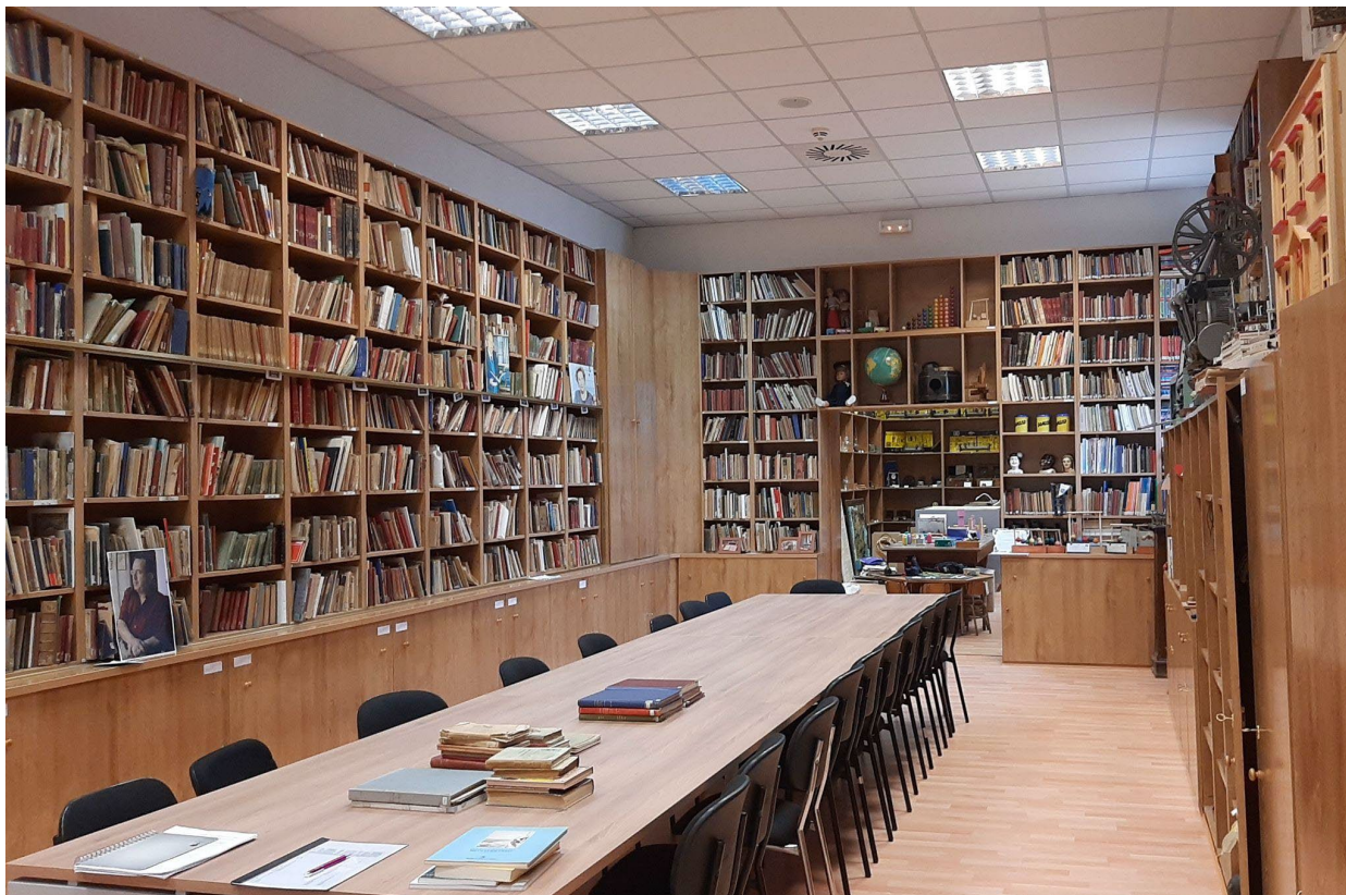
Figura 2. MCE: vista de la primera sala.

Complutense, configurando con el paso del tiempo la Colección Pedagógico Textil , que desde el año 2017 forma parte de nuestras colecciones.