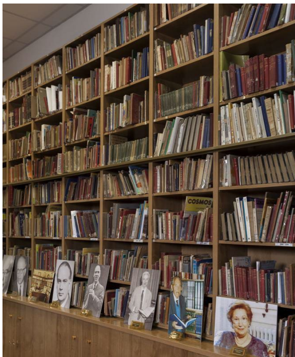
Figura 3. MCE: vista parcial de la Colección de textos didácticos, libros y prensa escolares (fotografía de los autores, 2021)

La Colección de textos didácticos, libros y prensa escolares cuenta con más de cinco mil manuales de educación primaria y secundaria de los siglos XIX y XX. Su origen es múltiple: unos proceden del Colegio Nuestra Señora de la Paloma de Madrid, otros de donaciones de particulares y, finalmente, unos cuantos de compras directas en librerías de viejo. Son una fuente de una riqueza extraordinaria para conocer la realidad científica de lo enseñado en diversos momentos de nuestro sistema educativo, así como para identificar la evolución de la metodología general utilizada y la de las diferentes didácticas especiales. Esta colección está catalogada en el fondo BIBLIOMANES del Centro de investigación MANES (Manuales escolares) 3 . Dentro de la colección se encuentra el Fondo de prensa pedagógica que incluye una selección de revistas originales de Pedagogía, editadas en su mayor parte a lo largo del siglo XX. Se trata de: Revista de Pedagogía 4 , Revista de Escuelas Normales , Vida Escolar y Cuadernos de Pedagogía . Actualmente se está llevando a cabo la digitalización de la Revista de Pedagogía .