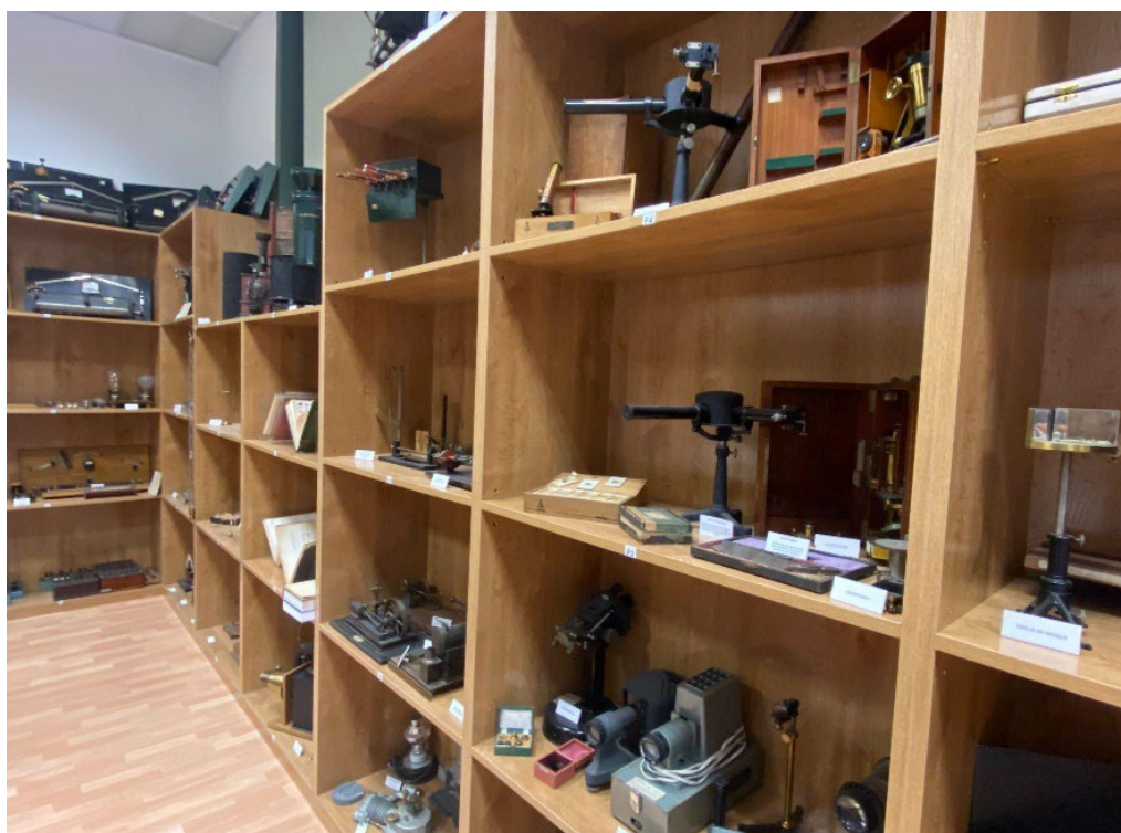
Figura 4. MCE: Vista parcial de la Colección de instrumentos para la didáctica de las ciencias experimentales (fotografía de los autores, 2022).

La Colección de instrumentos para la didáctica de las ciencias experimentales , proviene de los antiguos laboratorios de las Escuelas del Magisterio Pablo Montesino y María Díaz Jiménez , inauguradas en 1839 y 1858 respectivamente. Es un material de gran valor que se adquirió para la enseñanza de los futuros docentes y se utilizó durante los siglos XIX y XX. La colección está inventariada y catalogada e incluye en su mayor parte objetos relacionados con la enseñanza de la Física (metrología, termodinámica, óptica, mecánica, electricidad, electrónica...), tanto instrumentos reales como maquetas educativas. También existen otros objetos relacionados con la Química, en menor número ya que al ser mayoritariamente de vidrio son de difícil conservación. Una incorporación reciente es un pequeño conjunto de modelos tridimensionales de animales diseccionados, que nos ha donado el departamento de Didáctica de Ciencias Experimentales, Sociales y Matemáticas de la facultad 5 . Son unas figuras de gran realismo fabricadas en escayola por la casa Deyrolle de París, probablemente en el siglo XIX, que completan muy bien nuestra colección.