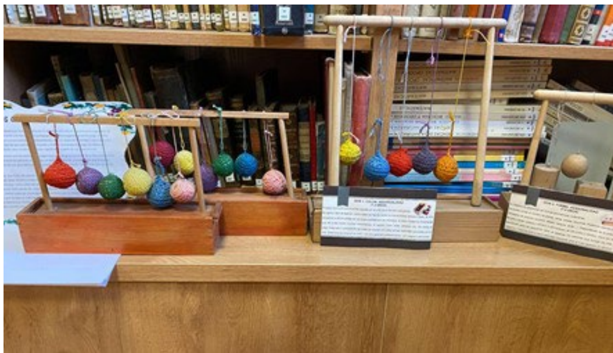
Figura 6. MCE: Colección de dones de Fröbel.