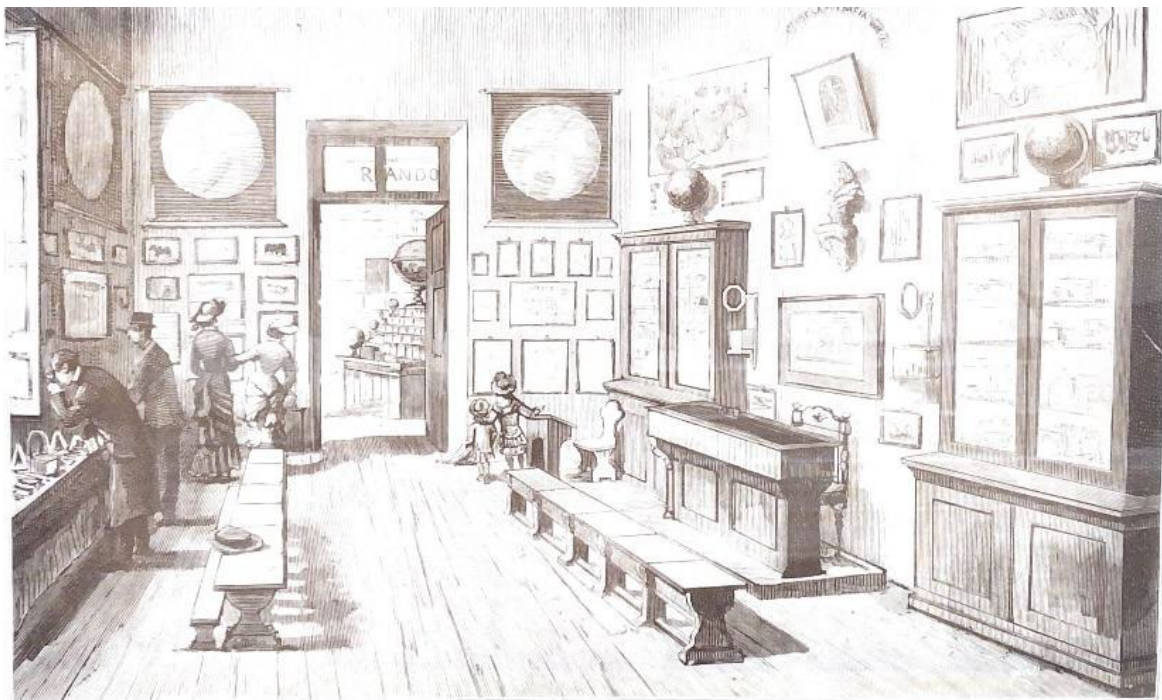
Figura 1. Imagen del Museo Pedagógico Nacional. Lámina actualmente expuesta en el Museo Complutense de la Educación (fotografía de los autores, 2022).

desarrollo del mismo, y la labor de Cossío se encaminó a incorporar los avances educativos propuestos por esta institución.