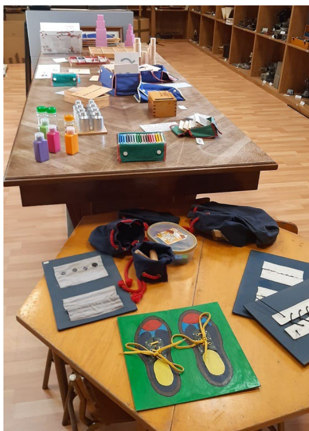
Figura 7. MCE: Colección de materiales del método Montessori.