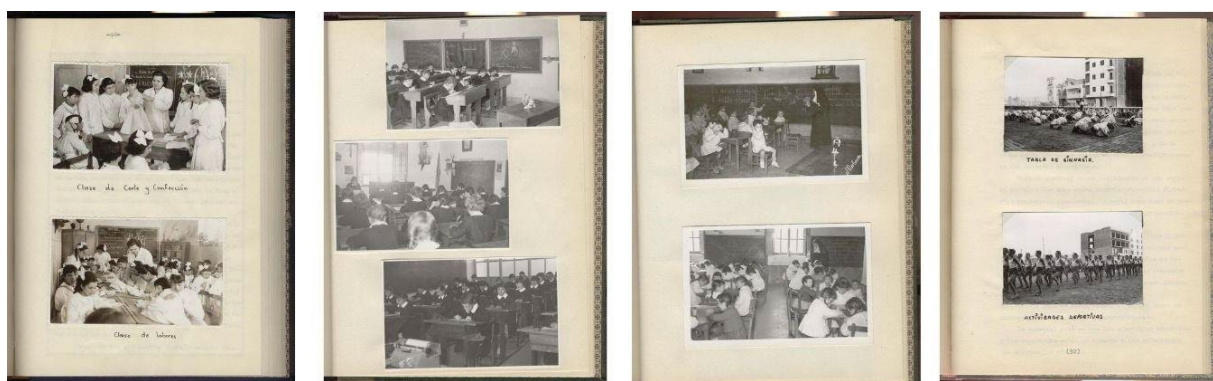
Figura 5. MCE: Ejemplo de contenidos del Fondo Romero Marín (fotografías de los autores, 2022).

La Colección Pedagógico Textil reúne aproximadamente seis mil piezas de tejido o punto, y otros objetos relacionados. Es básicamente una colección de encajes y bordados artesanales reunidos para servir de ejemplo de cómo se realizaban estos trabajos manuales. La colección se divide en ajuar e indumentaria popular, ritual y civil; bordados (piezas bordadas, muestras y dechados),