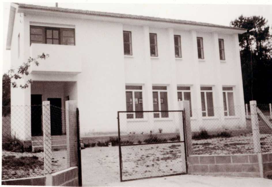
Fotografía de la Escuela de Tras do Eixo en 1982

También quedó documentada la existencia de una relación de niños nacidos de 1978 a 1980, 52, realizada el 11 de agosto de 1983, futuros asistentes de la escuela en la década de los ochenta 78 . El último informe archivado de la arquitectura escolar, en activo, es un encargo hecho en 1985 79 , de mobiliario y material: juegos didácticos para la Escuela de párvulos de Tras do Eixo, un armario y un encerado. Más de una década después, el 5 de junio del año 1998, el Ayuntamiento de Teo, solicita a la Consellería de Educación y Ordenación Universitaria, la desafectación de varios edificios escolares, entre ellos, el de Tras do Eixo. La escuela sería cerrada indefinidamente por no tener suficientes alumnos matriculados. Un mes después, el 5 de agosto, la Consellería autoriza la desafectación del edificio.