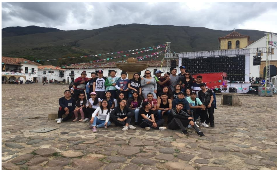
Salida pedagógica Villa de Leiva. Club de Astronomía

La institución requiere de espacios extras respecto a la clase, ambientes de aprendizaje y de sana convivencia en los cuales los estudiantes hagan un uso adecuado del tiempo libre, dado que sus entornos les hacen vulnerables ante las problemáticas del barrio, la localidad y la ciudad, como son la drogadicción, el vandalismo o la violencia, entre otras. Además, se hace necesario motivar a los estudiantes y crear espacios de reflexión frente a las riquezas de su entorno próximo y su identidad, el hallazgo arqueológico en la zona de Usme y la importancia de este a nivel científico, artístico y cultural. Específicamente, el aprendizaje de la arqueoastronomía muisca, en el marco de las actividades del club de astronomía, se perfila como elemento innovador y generador de nuevos aprendizajes en el contexto cercano de los estudiantes, generador de conocimiento y fortalecedor de los procesos identitarios. “El sentido histórico (es decir, el sentido identitario) se construye desde los objetos hasta el paisaje. Esta suerte de referentes empíricos no son nada diferentes a la concreción de la memoria social (estructurada por la historia) en un espacio social.” (Zambrano & Gnecco, 2000. p. 184)