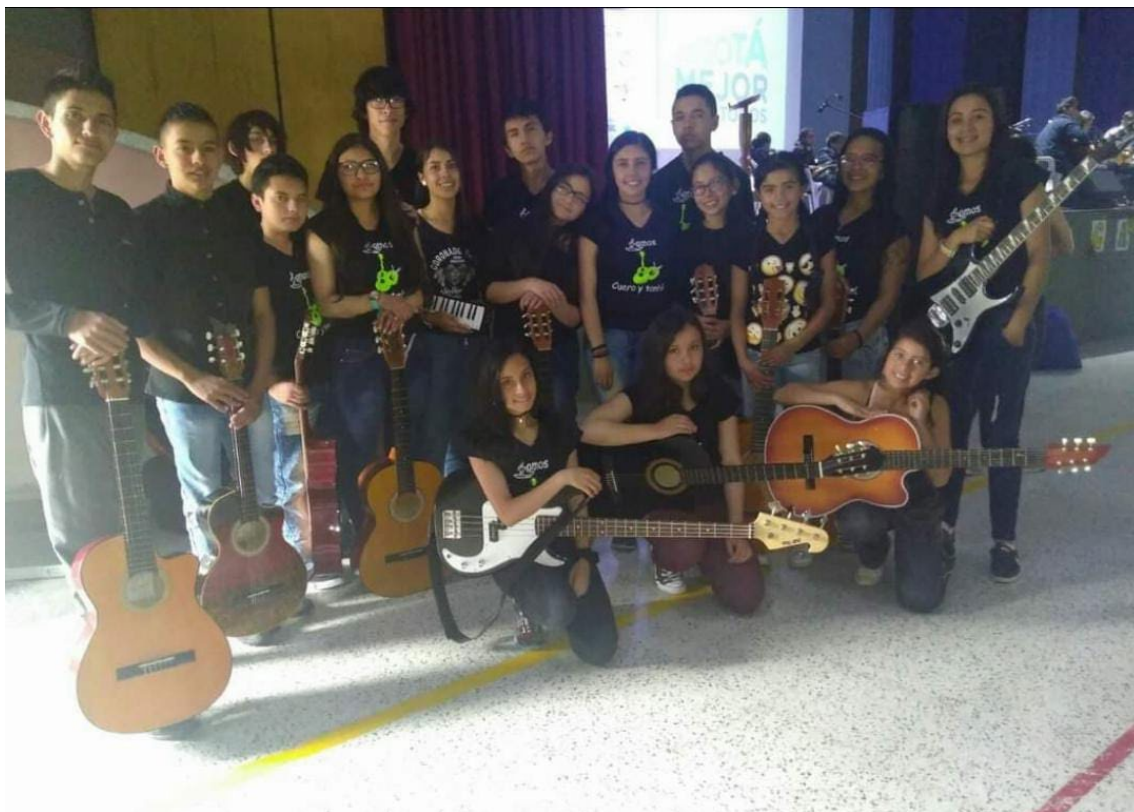
Foro educativo (2019). Agrupación Cuero y Tambó

tomando el grupo una perspectiva de experimentación sonora desde la fusión de músicas tradicionales y Word music .