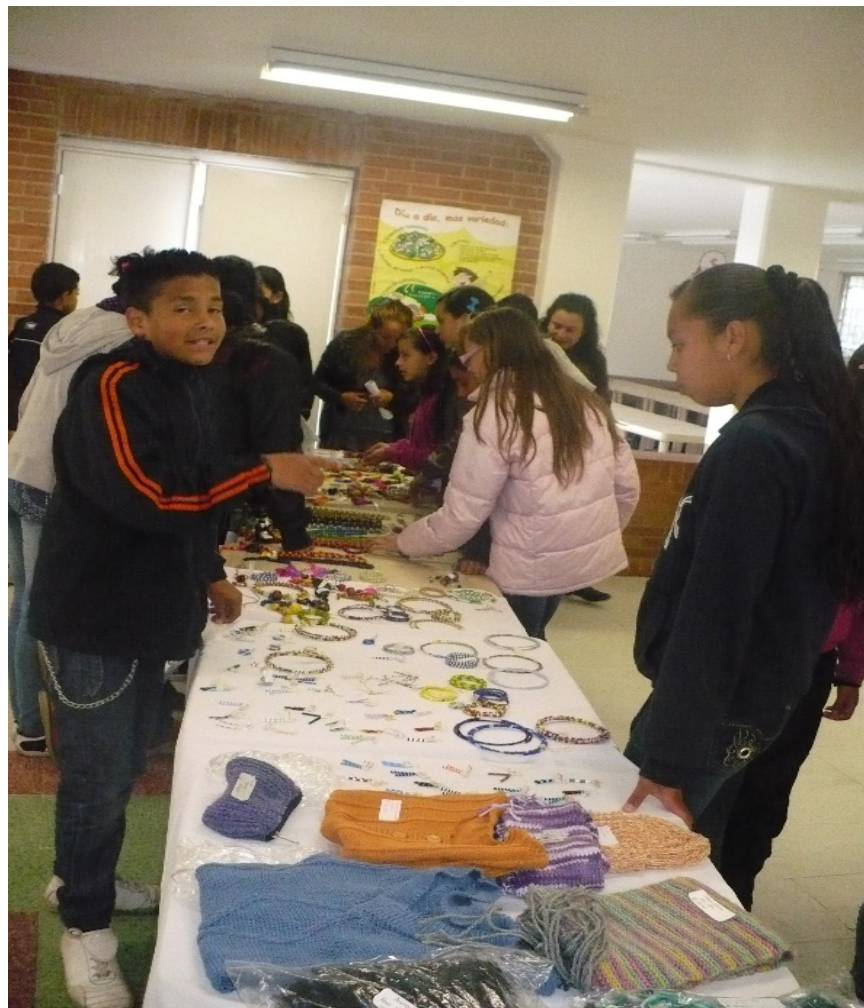
Proyecto Aprendizajes productivos a través de la producción etnocultural.

Este proyecto pedagógico también ha comprendido el intercambio de saberes con comunidades indígenas de la región (Cabildo de Sesquile, Tubu Marimasa-Sirianos del Vaupés), más la población campesina del sector. Los niños aprenden diversas enseñanzas por parte de estas comunidades, tales como tejidos en lana y mostacilla, talleres de palabras en lengua muisca, cultivos de alimentos tradicionales, entre otras prácticas. Este proceso se llevó a cabo con el objetivo de rescatar usos y costumbres que con el paso del tiempo han sido olvidados por la población urbana del sector y que son importantes para el fortalecimiento del patrimonio en la localidad. “El reconocimiento de la condición de ser indígena está atravesado por un proceso de identificación colectiva, tanto dentro del mismo grupo como hacia el exterior. Se trata de consolidar una alteridad basada en la pertenencia a un grupo social poseedor de una diferencia cultural sustancial y, en muchas ocasiones, esencial.” (Gómez, 2005, p. 334)