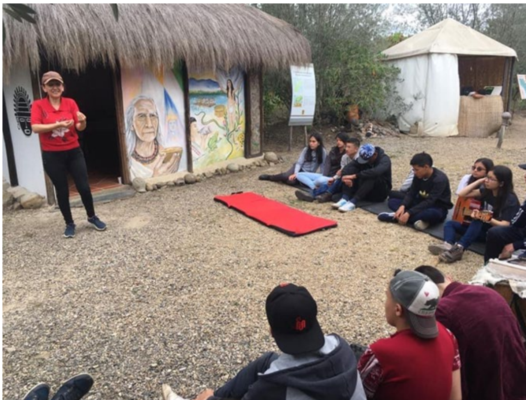
Salida pedagógica Villa de Leiva. Club de Astronomía