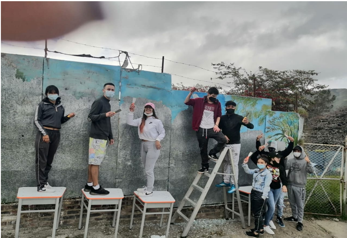
Elaboración mural, Colegio Atabanzha, institución educativa distrital