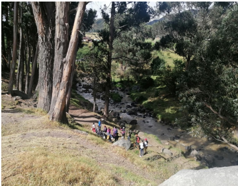
Salida pedagógica proceso comunitario, reconocimiento del patrimonio local histórico y ambiental

Con respecto a sus habitantes, se deduce en los relatos de la población campesina el arraigo o anclaje a la tierra, mientras que lo “indígena” y lo “rural” son partes fundamentales del espíritu del lugar que aún se conservan territorialmente. En este palimpsesto hecho espacio, vive la gente de Usme; un paisaje que se resiste a desaparecer y se defiende a partir de los lugares escondidos, que aparecen en el avance de la modernización de la ciudad, denominados por algunos grupos sociales del lugar como patrimonio cultural. Esto se hace evidente con la organización de grupos de habitantes que se preocuparon por mantener la memoria histórica en los barrios emergentes y en las veredas.