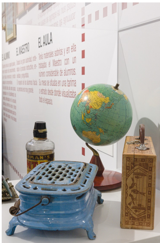
Iconos de la cultura material de la escuela