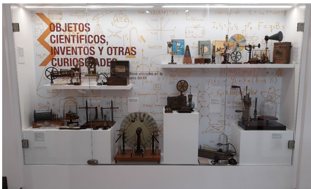
Vitrina dedicada a objetos científicos, inventos y otras curiosidades

Sin entrar ahora en la historia de la enseñanza de las ciencias en España, hay que indicar que lo habitual era enseñar a los alumnos los instrumentos y describir su funcionamiento sin llevar a cabo la experiencia. En el caso de realizar una demostración, esta corría a cargo del catedrático o de un ayudante (el demostrador) mientras los alumnos sólo observaban. Esto era debido a que el instrumental científico era un material de muy costosa adquisición, sofisticado y en muchas ocasiones de complicado manejo. Estas puestas en escena son lo que se denominaron “demostraciones de cátedra”, complemento a las explicaciones del profesor.