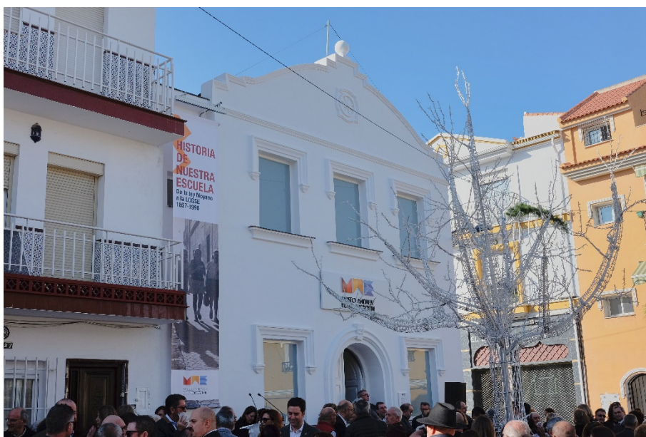
Fachada principal del MAE el día de su inauguración

Su creación responde a la importancia que hoy se concede a los espacios dedicados a conservar y transmitir la memoria histórica, algo que va más allá del currículum académico (Ruiz Berrio, 2010). Ha significado una apuesta clara por parte del Ayuntamiento de Alhaurín de la Torre por la educación y la cultura y pretende ser un punto de atracción de toda la comarca, incluida la capital de la que sólo dista 17 Km.