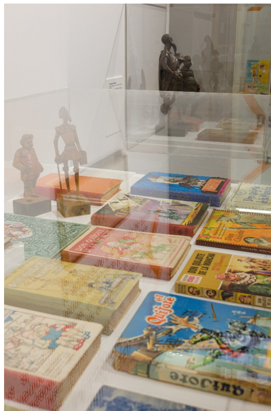
Espacios del MAE