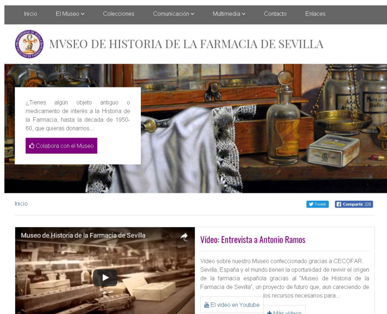
Fig. 9. WEB del Museo: http://institucional.us.es/museohistfarm

Del mismo modo, para reafirmarnos en que el Museo es un ente vivo, creamos perfiles en las redes sociales Facebook -figura 10- y Twitter.