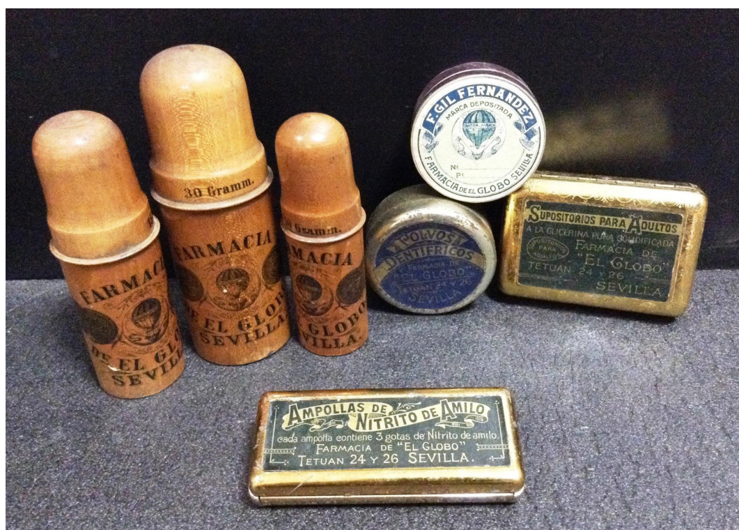
Fig. 8. Piezas de la farmacia “El Globo” donadas al Museo.