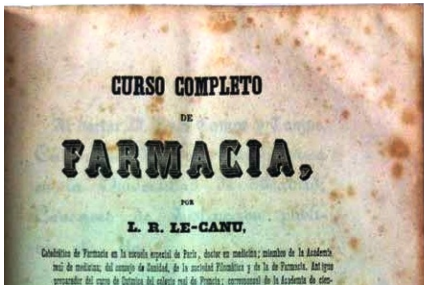
Fig. 3. Curso completo de Farmacia por L.R. Le-Canu. Tomo I. Farmacia-Química. Imprenta de Don José María Alonso. Madrid. 1848.

En la visita a esta colección lo primero que se aborda es la “ Oficina de Farmacia ”. En ella encontramos la mesa de despacho proveniente de la clausurada “ Farmacia Gallego ”. En esta sección tenemos abundante material escrito -figura 3-