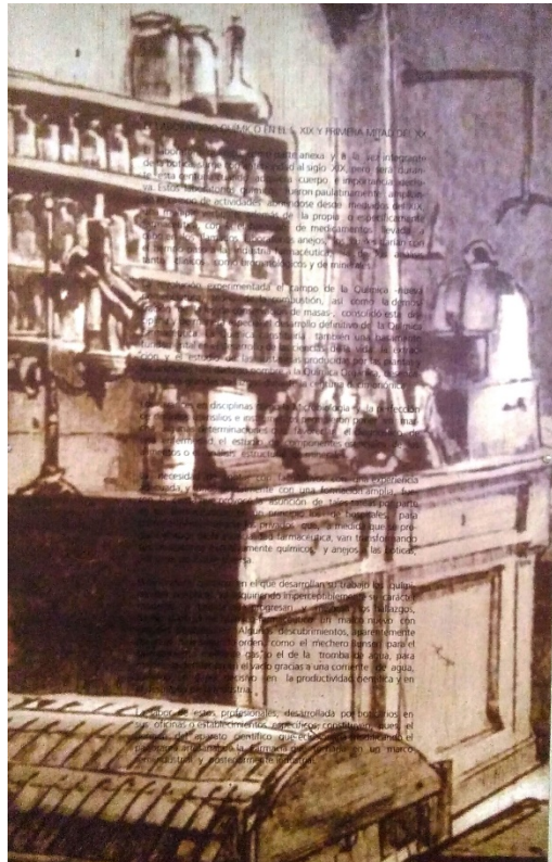
Fig. 2. Paneles explicativos.

también empleamos la Facultad en general. Usamos, por ejemplo, paneles explicativos en los pasillos -figura 2-.