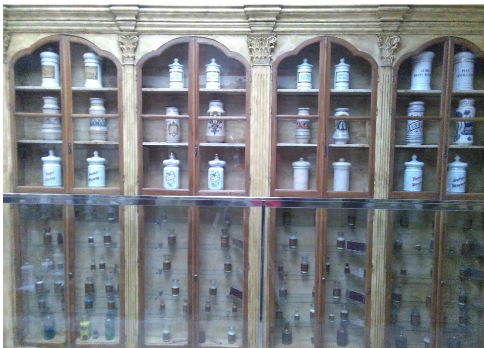
Fig. 7. Anaqueles de la antigua farmacia de la Calle Feria 116 esquina con Relator de Sevilla.