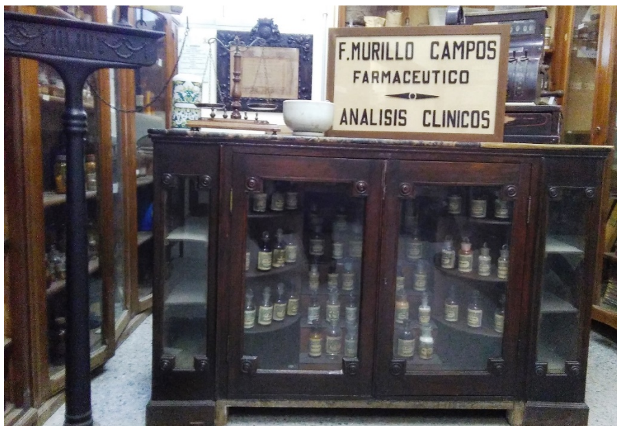
Fig. 1. Museo de Historia de la Farmacia de Sevilla.

La exposición ha conseguido ser permanente - figura 1-, y se dispone a dar continuidad a aquella idea original del Museo de la Historia de la Farmacia de Sevilla. Se forja entonces una identificación del visitante en torno al patrimonio, en un ensamble cultural, un diálogo entre sociedad, farmacia, ciencia y visitante (RUIZ, RAMOS, 2017: 50,67).