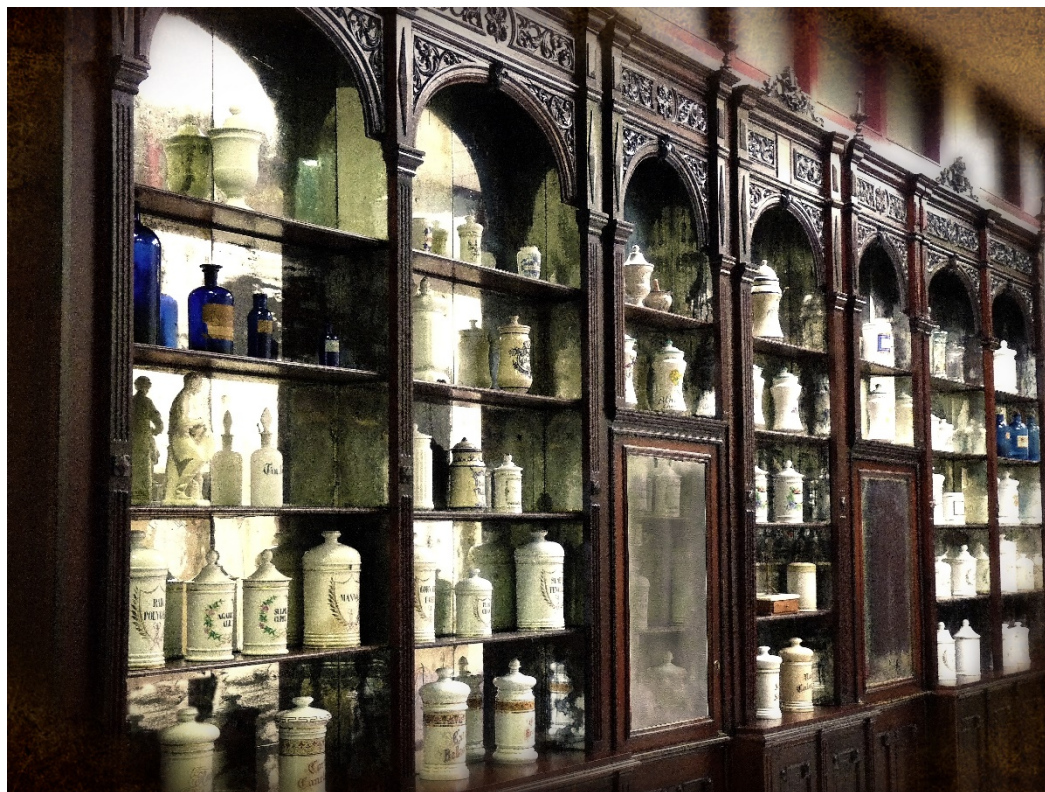
Fig. 6. Anaqueles de la antigua farmacia de la Plaza del Salvador de Sevilla.