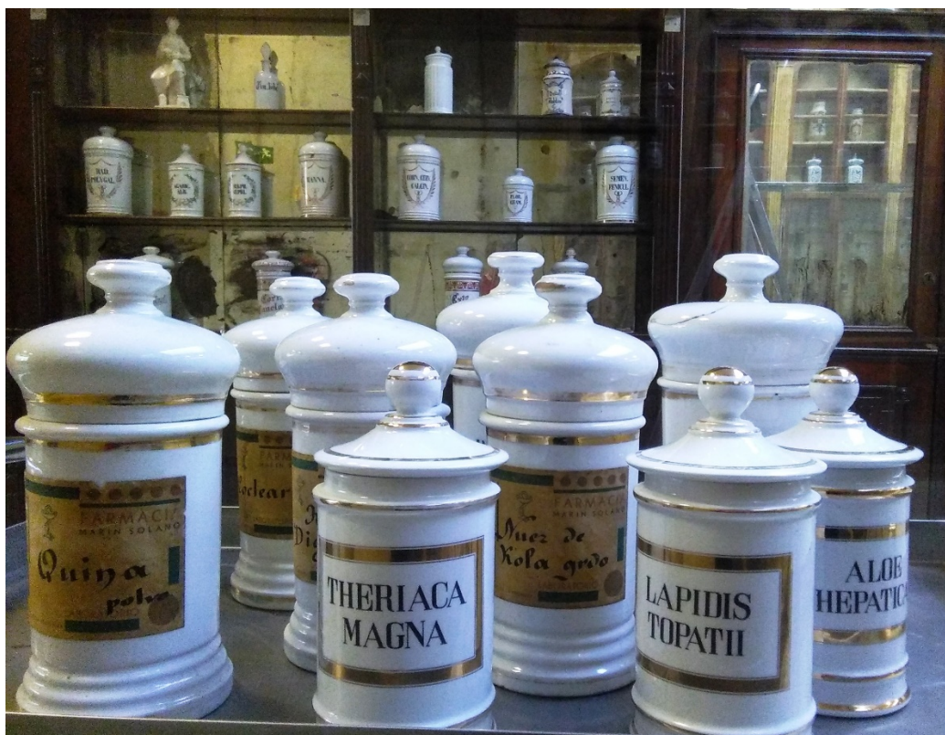
Fig. 4. Albarelos.

Un ambiente de morteros, balanzas y granatarios, capsulador para cachets, pildoreros, albarellos - figura 4-, rieleras, moldes para óvulos y supositorios, y otros utensilios que ayudan a la confección de fórmulas magistrales y medicamentos, forman parte de la colección (RUIZ, RAMOS, 2014: 11-13).