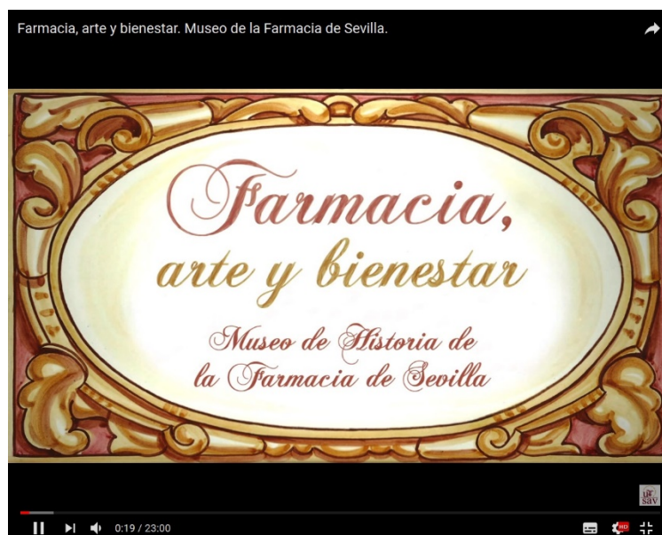
Fig. 11. Vídeo didáctico Farmacia, arte y Bienestar. https://www.youtube.com/watch?v=XUyNxBJa1y4&feature=youtu.be