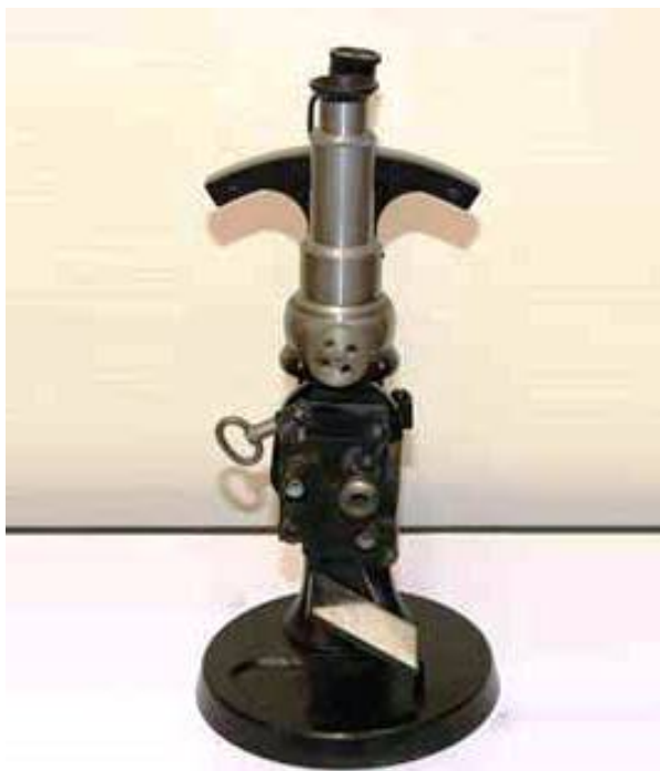
Fig. 5. Refractómetro de Abbe.

Y, por último, dentro del apartado de Patrimonio se exhiben las “ especialidades farmacéuticas ”. En el siglo XIX los avances científicos hicieron que en el campo farmacéutico se iniciara el citado proceso de industrialización del medicamento que afectó tanto a la elaboración como a la forma farmacéutica que estos adquieren para su dispensación, pues surgieron otras nuevas que vinieron a sumarse a las tradicionales píldoras, jarabes o a los elixires (RAMOS, RUIZ, 2014: 38-42).