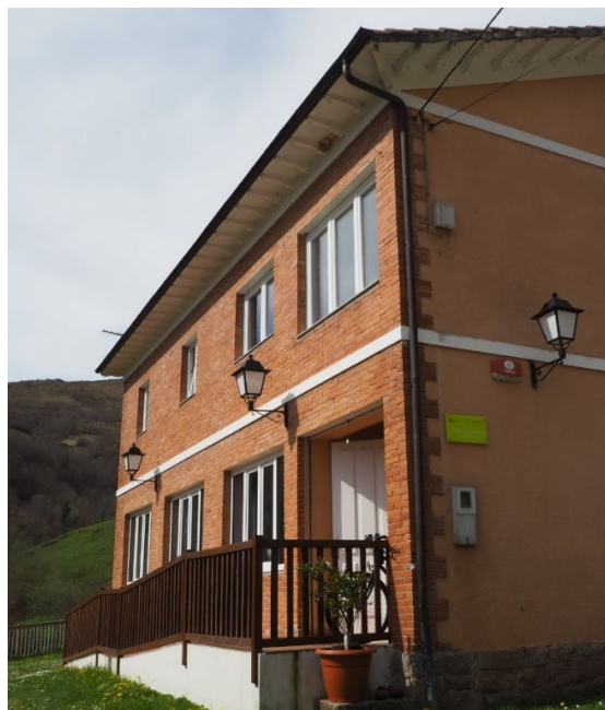
Fotos 12 y 13: La escuela de Lafuente (Lamasón) en 1982 y en la actualidad, convertido en albergue.