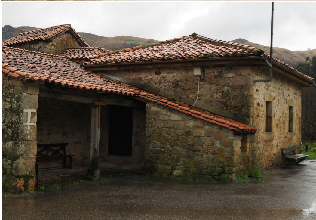
Fotos 18 y 19: La escuela de Coterillo en 1988 y el aspecto actual del edificio

Los dos cursos siguientes estuve destinado en la escuela unitaria de Llerana. También aquí me tocaron obras. Recuerdo que un día recibimos la visita del director provincial de Educación, que