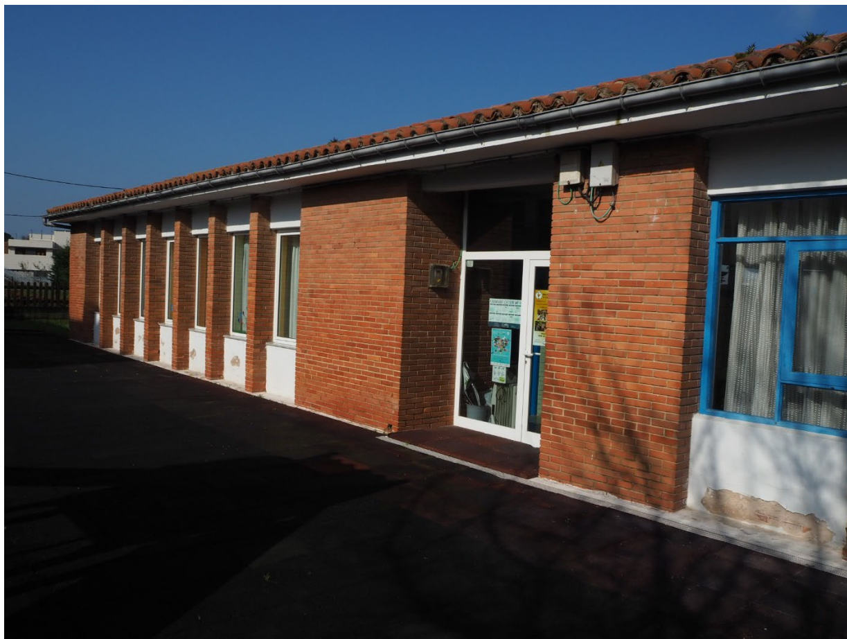
Fotos 8 y 9: La escuela de Mogro en 1985 y en la actualidad

Los dos cursos siguientes estuve destinado en Cuchía (Miengo). Allí residimos en una casa de maestros en el pueblo Cudón. El colegio está situado en una zona cercana a la playa, pero también a una cantera, que por aquel entonces funcionaba. El entorno estaba bastante degradado.