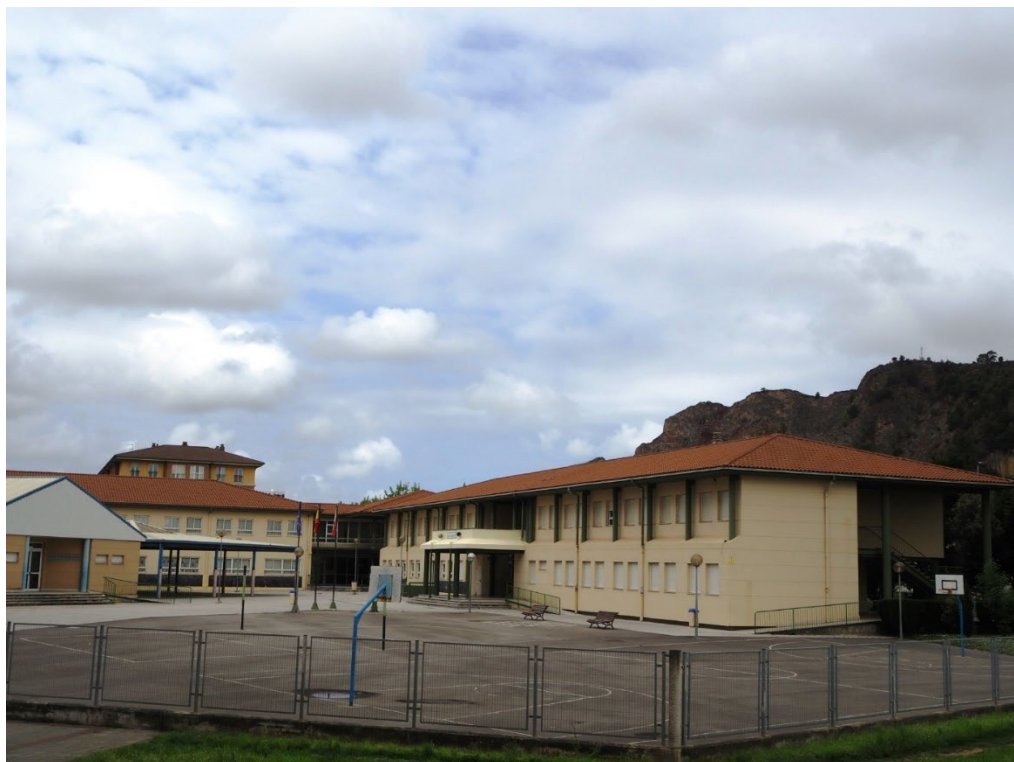
Fotos 20 y 21: El colegio de La Reyerta en 2001 y ahora, que se llama CEIP Elena Quiroga.

En 2016, llegó la hora de parar y descansar de todo este recorrido profesional... y vital.