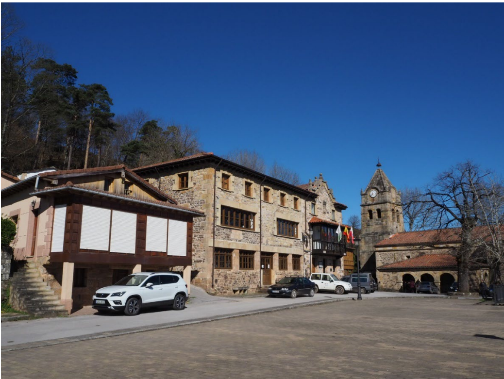
Fotos 16 y 17: Las escuelas de San Pedro del Romeral en 1980 y en hoy en día