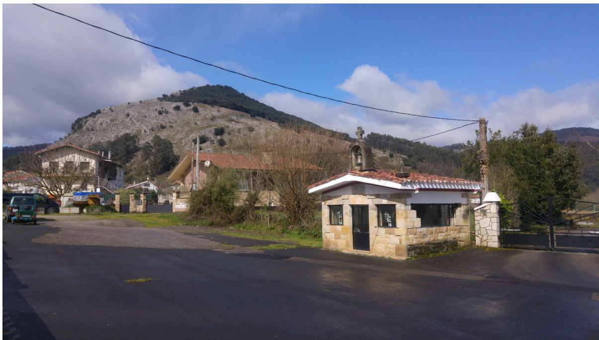
Fotos 2 y 3: La escuela de Helguera (Sámamo, Castro Urdiales) en 1983 y su “huella” apenas perceptible en la actualidad

El martes trece de marzo decidí hacer una excursión a la cueva de El Soplao. Cuando fui a comprar la entrada, me saludó una sonriente joven. Resultó ser una antigua alumna del colegio comarcal de Treceño. Me llevé una gran alegría, recordamos anécdotas y revivimos historias.