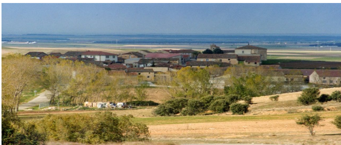
(Vista panorámica de Otones)

Educational heritage; pedagogical museums; eschool ethnography; school material history; educación history; rural development.