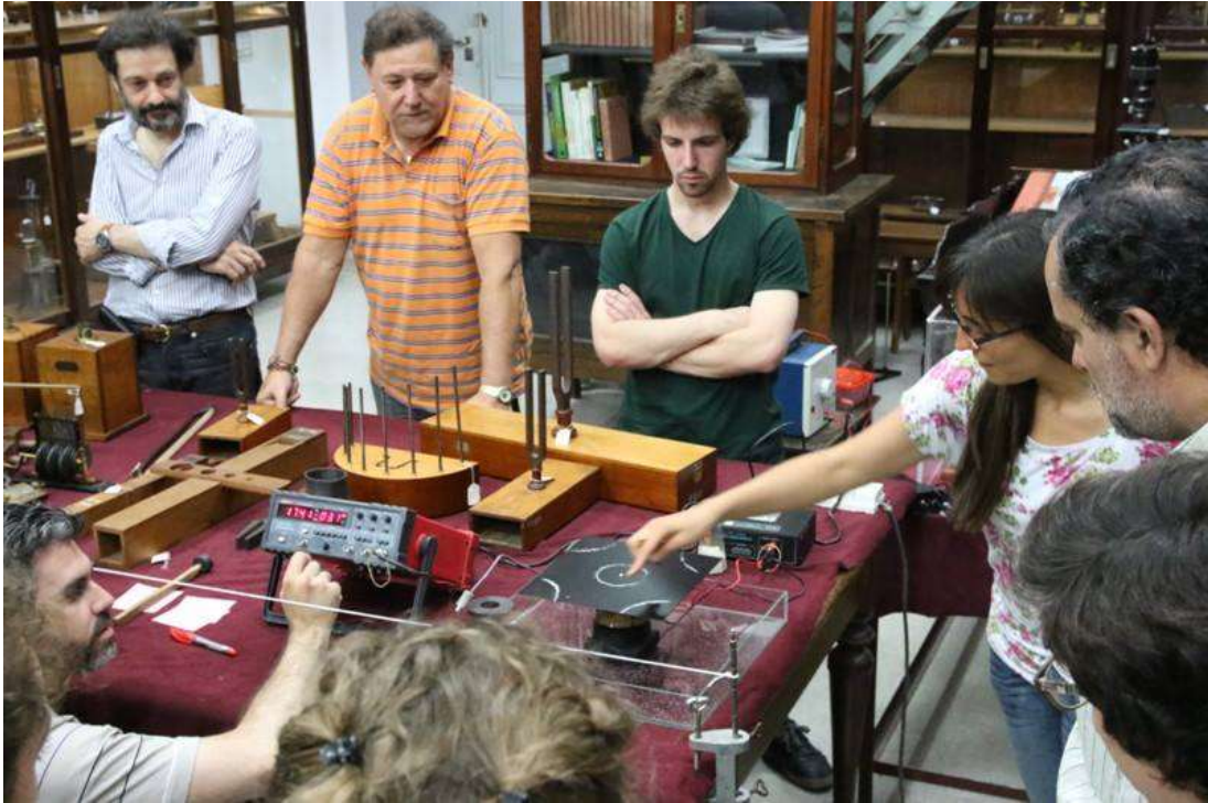
Imagen 4: Clase de acústica dirigida a estudiantes de música de la UNLP.