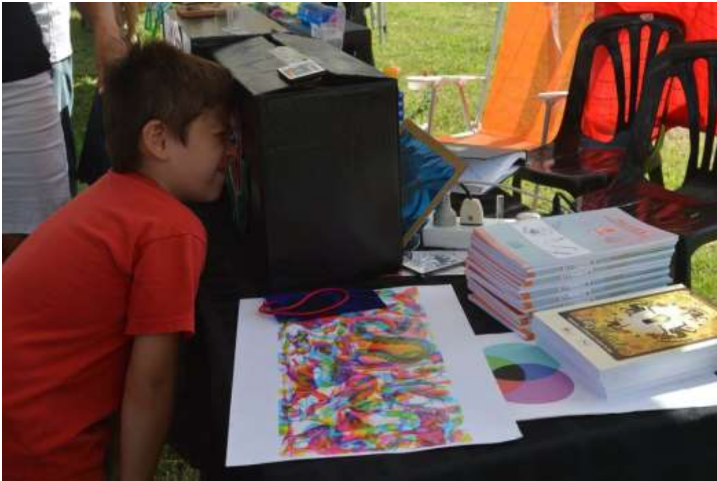
Imagen 8: Experiencias de óptica en la “Feria del tomate platense”.