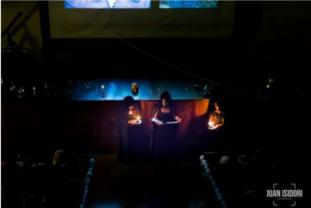
Imagen 12: Inicio del espectáculo: “De Magia Veterum”.