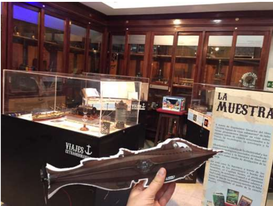
Imagen 9: Parte de la muestra itinerante “Viajes extraordinarios”.