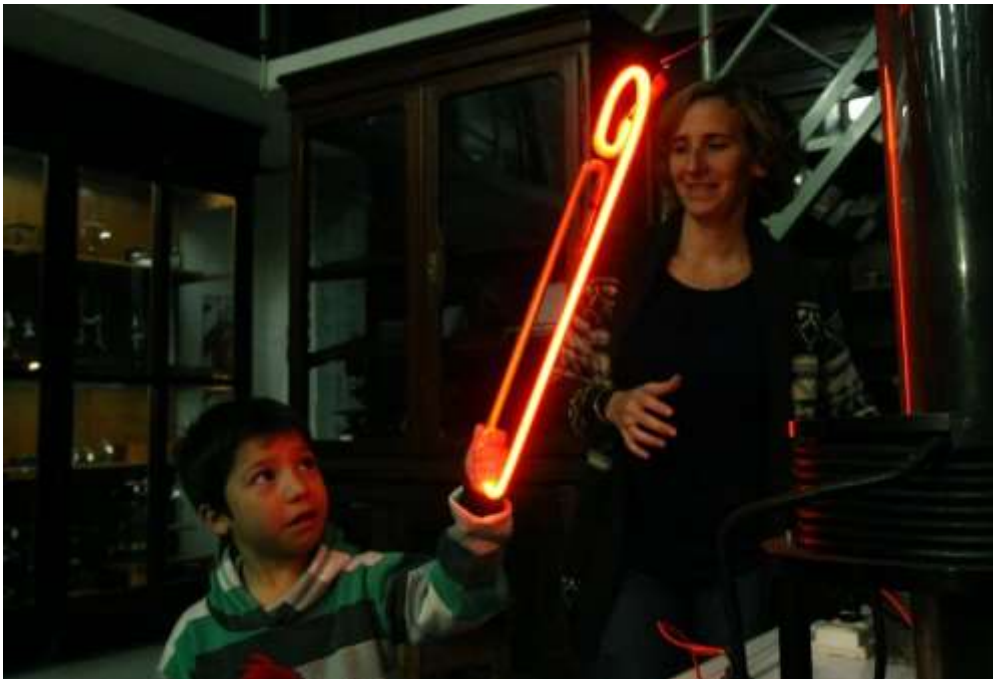
Imagen 3: Tubo de neón encendido con la bobina de Tesla.