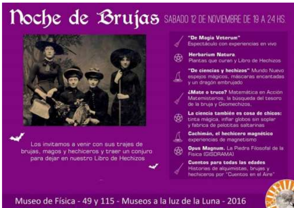
Imagen 11: Flyer de la última edición de "Museos a la luz de la luna".