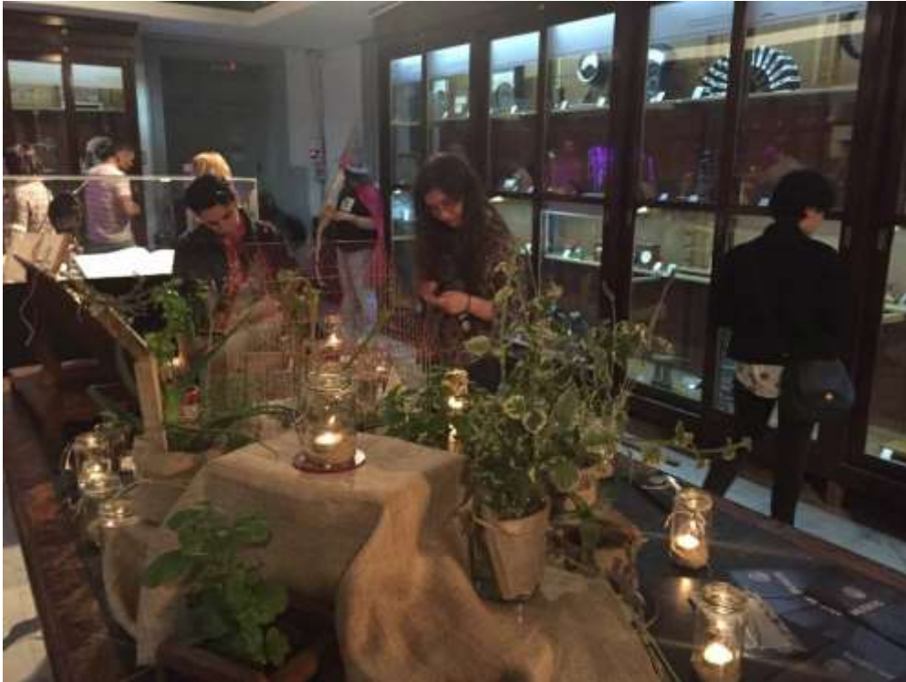
Imagen 2: Sala del Museo en “Museos a la luz de la luna, edición noche de brujas”