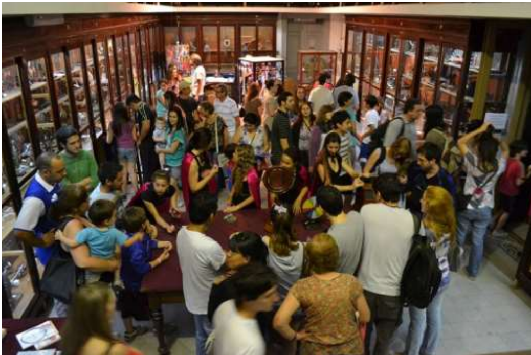
Imagen 1: Sala del Museo en “Museos a la luz de la luna, edición superhéroes”.