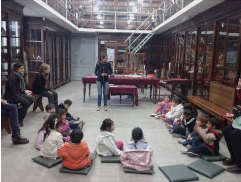
Imagen 6: Clase de magnetismo dirigida a alumnos de nivel inicial.