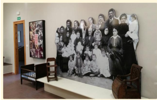
Diorama de una familia de los años 20 del siglo pasado en la localidad albaceteña de Chinchilla.

Este espacio está dedicado al niño en el contexto familiar a lo largo del tiempo, cómo ha evolucionado la familia (de la troncal a la monoparental), el papel de los padres y los abuelos en la educación de los hijos y los nietos y el ajuar infantil.