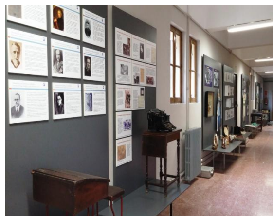
Exposición: Pedagogos de Castilla-La Mancha