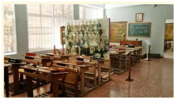
Escuela de la República

Es de destacar en ella, pupitres bipersonales, que, aunque su origen data de los años 80 del siglo XIX y estuvieron presentes en todos los periodos históricos (desde la Restauración hasta los primeros años de la Transición Democrática), la gente mayor los recuerda de la época del franquismo. Estos pupitres proceden de las antiguas escuelas de Lezuza y Tiriez (años 50 y 60 del siglo XX). También son típicas de esta época las huchas del Domund o Santa Infancia, así como las Enciclopedias Álvarez.