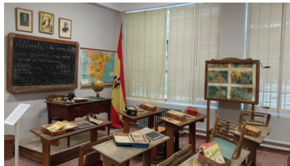
Escuela de la dictadura