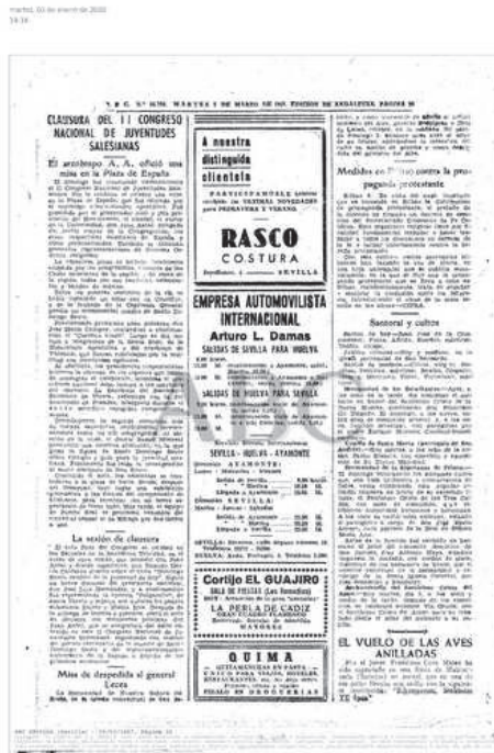
Notas sin archivar página 3

Algunos días después, el Director territorial del Proyecto Don Bosco, me enviaba copia de uno de los documentos conservados en el Archivo Inspectorial. El redactor hablaba de «El festival recreativo», acompañando la crónica de cinco fotografías, dos de las cuales ocupaban la parte inferior, y estaban unidas para ofrecer una panorámica del albero del ruedo de la Maestranza.