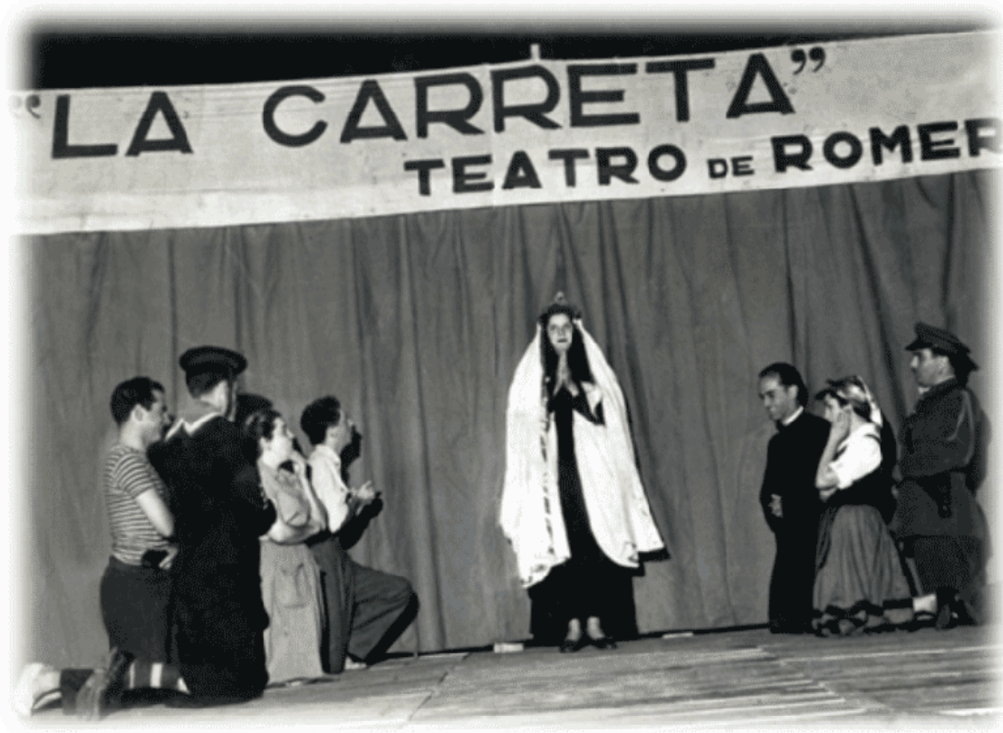
Imagen de una representación del grupo LA CARRETA.