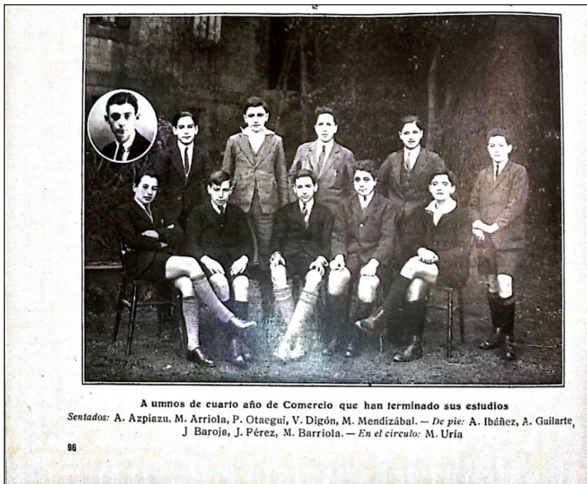
Imagen 5. Inclusión mediante collage de la fotografía del alumno ausente sobre la del grupo escolar que le corresponde.