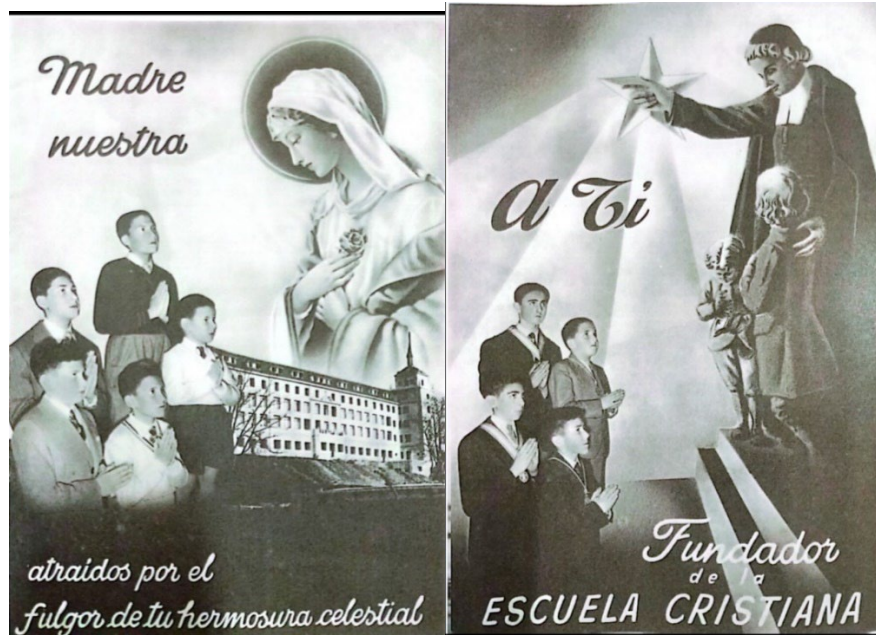
Fuente: Memoria escolar del Colegio La Salle, La Salle, San Sebastián, 1953-1954, pp. 2-3.