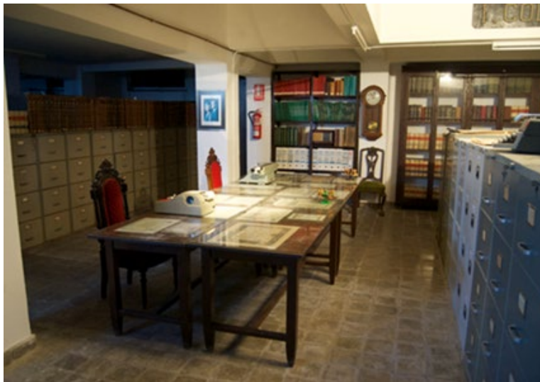
Imagen 5. El archivo del Instituto Columela de Cádiz.

Por la bibliografía y el amplio patrimonio documental del instituto (libros, artículos, actas y documentos), podemos conocer muchos detalles de la memoria del instituto (Pettengui, 988: 176). De hecho, las actas de sus claustros son un fiel reflejo de la realidad cotidiana del centro. Los acuerdos tomados por el profesorado, entre ellos la decisión de levantar unas monografías sobre sus directores hace que realmente se manifieste una fuerte tendencia a fijar la memoria del instituto.