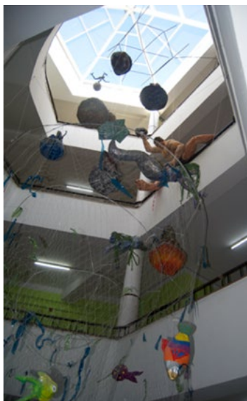
Imagen 4. Vistas de la escalera del Instituto Columela.