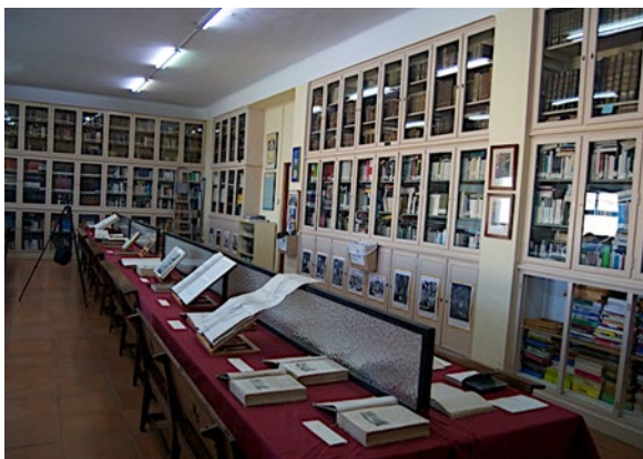
Imagen 10. Biblioteca. Instituto Columela (Cádiz).