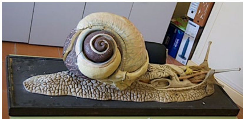
Imagen 8. Maqueta o modelo didáctico. Instituto Columela Cádiz.