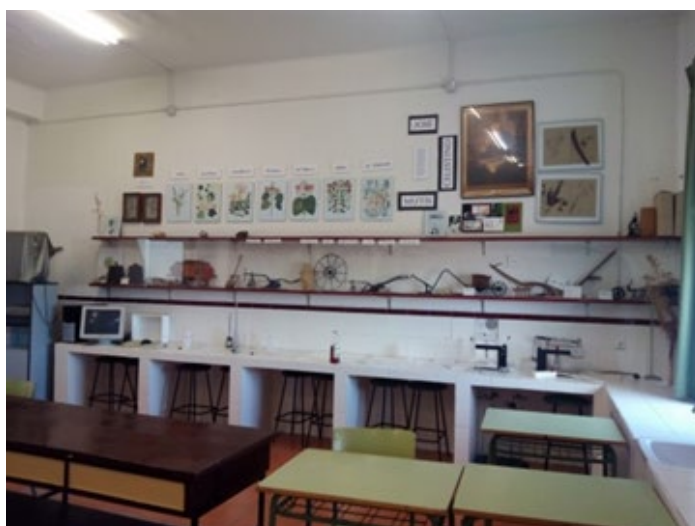
Imagen 9. Piezas del Gabinete de agricultura y aula. Instituto Columela (Cádiz).

En este apartado se ha dado información sobre las piezas científicas, un legado que heredó el Instituto Columela de fechas anteriores a la Guerra Civil y al Franquismo. Parece que en este periodo no se mostró interés por estas piezas antiguas, antes bien, quedaron en el olvido. .