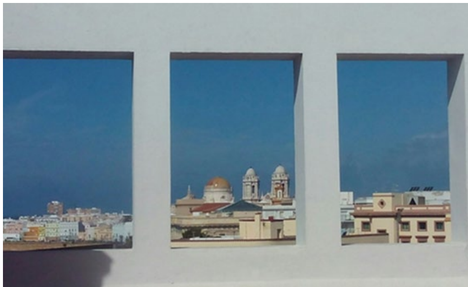
Imagen 1. Vista de Cádiz, desde la biblioteca del Instituto Columela.